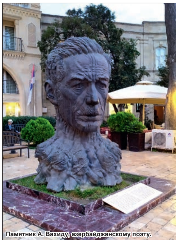
Памятник А. Вахиду, азербайджанскому поэту.