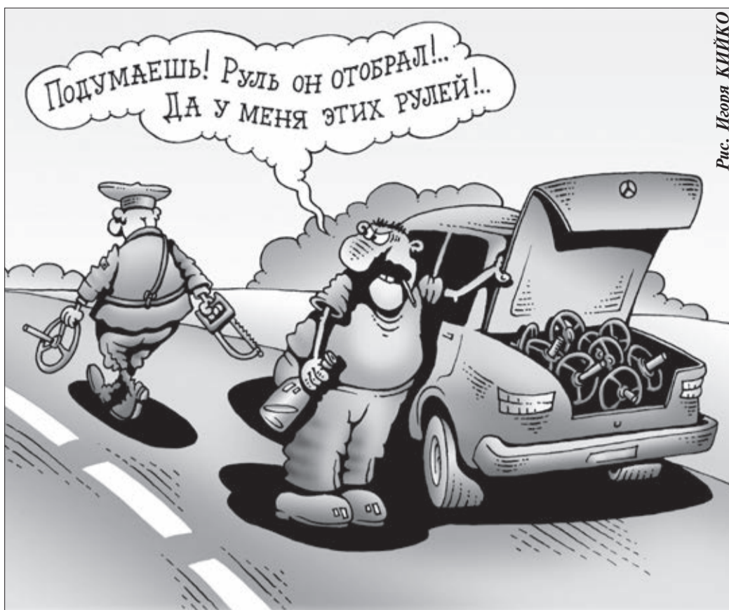
Рис. Игорь КИЙКО

За ГРУБЫЕ нарушения ПДД санкции предусмотрены жёсткие. Минимальное наказание за езду в нетрезвом виде — тридцать тысяч рублей штрафа и лишение водительских прав на полтора года. Дальше по нарастающей, вплоть до уголовной ответственности. Однако суровое законодательство горячие головы не уре-