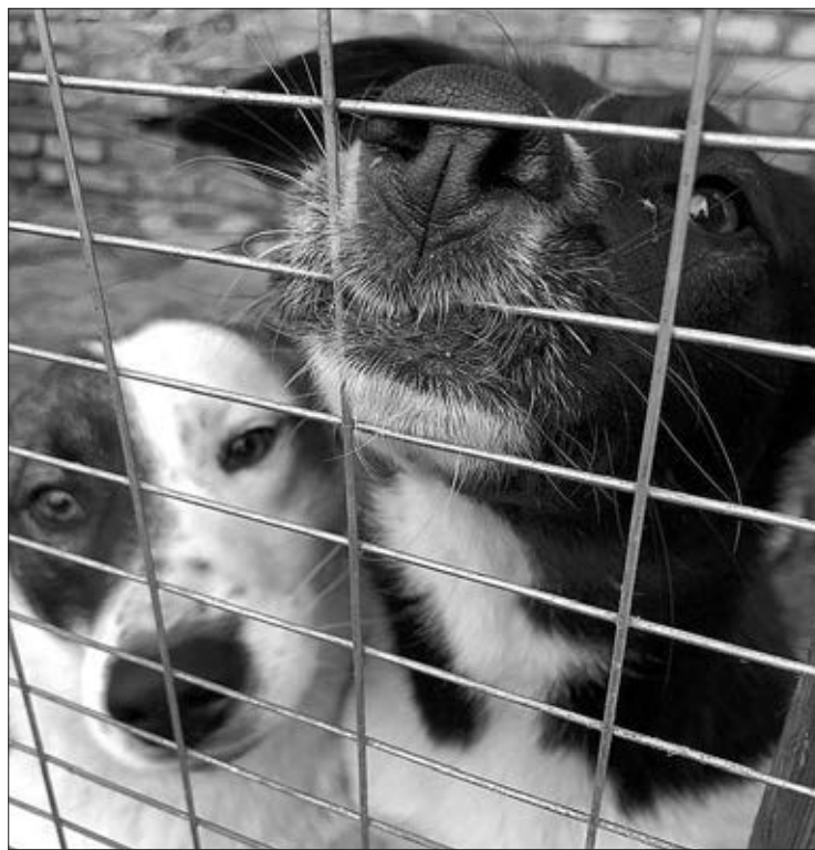
Вошьеры местных «собачьих» общественников уже переполнены.

Надо сказать, что в последние годы эта система стала давать ощутимые сбои. Хотя на организацию отлова бездомных животных выделялись бюджетные деньги, желающих их заработать было немного. Суммы в 700 тысяч рублей в год не хватало даже на то, чтобы направлять стрелков на