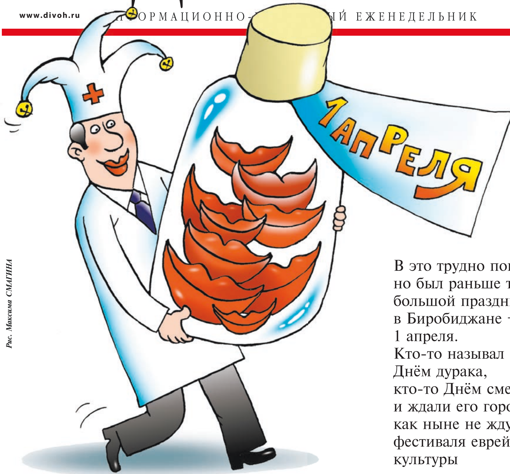
Рис. Максима СМАГИНА

ИНФОРМАЦИОННО-РАЗВЛЕКАТЕЛЬНЫЙ ЕЖЕНЕДЕЛЬНИК