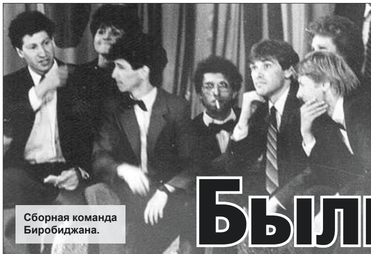
Сборная команда Биробиджана.