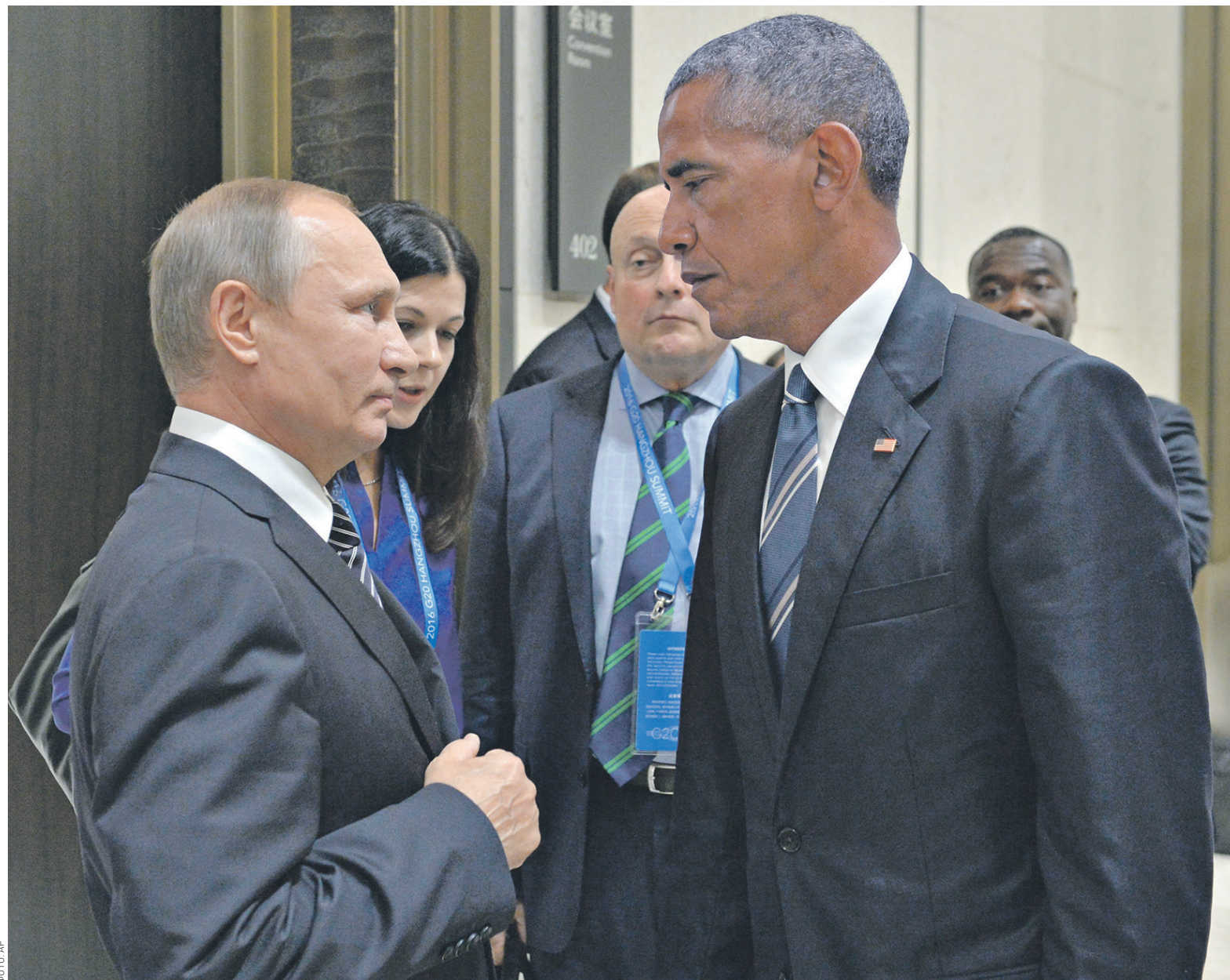
По словам Владимира Путина (на фото слева), во время встречи с Бараком Обамой тема отмены санкций против России затрагивалась лишь вскользь — лидеры двух стран обсуждали преимущественно ситуацию в Сирии

В трехстороннем формате с президентом Франции Франсуа Олландом и канцлером Герма-