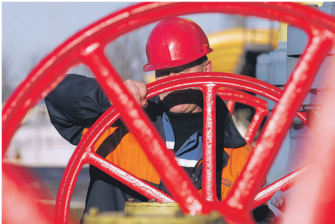
В Якутии и в других регионах Восточной Сибири до сих пор компания НОВАТЭК практически не была представлена

Сейчас добыча газа, газового конденсата и нефти ведется на