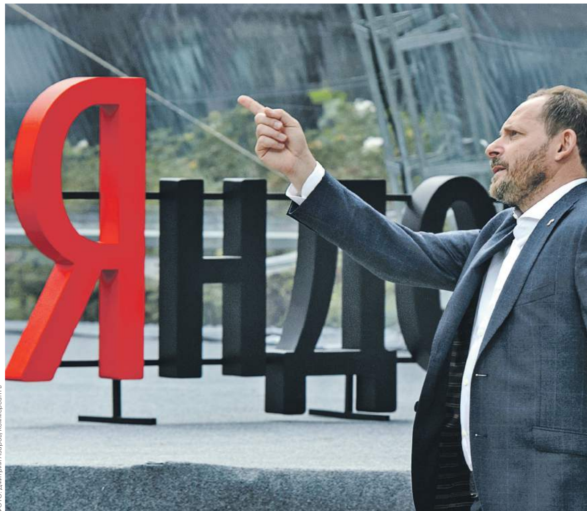
В «Яндексе» ожидают, что «Алиса» позволит увеличить количество установок как поискового приложения, так и других продуктов, в которые будет интегрирован голосовой помощник. На фото: сооснователь и гендиректор «Яндекса» Аркадий Волож

«С «Алисой» можно разговаривать так же, как с человеком. Например, у нее можно спросить: «Где поблизости выпить кофе?», а