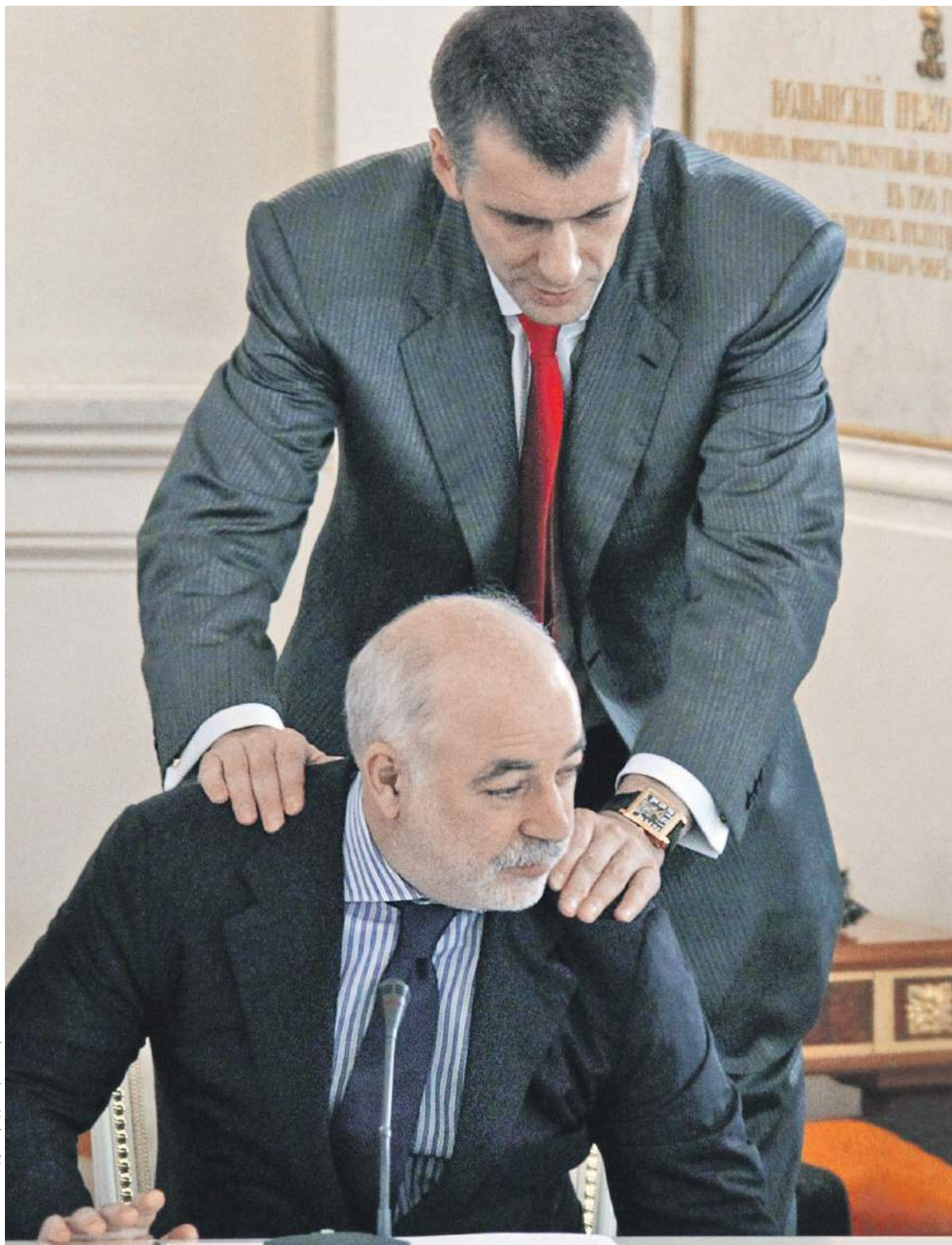
Предприниматель Виктор Вексельберг (на переднем плане), продавая акции UC Rusal вместе с предпринимателем Михаилом Прохоровым, может заработать $70 млн