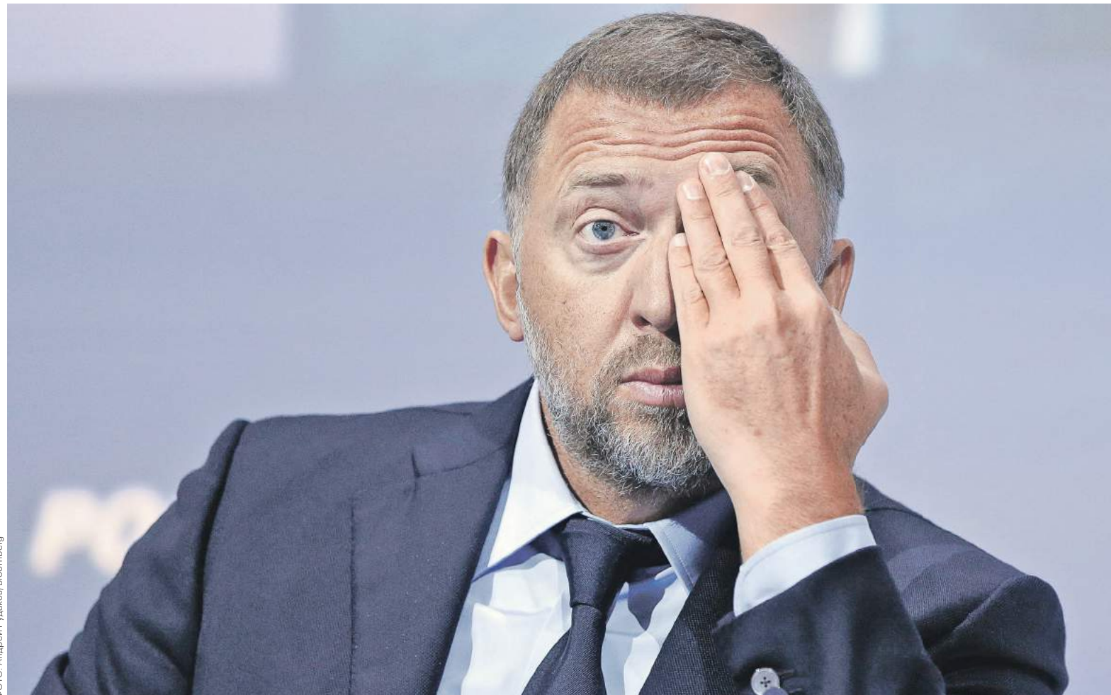
Олег Дерипаска, владелец En+, которой принадлежит 48,13% в UC Rusal, с лета 2016 года внимательно следил за переговорами ОНЭКСИМа и Sual Partners о продаже акций UC Rusal

En+ объявила об IPO в Лондоне и Москве в минувший четверг, 5 октября. Компания хочет привлечь около $1,5 млрд, объем размещения неизвестен, банк-организатор оценил ее в $9–12 млрд. IPO обещает стать первым размещением российской компании в Лондоне с введения Западом санкций против России в 2014 году. Представитель En+ от комментариев отказал-