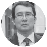
Тимур Жаксылыков Евразийская экономическая КОМИССИЯ