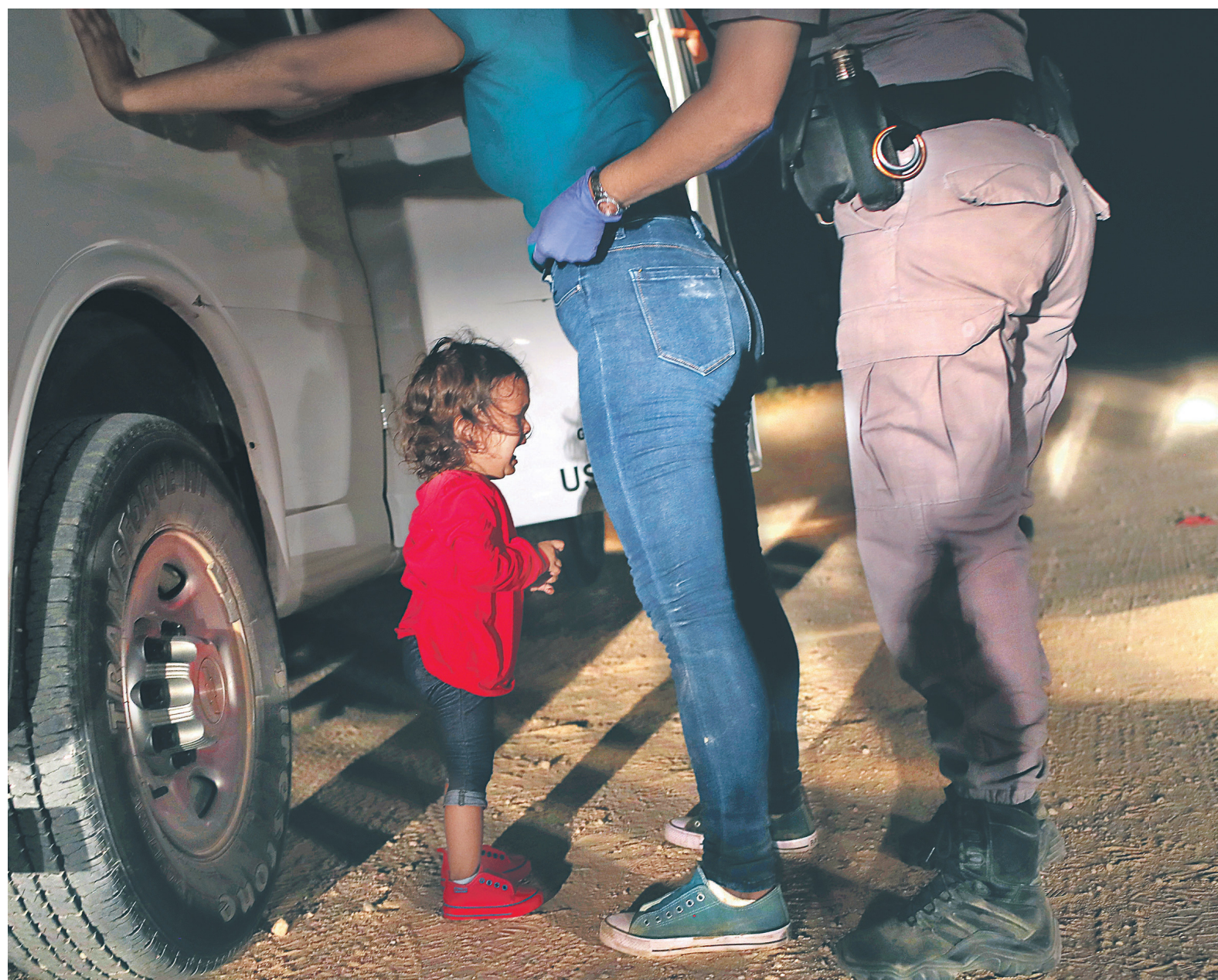
С апреля при незаконном пересечении границы США семьи мигрантов разделяются — детей изымают у родителей. На фото: беженка и ее дочь, задержанные неподалеку от пограничной линии Мексики и Соединенных Штатов

Демократы критикуют политику администрации с апреля, когда правоохранительные органы стали разделять семьи. О введении принципа так называемой нулевой терпимости к нарушениям при пересечении границы ад-