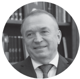
Сергей Катырин ТПП РФ