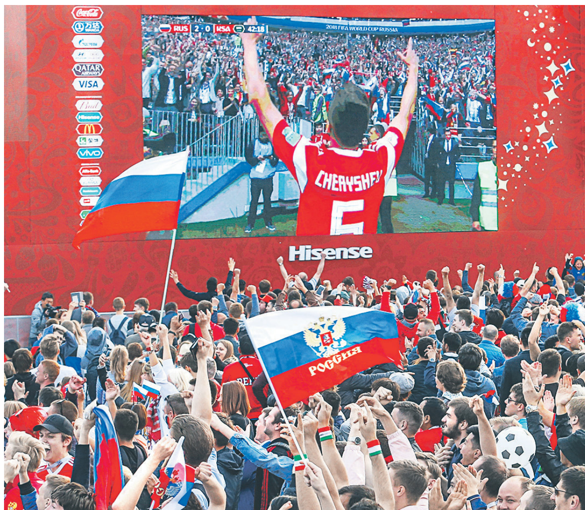
Согласно исследованию, среднее количество зрителей, смотревших матч Россия — Саудовская Аравия не менее одной минуты, составило более 18,4 млн человек

Первый матч домашнего чемпионата мира начался в 17:55 мск, когда в большинстве организаций рабочий день только заканчивался. Поэтому предшествующая матчу краткая церемония открытия чемпионата, которую Mediascope оце-