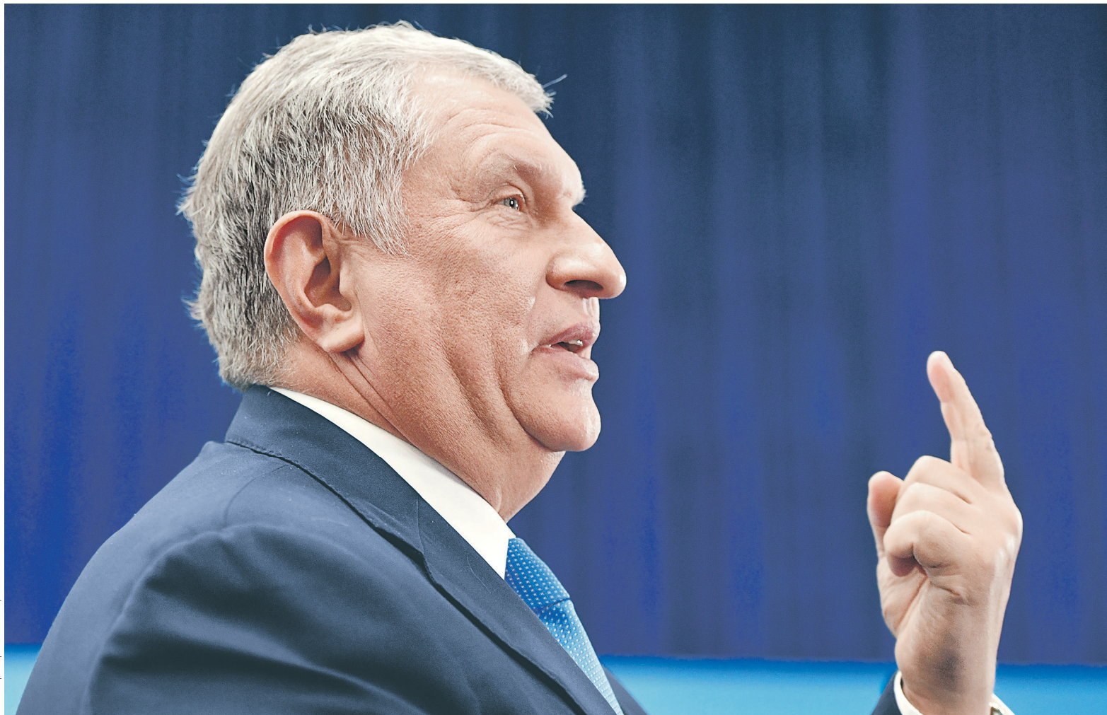
Глава «Роснефти» Игорь Сечин в последние полтора года выступал главным лоббистом льгот для нефтеперерабатывающей отрасли в целом и для заводов его компании в частности