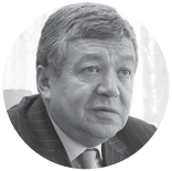
Руслан Гринберг РАН