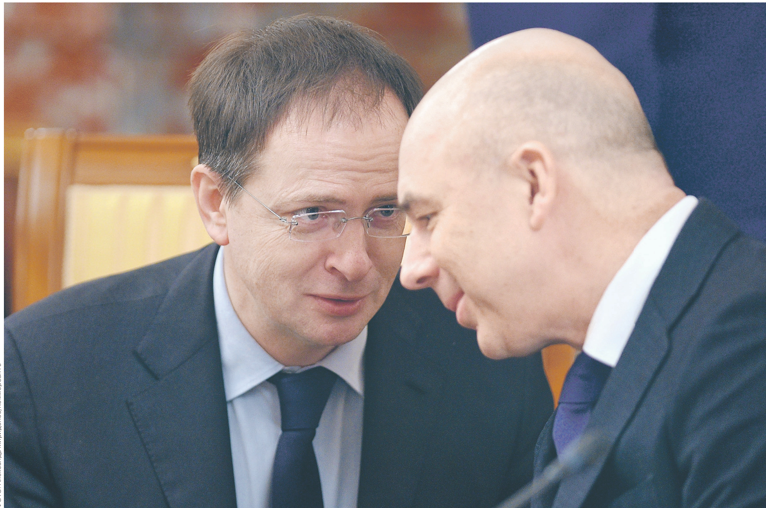
Предложения о внесении туристического сбора в Налоговый кодекс сейчас находится на рассмотрении у Минкультуры и Минфина. На фото: главы ведомств Владимир Мединский (слева) и Антон Силуанов