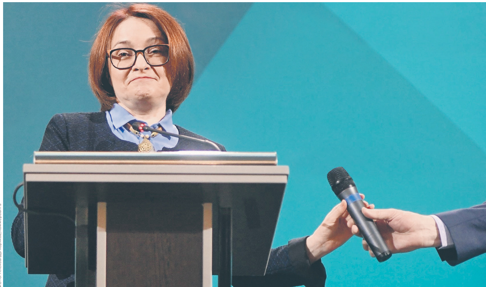
За последние месяцы глава ЦБ Эльвира Набиуллина не в первый раз говорит, что не исключает повышения ключевой ставки. Однако в ближайшее время регулятор ограничится лишь сменой риторики, полагают участники рынка

Слова Набиуллиной — это признание того факта, что повыше-