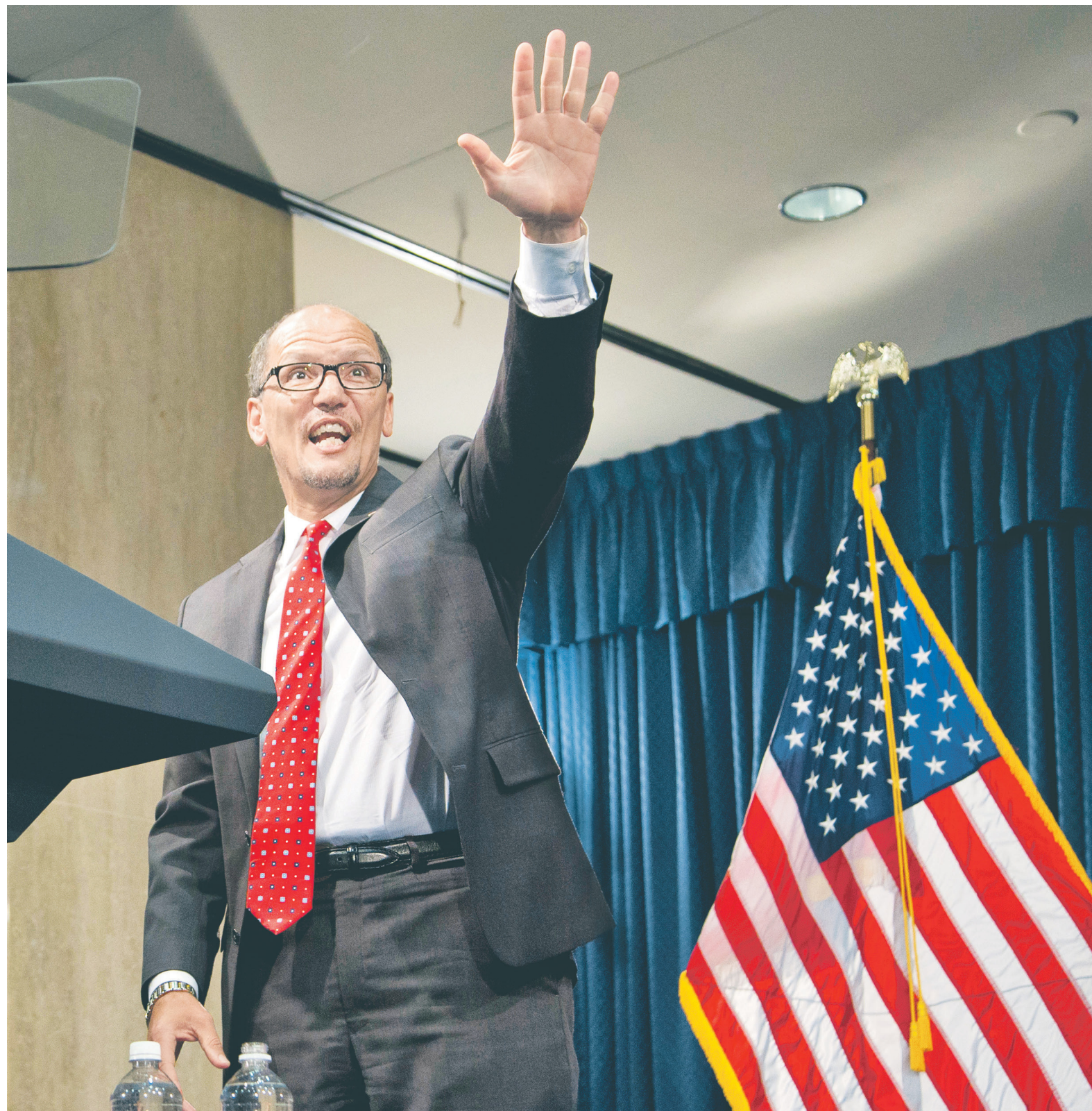
По итогам выборов у демократов высокие шансы взять под контроль нижнюю палату конгресса США — после этого они смогут заблокировать законодательные инициативы Дональда Трампа. На фото: лидер Демократической партии Том Перес

Победу демократов на выборах в нижнюю палату также предсказывает RealClearPolitics. По данным агрегатора, в конце августа их преимущество составляло почти 9% (48 против 39,1%). В пересчете на места это 201 кресло против 191. Непредсказуемым результатом выглядит пока для 43 мест, но из них только два принадлежат демократам. Шансы демократов получить большинство в нижней палате при таком раскладе — 65%, предсказывает PredictWise.