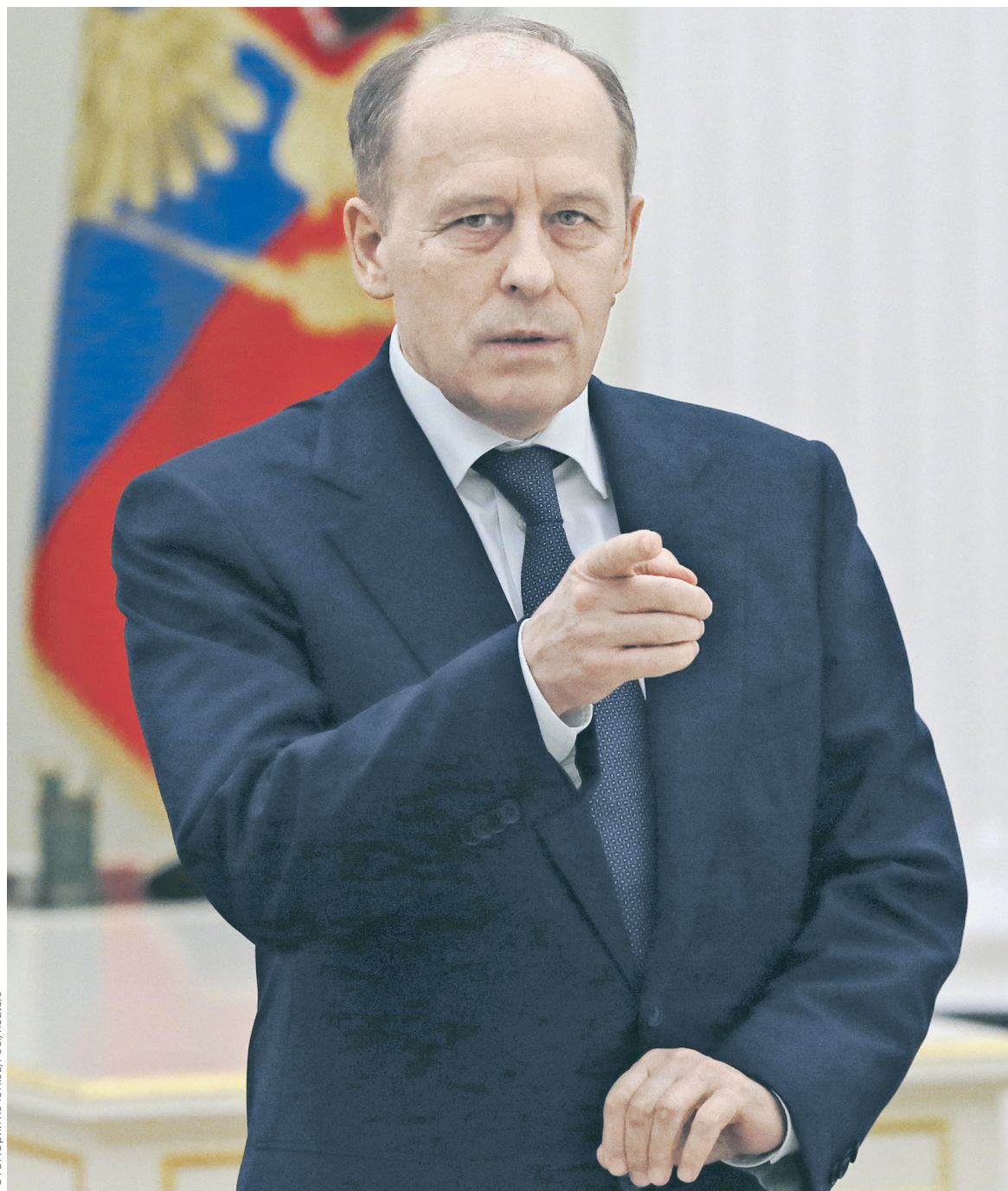
Компания Viber не сможет выполнить требование ФСБ (на фото: директор службы Александр Бортников): все чаты и звонки защищены сквозным шифрованием, и ключей для дешифровки у Viber нет