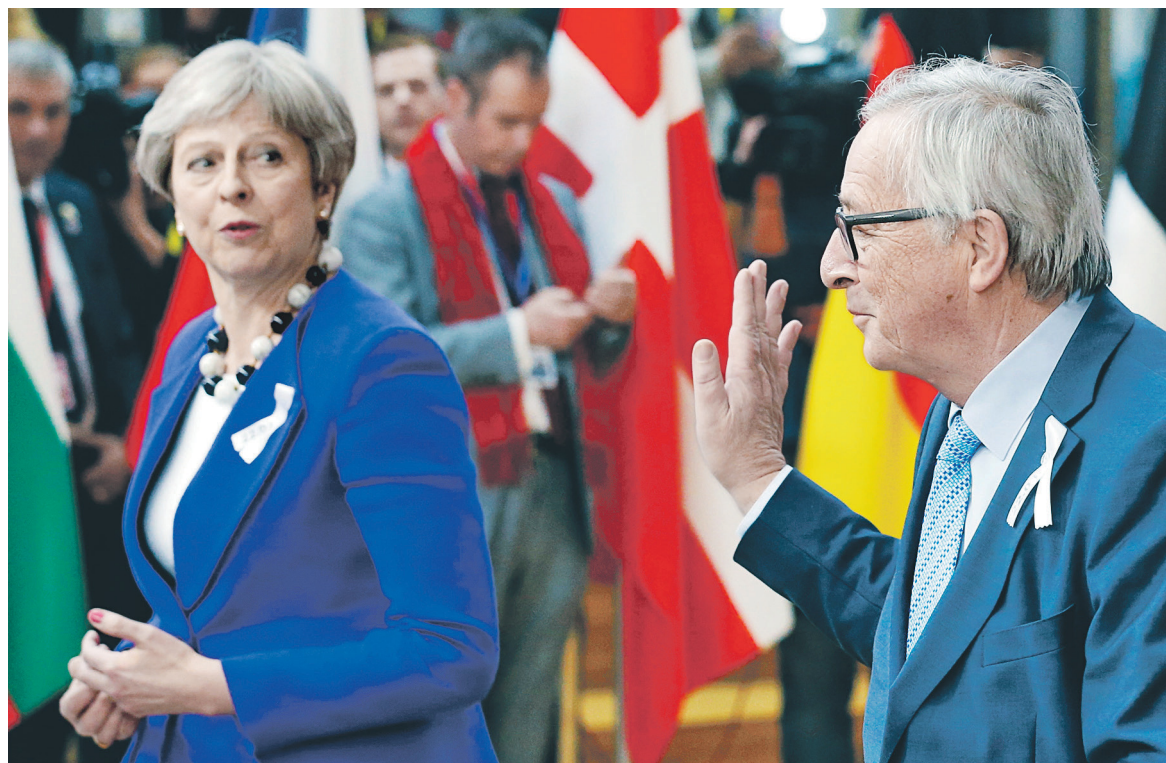
Председатель Еврокомиссии Жан-Клод Юнкер (на фото с премьер-министром Великобритании Терезой Мэй на саммите в Бельгии) отметил, что посла ЕС вызвали, чтобы рассказать ему о результатах дискуссии по «делу Скрипаля» и расспросить о происходящем в Москве

Отравление бывшего полковника ГРУ Сергея Скрипаля и его дочери Юлии произошло 4 марта в английском городе Солсбери. Лондон уверен, что за покушением с «высокой вероятностью» стоит Москва. Власти Великобритании утверждают, что Скрипали были отравлены нервно-паралитическим веществом класса «Новичок», который, как уверяет Лондон, был разработан и произведен в СССР. Кроме того, премьер-министр Великобритании Тереза Мэй считает, что для Москвы Скрипаль, будучи предателем, пусть уже осужденным, помилованным и обменным, был «заказной целью» убийства.