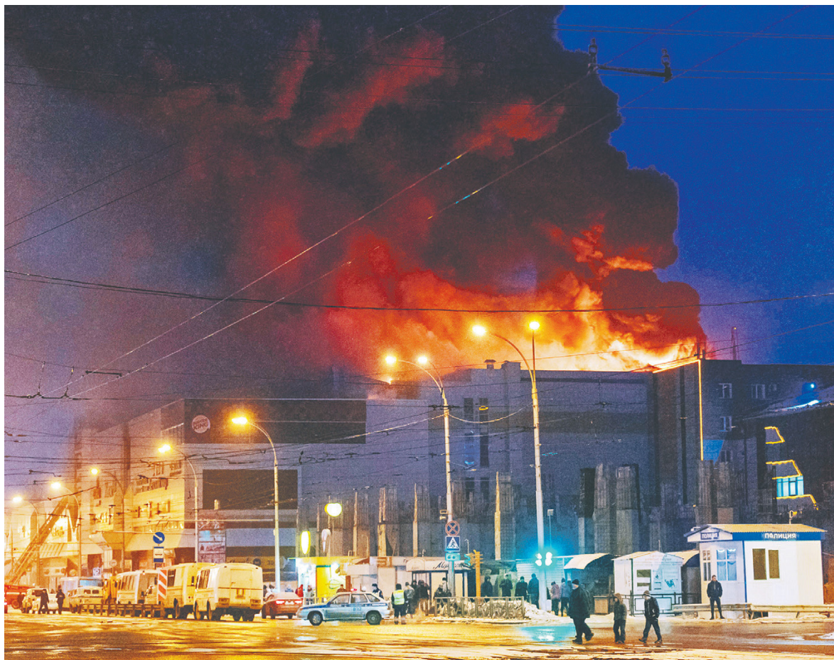
Пожар охватил площадь около 1500 кв. м. В результате через несколько часов произошло обрушение кровли на площади 1200 кв. м внутри центра, между третьим и четвертым этажами рухнули перекрытия

Как рассказал РБК источник в Центральном региональном центре МЧС, по другой предварительной версии, причиной возгорания стало короткое замыкание в механизме детского аттракциона; эту информацию подтвердил источник, знакомый с материалами расследования.