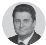
Александр Морозов Минпромторг РФ