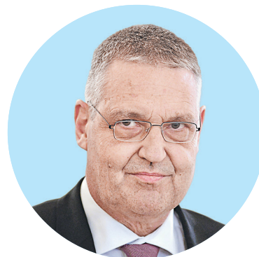
Посол ЕС в России Маркус Эдерер

Источники издания EUobserver, знакомые с ходом беседы лидеров ЕС за ужином, уверяют, что один из них (имя не уточняется) предложил каждой из стран блока вслед за Лон-