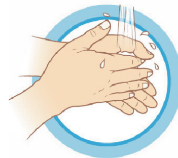
ЧАСТО МОЙТЕ РУКИ С МЫЛОМ