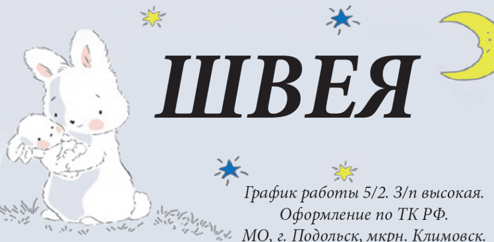
График работы 5/2. З/п высокая.