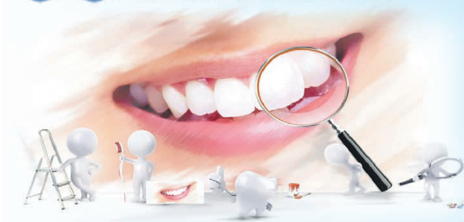
График работы с 9 до 21 ч.