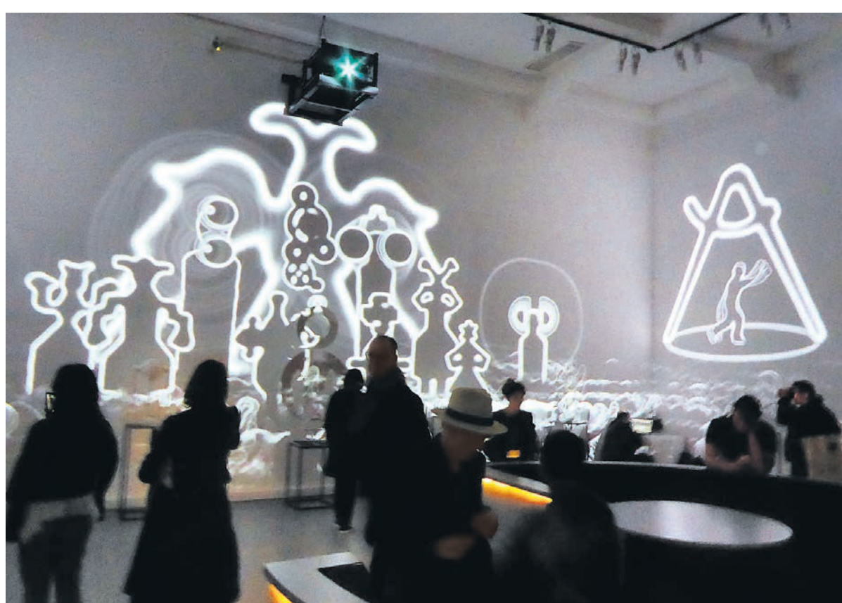
Над видеопроекциями, которыми украшена инсталляция Гриши Брускина, царит абрис геральдического орла

Свет и рисуемые им тени — важные элементы в работе Брускина.