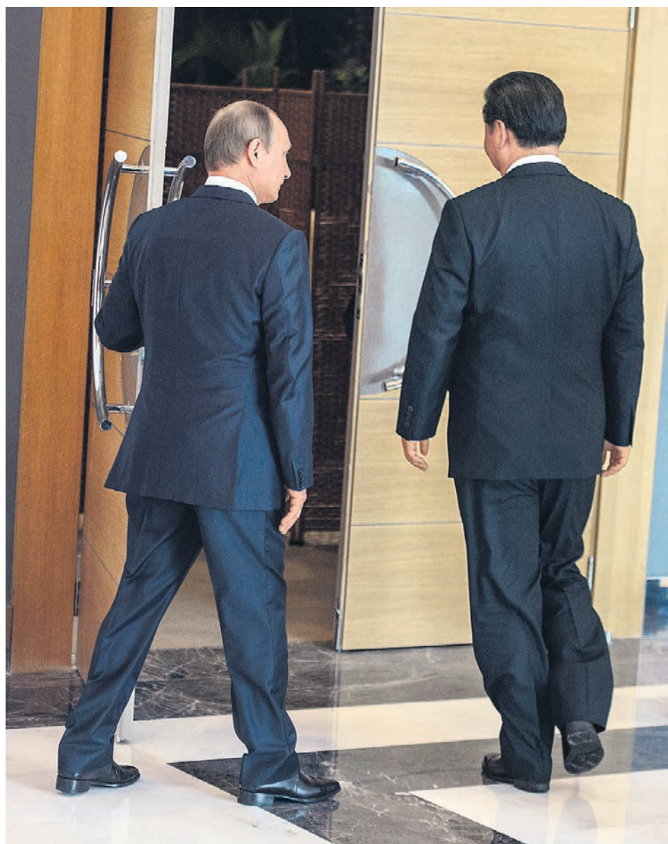
Владимир Путин и Си Цзиньпин готовы пройти по одному Шелковому пути, но с разной скоростью.

С того момента как председатель КНР Си Цзиньпин сообщил миру о новой китайской инициативе «Новый Шелковый путь» осенью 2013 года, ее название изменилось сначала на «Экономический пояс Шелкового пути» (ЭПШП), а к концу 2016 года — на «Один пояс — один путь» (ОПОП). В декабре 2014 года для финансирования инициативы был запущен Фонд Шелкового пути (ФШП) объемом $40 млрд, к этой же цели был приспособлен начавший работу в декабре 2015