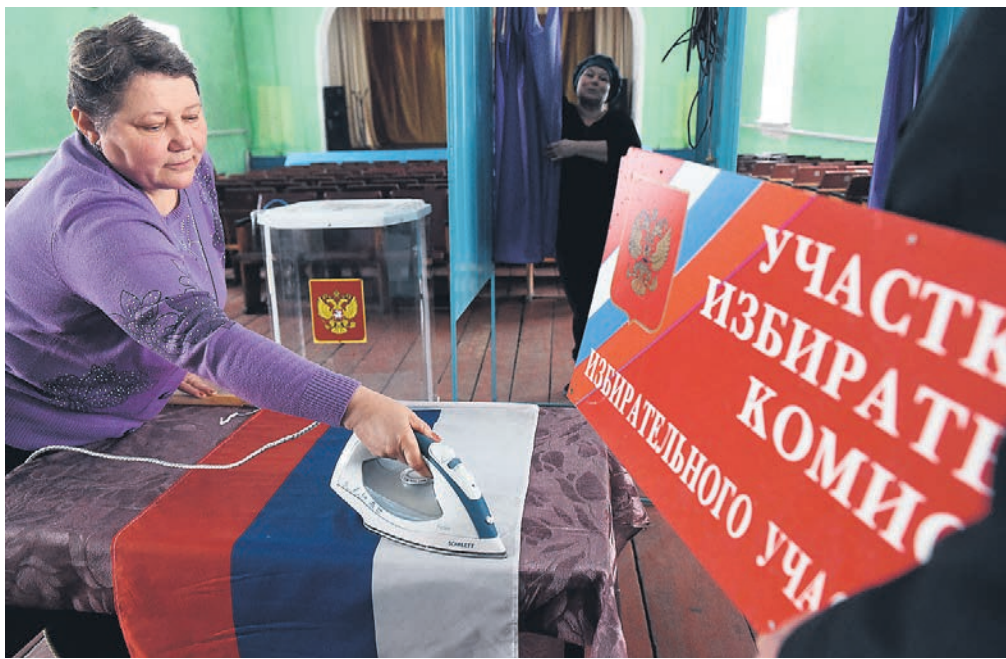
Председатель ЦИКа Элла Памфилова говорит, что предложения мэра Москвы вписываются в концепцию развития «мобильного избирателя» и могут коснуться не только столицы и области.

Глава МГИКа Валентин Горбунов сказал, «Ъ», что участки за пределами города будут расположены «в местах массового скопления москвичей», но их еще нужно найти. «Мы проведем исследования, спросим, где находятся массовые садоводческие товарищества, спросим пожелания москвичей», — пояснил он. Глава комиссии