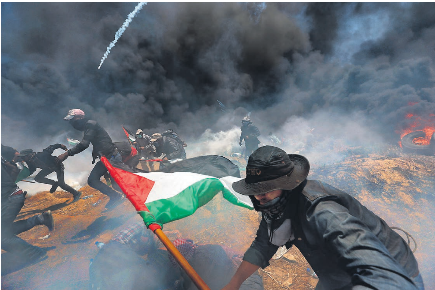
Лидеры палестинского движения «Хамас» вчера призвали всех мусульман встать под их знамена, присоединившись к протестам в связи с открытием посольства США в Иерусалиме

При этом он подчеркнул, что США по-прежнему намерены содействовать мирному урегулированию на Ближнем Востоке. «Мы протягиваем руку дружбы Израилю, палестинцам и всем соседям. Пусть будет мир. Пусть Бог благословит это посольство. Да благословит Бог всех, кто служит там. И пусть Бог благословит Соединенные Штаты Америки», — заключил свою речь президент США.