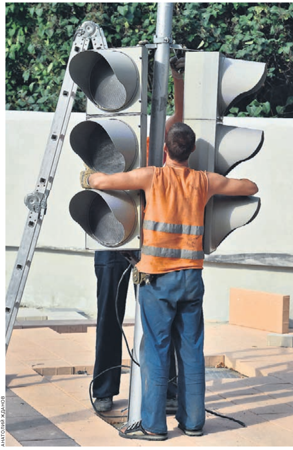
Мэрии предстоит найти частную компанию, готовую взяться за ИТС Москвы

Передача на аутсорсинг обслуживания подобных систем — общемировая практика, говорит проректор