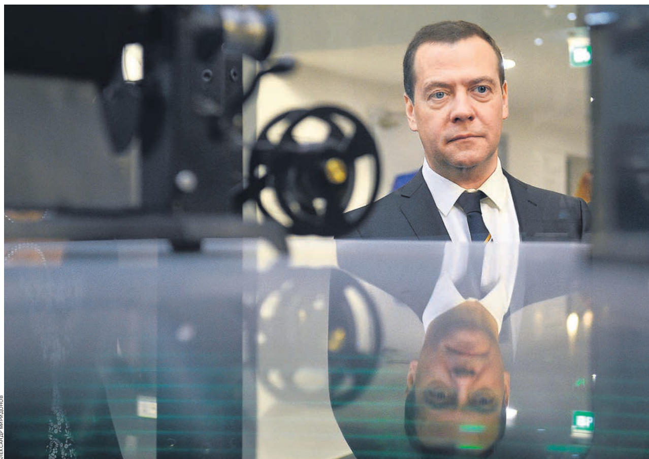
Новые нацпроекты во многом выглядят увеличенным зеркальным отражением нацпроектов времен президентства Дмитрия Медведева

Нацпроекты 2018–2024 годов, над которыми будет работать новое правительство Дмитрия Медведева, очень похожи на нацпроекты времен его президентства в 2008–2012 годах. В «двадцатипятилетнем плане» Белого дома, с которым ознакомился «Ъ», — 13 проектов, развивающих уже существующие. Наиболее крупные его расходы — онкологическая программа, обеспечение госсектора и школ цифровыми каналами связи, ремонт дорог в нестолических мегаполисах и инвестиции в российское программное обеспечение для «цифрового государства». В год они будут стоить дополнительно 150–200 млрд руб. каждый. Самый логичный способ покрыть эти расходы — экономия бюджета при повышении пенсионного возраста.