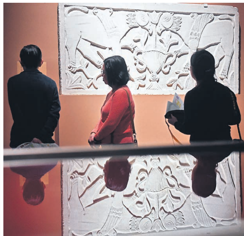
Искусство лангобардов — важный памятник времени, когда античность уже кончилась, а средневековье еще не началось

Лангобарды появились на севере Италии в 568 году. К этому времени Римская империя распа-