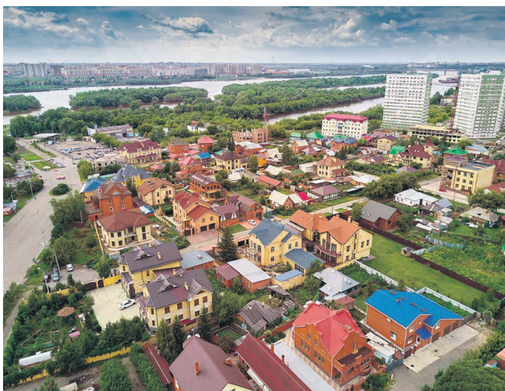
Съемки участков с воздуха и из космоса и базы данных о стоимости земли могут увеличить налоговые поступления в разы, подсчитали во Всемирном банке

Вклад налогообложения в ВВП в развивающихся странах составляет лишь 25–50% от показателя развитых — так как значительная часть экономической активности остается в серой зоне. Институциональные возможности по сбору налогов ограничены, а политические и культурные факторы способствуют уклонению от их уплаты, отмечают в ВБ. Местные же налоги на землю и имущество эти проблемы затрагивают в меньшей степени — недвижимость труднее скрыть, налоговое бремя легче переложить на состоятельные слои населения, а доход от них более стабилен. Однако развивающиеся государства не слишком активно используют этот инструмент: с 1990 по 2014 год его вклад в общую налоговую выручку для развивающихся стран с низким доходом сократился с 0,09 до 0,05% (0,2% ВВП), тогда как в развитых странах показатели были стабильны, а в странах с переходной экономикой — росли. Помимо политических соображений (такие налоги более заметны для населения), расширению их использования препятствует дороговизна создания и поддержания кадастра недвижимости. Кадастровые карты часто неполны или неактуальны, а до-