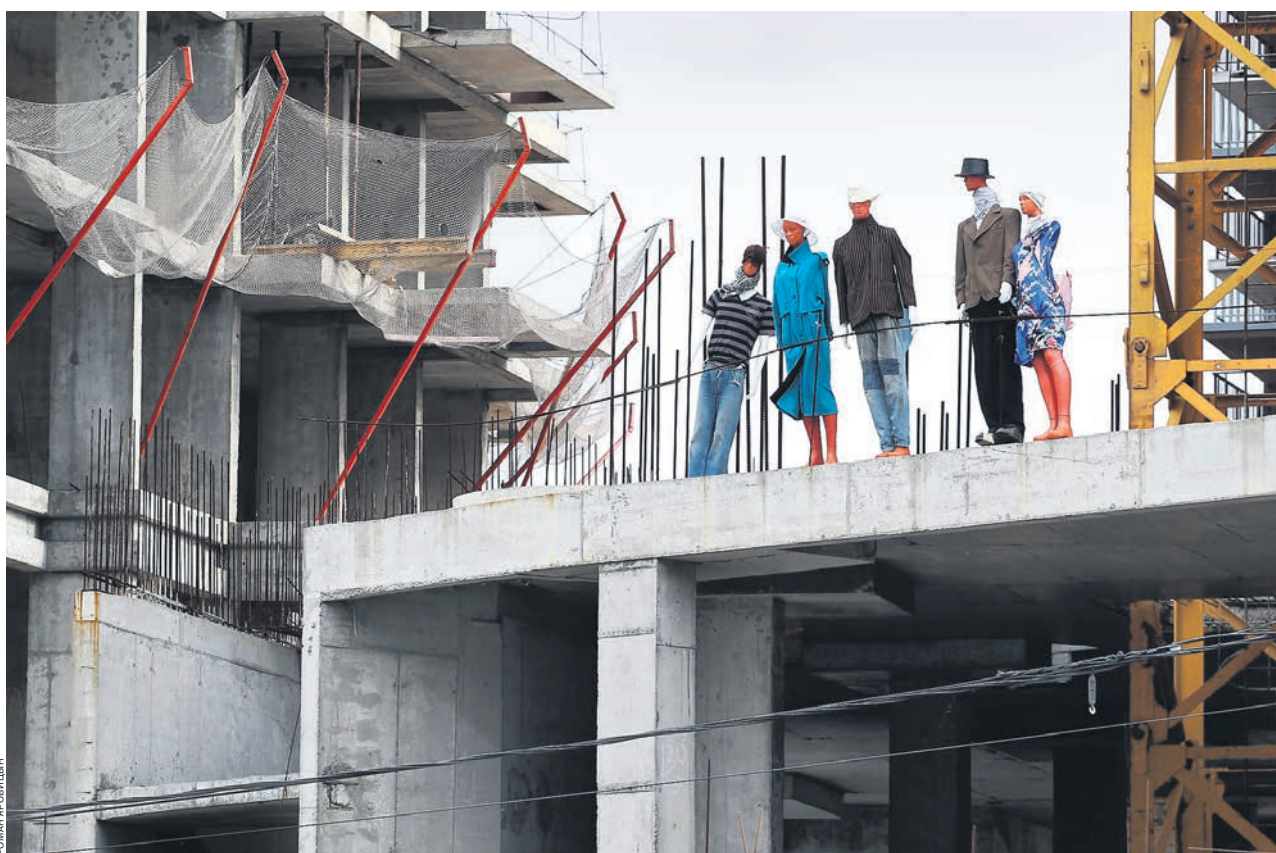
В России все чаще застройщики жилья стали банкротиться, что приводит к росту числа обманутых дольщиков

Эксплуатация примерно 60% объектов, которые в 2018 году находились на