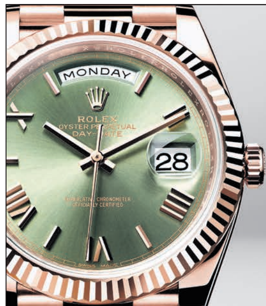
OYSTER PERPETUAL DAY-DATE 40