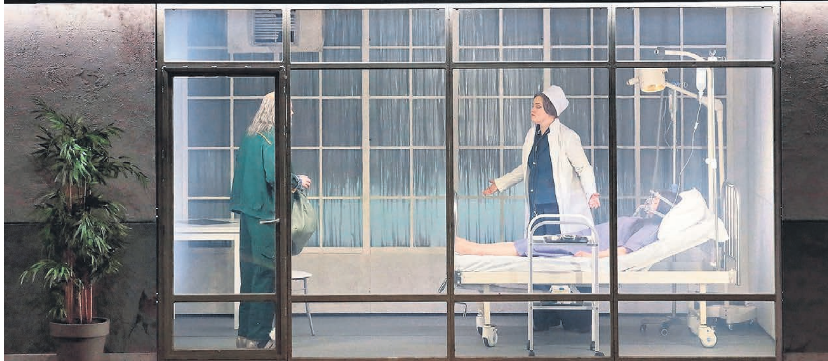
В финале оперы волшебная сказка и прагматичная современность оказываются одновременно

ствах, эстетиках и типах театра. Первый акт локализован как будто в традиционной, волшебной-романтической театральной местности («заколдованный лес»), но с важным сломом правил (так жаль, что главный поэтический трюк спектакля, когда одна реальность превращается в другую при помощи традиционной технологии «бога из машины», обнародован в оперативных репортажах), второй полностью погружен в пространство кон-