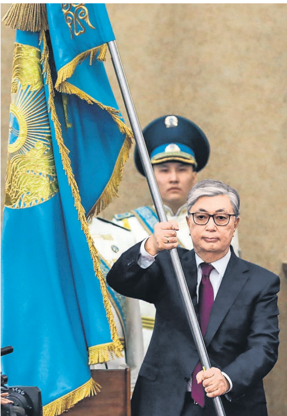
Касым-Жомарт Токаев (на фото), выдвинутого на президентский пост «отцом нации» и первым президентом Казахстана Нурсултаном Назарбаевым, наблюдатели считают главным фаворитом предстоящих выборов

Между тем процесс передачи власти в Казахстане до вчерашнего дня выглядел успешно завершённым в рекордно короткие сроки: Сенат утвердил кандидатуру выдвинутого Нурсултана Назарбаева единогласно, без дискуссии. После этого в течение трех недель Касым-Жомарт Токаев успел сделать немало заявлений о преемственности казахстанской политики, в том числе в интервью «Ъ» (см. номер от 2 апреля), и посетил с первым зарубежным визитом Москву, обсудив с российским руковод-