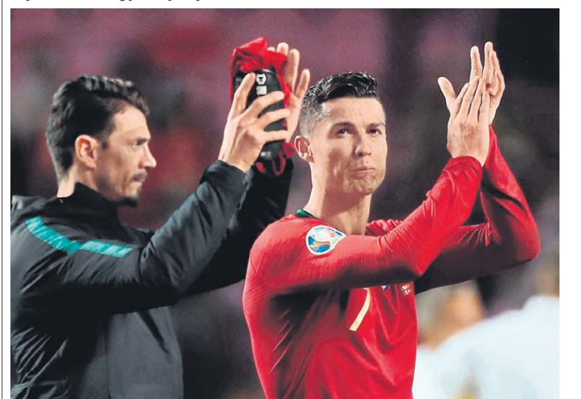
Лидер «Ювентуса» Кристиану Роналду, из-за травмы две недели не выходявший на поле, включен в заявку туринского клуба на матч против амстердамского «Аякса»