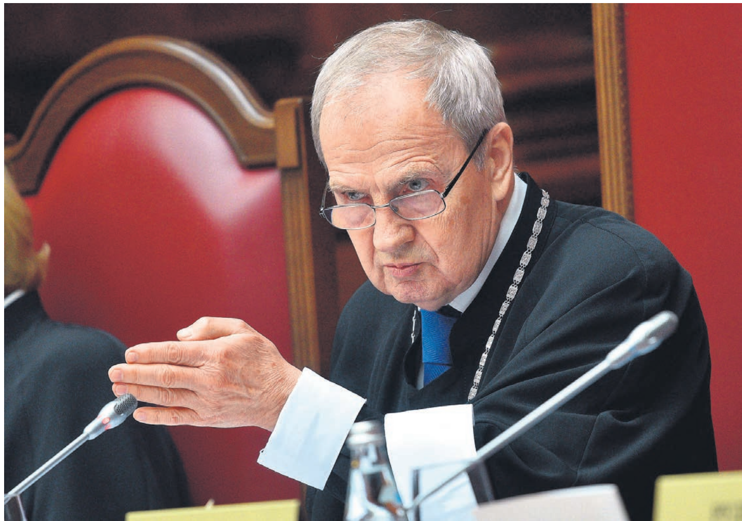
Председатель КС Валерий Зорькин уверен, что присоединение к России четырех новых регионов было вызвано суровой необходимостью.

В частности, отмечается в постановлениях КС, «в условиях острого социально-экономического и политического кризиса, а также установления фактически внешнего управления со стороны коллективного Запада власти Украины проводили и продолжают проводить целенаправленную политику, препятствующую тем гражданам, которые идентифицируют себя как принадлежащих к русскому народу, сохранять свою национальную, языковую, религиозную и культурную идентичности». А военная политика Украины проявилась еще и в подготовке к очередному наступлению на ДНР и ЛНР с использованием получен-