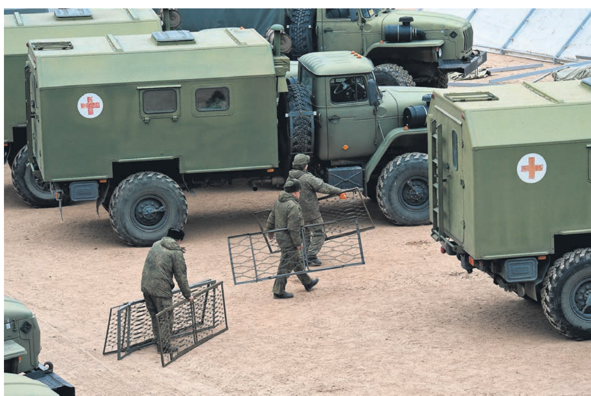
Большинство российских гражданских и военных медиков склонны поддерживать частичную мобилизацию медперсонала с рядом оговорок

На главный вопрос — о поддержке частичной мобилизации медработников — однозначно положи-