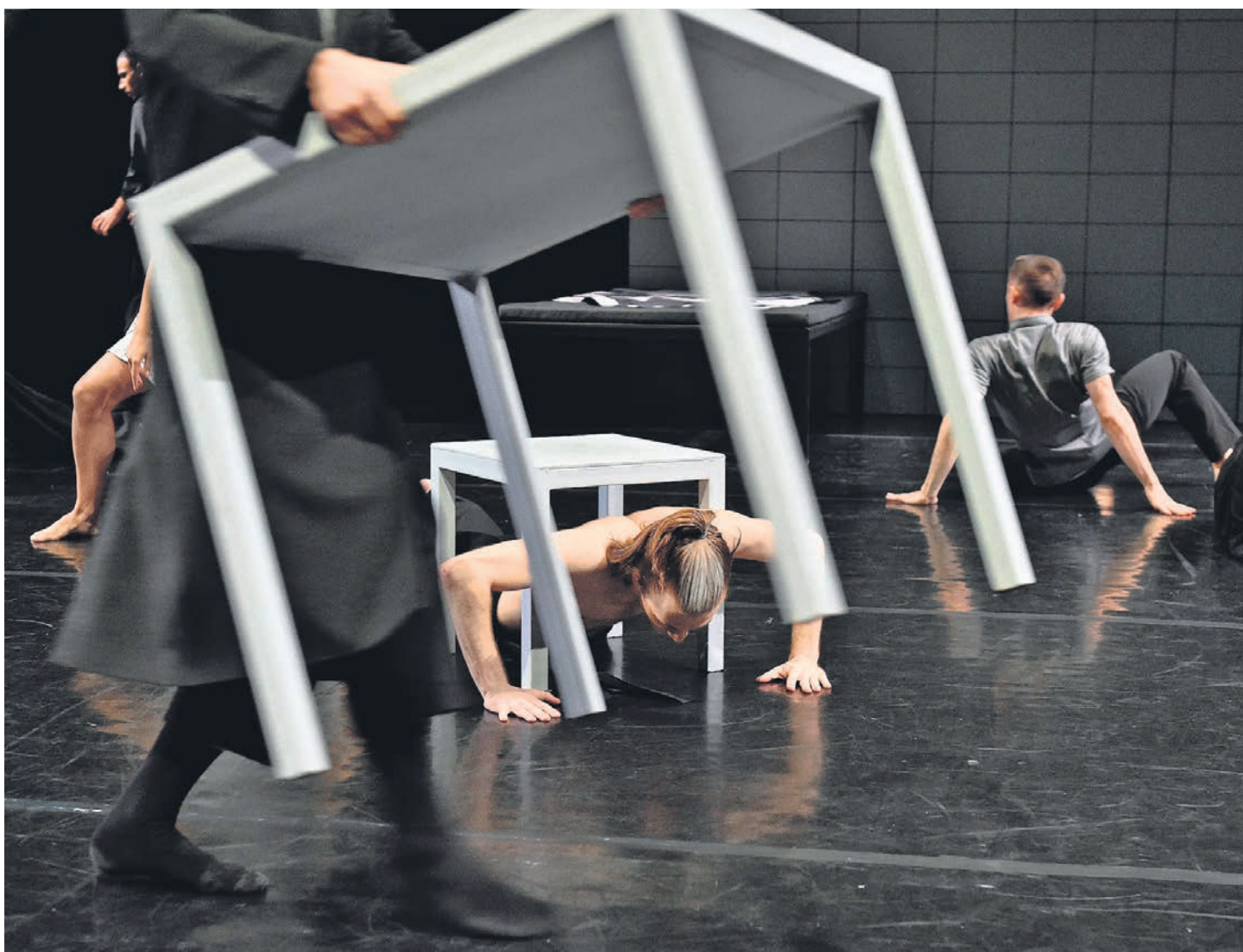
В «Истории одной комнаты» скудная мебельровка сыграла мобилизующую роль

«История одной комнаты» стала его тринадцатой попыткой утвердиться в рядах хореографов-ньюсмейкеров, пусть и отечественных. В союзники он (в программке в качестве соавтора значится и непременно