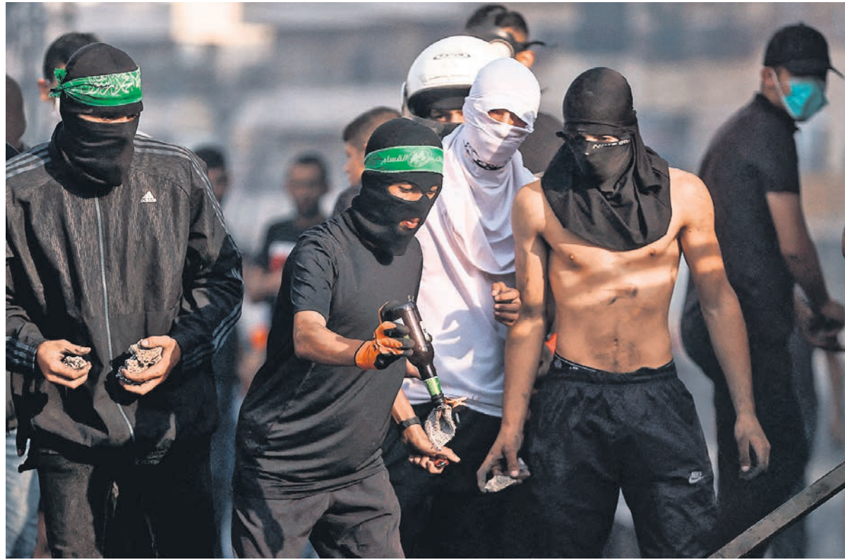
Молодое поколение палестинцев, похоже, уже готово к началу новой интифады

С момента заявления представителя ООН число жертв палестино-израильского конфликта только возросло. Однако никакие политические перспективы для его урегулирования не просматриваются, причем уже на протяжении многих лет. Израиль находится в перманентном правительственном кризисе, и властям не до решения вопроса, требующего национального консенсуса. 1 ноября должны состояться уже пятые за 3,5 года выборы в Кнессет. Палестинская администрация на Западном берегу реки Иордан ослаблена и практически уже не пользуется доверием населения, которое, в свою очередь, не видит для себя будущего, оказавшись заложником между израильской оккупацией и коррумпированными местными властями. Сектор Газа уже больше 15 лет находится под контролем группировок «Хамас» и «Исламский джихад», которые стремятся распространить свое влияние на палестинцев Западного берега и арабов, живущих на контролируемой Израилем территории.