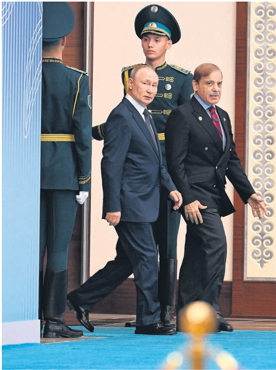
Президент России Владимир Путин и премьер-министр Пакистана Шехбаз Шариф нашли повод прийти вместе

Если он как председательствующий собрался учитывать статус государства, то причем тут алфавит?