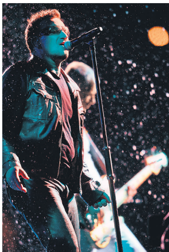
Новых прорывных опусов от Бono и его музыкантов, несмотря на торжественность промокампании, ждать не следует

Преданных фанатов новая версия «Beautiful Day» скорее насторожила, чем заинтриговала. Насколько нужен этот вкрадчивый запев и мягкие стартовые аккорды песне, которая в оригинальной версии ставила стадионы на уши, была наотмашь и оставалась в памяти как один из кульминационных моментов любого концерта U2?