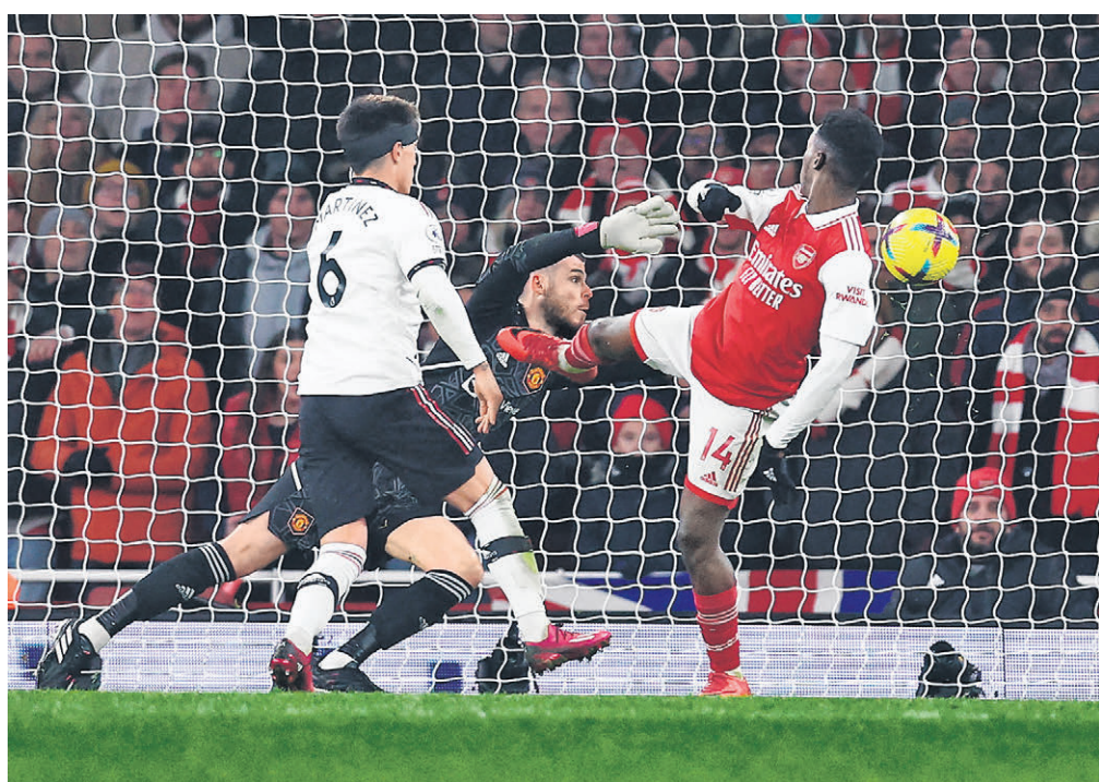
Форвард «Арсенала» Эдди Нкетиа (№14), забивший в ворота «Манчестер Юнайтед» два мяча, внес решающий вклад в победу своей команды

Но счет при этом открыл «Манчестер Юнайтед», и именно вследствие отбора в районе центральной линии. После него мяч достался Маркусу Рашфорду, и теперь поражаться надо было индивидуальному мастерству и наглости форварда. С Томасом Парти Рашфорд расправился играючи, потом продвинулся вперед и, не дойдя до штрафной, пальнул низом так плотно, что «Арсенал» не спас и неплохой прыжок