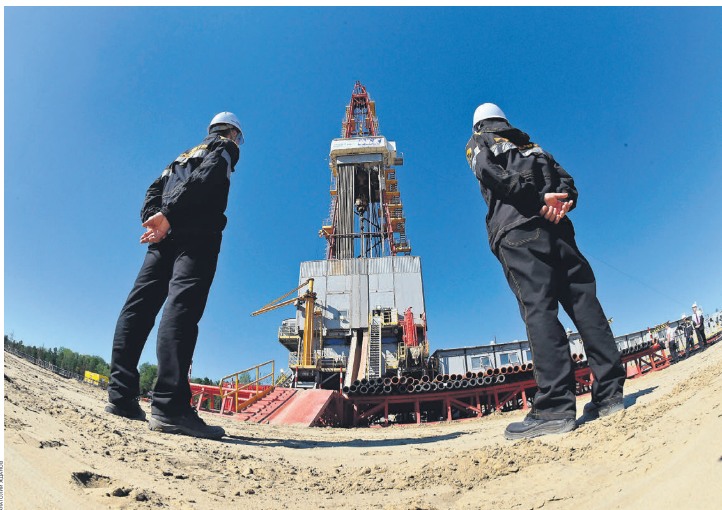
Нефтяникам придется самим следить и отчитываться о том, что они не подчиняются западным ограничениям

ФТС в случае нарушений будет запрещать транспортировку сырья, уведомив ОАО РЖД и «Транснефть». Запрет на экспорт в рамках таких контрактов будет действо-