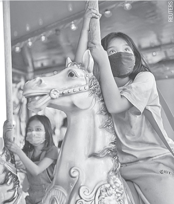
В мире постепенно отменяют ковидные ограничения. Но ношение масок остается обязательным. Например, на Филиппинах это требование касается и детей.

Пока антидепрессанты не входят в клинические рекомендации по лечению и профилактике сердечно-сосудистых осложнений COVID-19,