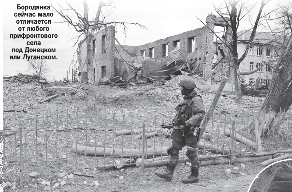
Александр КОЦ «КП» - Москва

Бородянка сейчас мало отличается от любого прифронтового села под Донецком или Луганском.