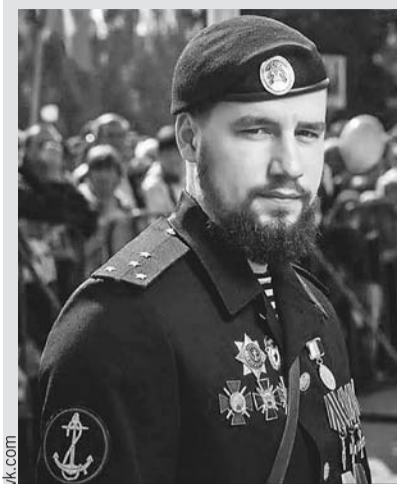
Воха было всего 28 лет. Из них 8 он провел на войне.