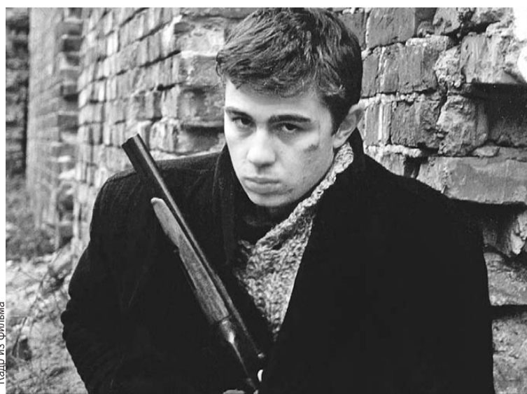
Сергей Бодров завещал нам: «Во время войны нельзя говорить плохо о своих!»

и Донбассу. В Донбасс заехало за все эти годы считаное количество артистов и музыкантов. Единицы!