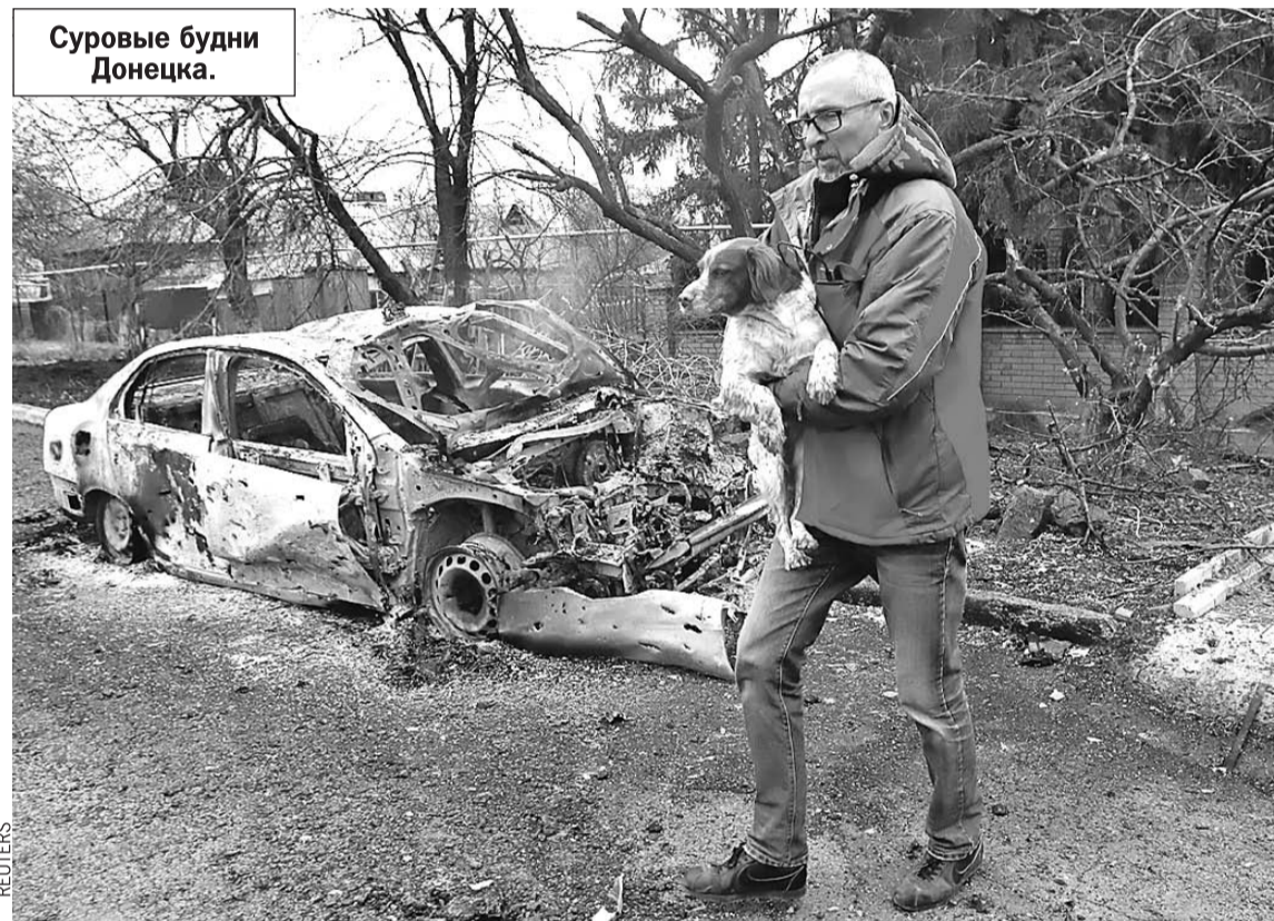
Суровые будни Донецка.

- Но вам даже не показали короткий список тех, кто из культуры понимает и принимает происходящее. Знаете,