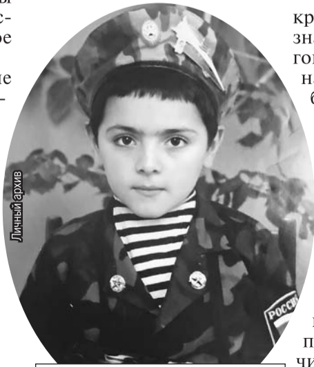
Будущий Герой России мечтал стать десантником с самого детства.