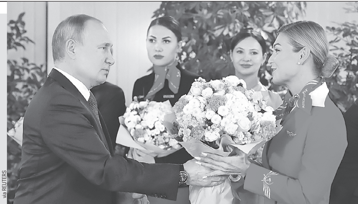
Накануне 8 Марта Владимир Путин в учебном центре «Аэрофлота» поздравил с праздником летный персонал и стажеров из разных российских авиакомпаний. И вручил букеты. Он осмотрел кабину, позволяющую отрабатывать навыки управления российским лайнером МС-21, и в сопровождении командира воздушного судна Марии Касьяник совершил имитационный полет на авиасимуляторе «Сухой Суперджет-100». А также посетил центр «Вода - суша» по подготовке экипажей к нештатным ситуациям.

(Министр труда и соцзащиты Антон КОТЯКОВ - о размере пособия на ребенка от 8 до 16 лет.)