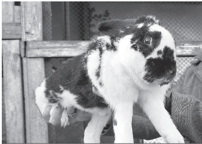
Хозяин кроликов обратился в полицию с заявлением о краже.

оставших животных нужно обязательно спасти от неминуемой смерти.