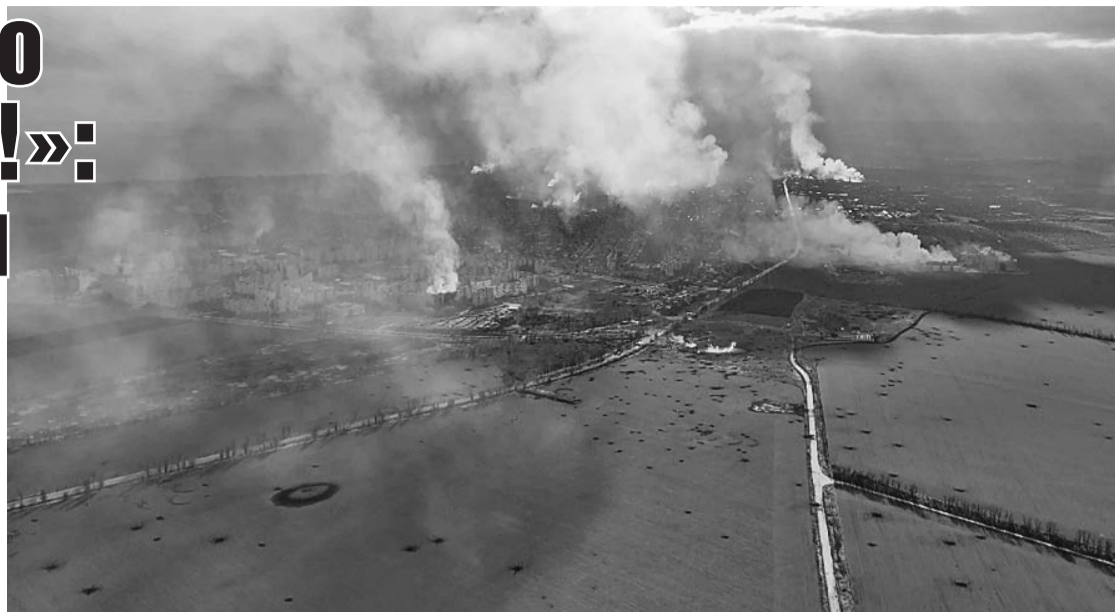
Так выглядят окрестности Мариуполя с высоты.

Он показал мне надпись на экранчике: «Ува! Бійці ЗСУ! (ВСУ, Вооруженные силы Украины. - Авт.) Терміново (срочно. - Авт.) виходьми з Маріуполя!»