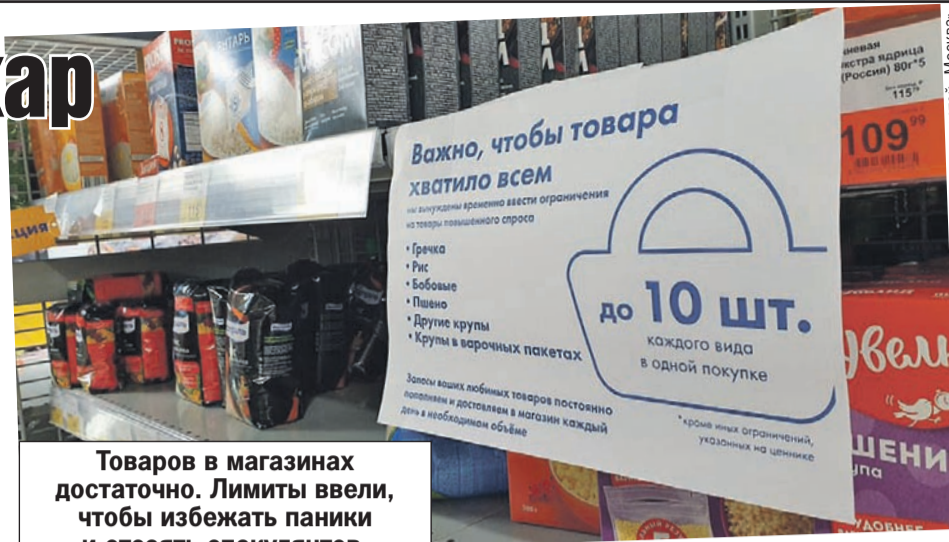
Товаров в магазинах достаточно. Лимиты ввели, чтобы избежать паники и отсеять спекулянтов.

больше, чем в обычный выходной. Продуктов хватает, однако на бакалейных полках - пробы. Та же картина с растительным маслом и туалетной бумагой. А вот гречки нет вовсе. И водку размели почти подчистую - времена сейчас сложные, а белянскую власти не внесли в список социально значимых товаров (не иначе по недосмотру).