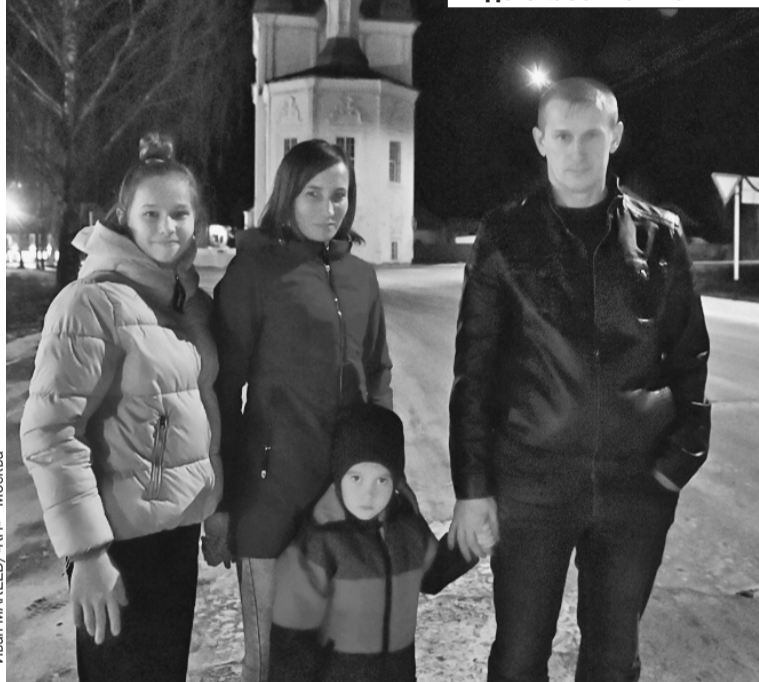
Иван МАКЕЕВ/«КП» - Москва

Василий с женой и двумя детьми не испугался среди ночи подобрать на трассе экспедицию «КП». Он и довез нас до сказочной Тотьмы.