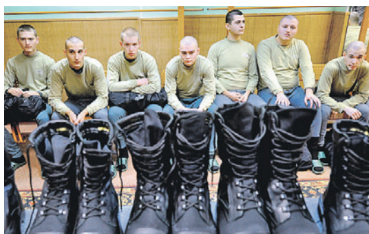
Владимир ВЕЛЕНУРИН/«КП» - Москва