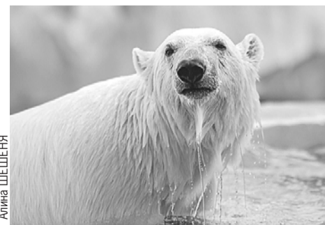
Медведицу Хатангу нашли на Северной Земле истощенным медвежонком. Теперь она живет в новом вольере в Екатеринбургском зоопарке.

будут проходить масштабные фестивали, выставочные проекты и театральные премьеры. А вот программу самого Дня города пока держат в секрете. Но без концертов, спектаклей и мультимедийных инсталляций точно не обойдется.