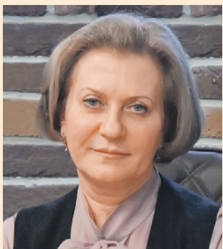
Главный государственный санитарный врач России, руководитель Роспотребнадзора Анна ПОПОВА ответила в прямом эфире Радио «Комсомольская правда» на вопросы журналистов «КП» и слушателей.