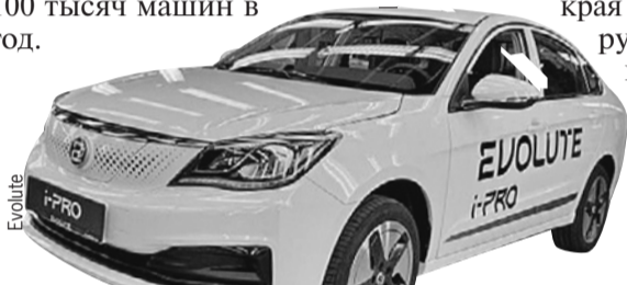
Седан Evolute i-PRO. Владельцы электрокаров в РФ получают право не платить за платные городские паркинги.

В Липецкой области начали сборку российских электрокаров Evolute. Первая модель - седан - называется i-PRO. В ней 163-сильный мотор и аккумулятор с запасом хода на 420 км. Запланирована сборка кроссоверов i-JOY и минивэнов i-VAN. Расчетная мощность завода свыше 100 тысяч машин в год.