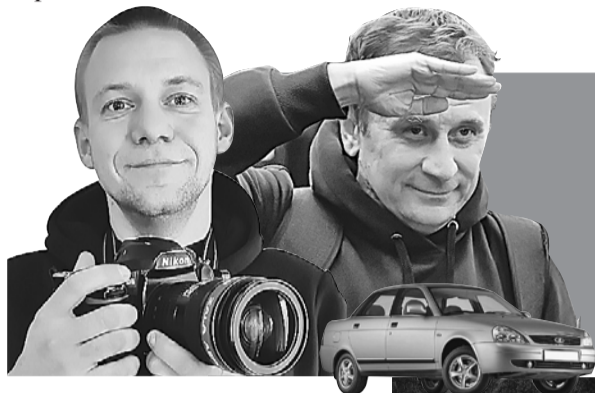
Владимир ВОРСОБИН (текст)

Продолжение. Начало в предыдущих номерах «КП» и на сайте KP.RU.