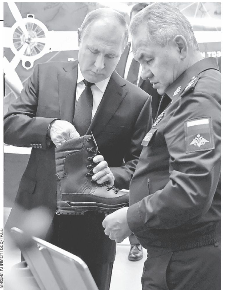
Уже после коллегии Владимир Путин и Сергей Шойгу осмотрели последние разработки для наших бойцов на специальной выставке.

- Проведенная частичная мобилизация выявила опре-