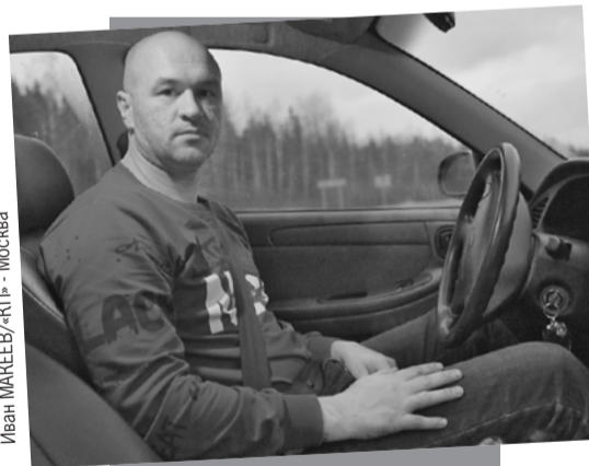
Иван МАКЕЕВ/«КП» - Москва

Завязался разговор на грани УК. Илья проповедовал, что иначе с мальчиками нельзя, что кто его самого только не наказывал - отец, бабушка, и ничего, нормальным человеком стал. Я, как положено гуманитария, смущенно вздыхал, закатывал глаза и сомневался.