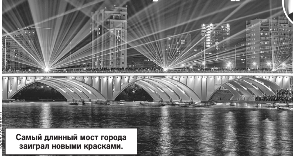
Самый длинный мост города заиграл новыми красками.

В Екатеринбурге готовятся к главному юбилею 2023 года.