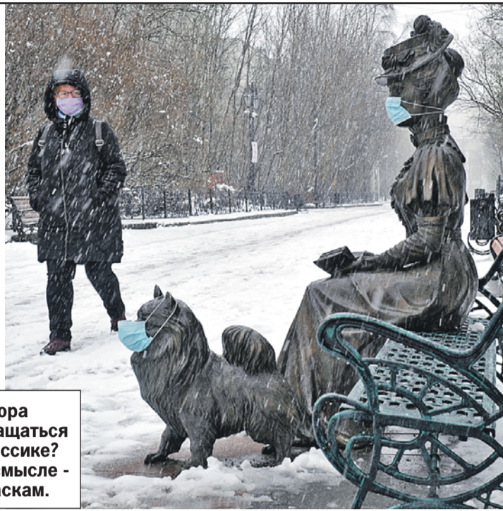
Пора возвращаться к классике? Ну, в смысле - к маскам.

- Мы посмотрим, как он будет себя проявлять дальше. Все равно потенциал у него пандемический. А вот меры реагирования, конечно, мы изменили, учитывая то, как изменился сам вирус.