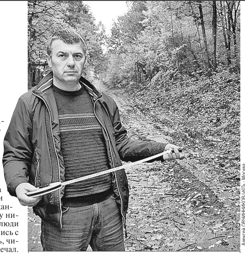
Алексей ОВЧИННИКОВ/«КР» - Москва

Дальше вообще интересно: спустя полгода после возбуждения дела следователи выяснили (даже съездив для этого в Москву) - несколько лет назад произошла какая-то техническая ошибка, ее исправили, и с ноября 2021-го это уже не дорога, а лесной квартал.