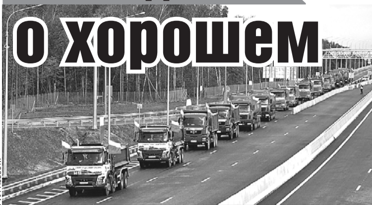
Названия у новой скоростной автомагистрали М-12 пока нет. Озвучивались различные варианты, например «Евразия», «Восток», «Казань».