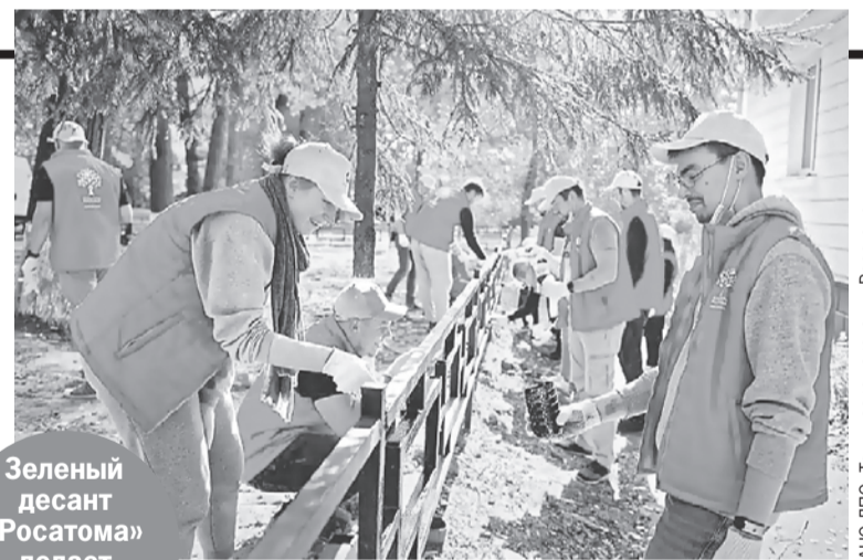
Зеленый десант «Росатома» делает природу чище.

«Росатом» реализует проекты в городах присутствия. В этом году к ним присоединился Энергодар, в котором располагается самая крупная в Европе атомная электростанция - Запорожская АЭС. Жители Энергодара переживают непростые времена, и семья «Росатом» решила их поддержать проведением марафона «Росатом вместе с Энергодаром». Так сотрудники Госкорпорации оказывают поддержку жителям