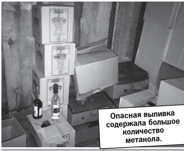
Опасная выпивка содержала большое количество метанола.

В итоге дальнийбойщик получил 3,5 года колонии, а организовавшие бизнес жители Рязанской области - по 6,5 года в колонии общего режима. Также осужденные должны выплатить потерпевшим компенсацию на общую сумму 3 млн рублей.