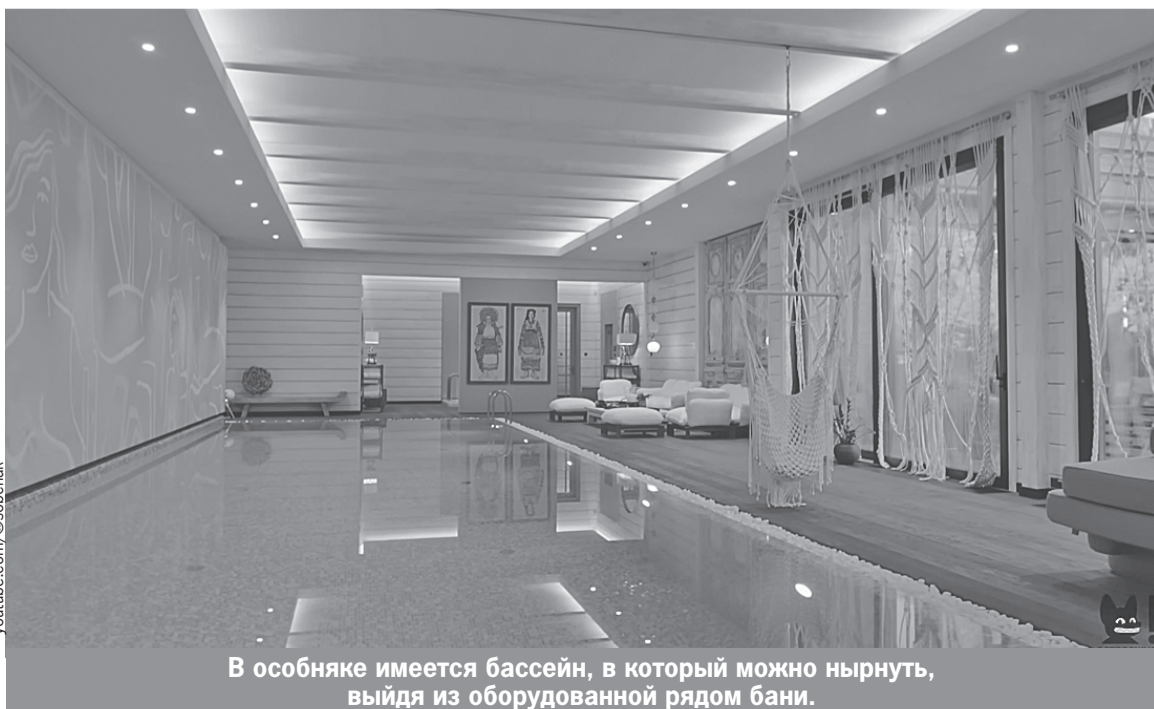
В особняке имеется бассейн, в который можно нырнуть, выйдя из оборудованной рядом бани.

А еще есть просторная баня с выходом к бассейну: «Бассейн всегда был моей мечтой, потому что я человек брезгливый, в общественных бассейнах плавать не могу».