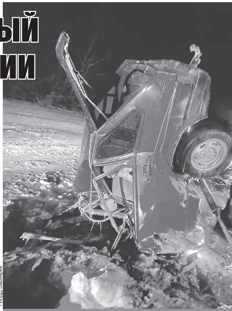
Все, что осталось от «девятки», влетевшей под грузовик.

Очевидцы говорят, что ехал по трассе он неуверенно. Учитывая сложность са-