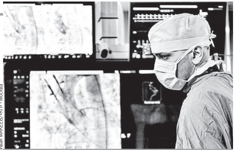
Иван МАКЕЕВ/«КП» - Москва

- Были разработаны специальные микросферы, которые облучаются в реакторе и несут на себе заряд, - рассказывает Константин Викторович. - Первая операция с отечественными микросфе-