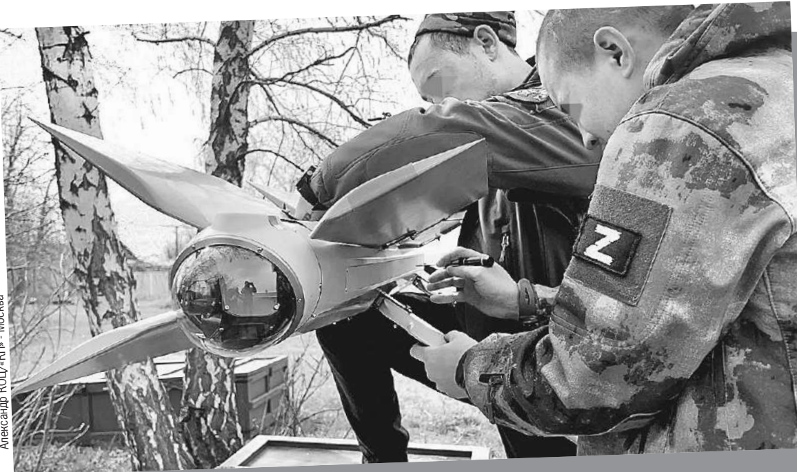
Настоящий хит СВО - наш барражирующий боеприпас «Ланцет». Украинские радары принимают его за птицу за счет крыльев, расположенных буквой Х.

Еще пример - робот «Маркер», который разработали для охраны. Искусственный интеллект позволяет ему вести патрулирование по сложным маршрутам. Робот отслеживает любое движение