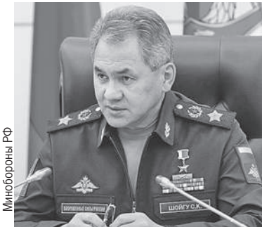
Министерство обороны РФ

Сергей Шойгу подвел итоги 2023-го и поставил цели на 2024-й. Главное из того, что сказал министр обороны: