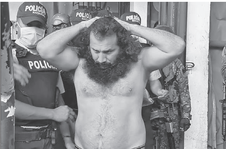
Вид зверский: Фито, лидер картеля «Лос Чонерос».