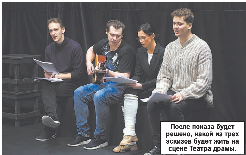
После показа будет решено, какой из трех эскизов будет жить на сцене Театра драмы.

Сборник современных пьес выпустил Алтайский театр драмы