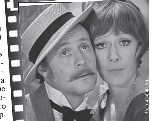
Юрий Соломин в «Дерсу Узала» (1975, с Максимом Мунзуком) и в «Обыкновенном чуде» (1978, с Екатериной Васильевой).

С 80-х годов многое ставил и сам, а в 1988-м стал худруком Малого театра.