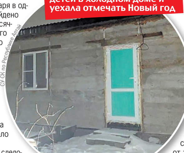
Когда следователи нагрянули в дом, внутри было всего 7 градусов.

На Алтае мать бросила детей в холодном доме и уехала отмечать Новый год