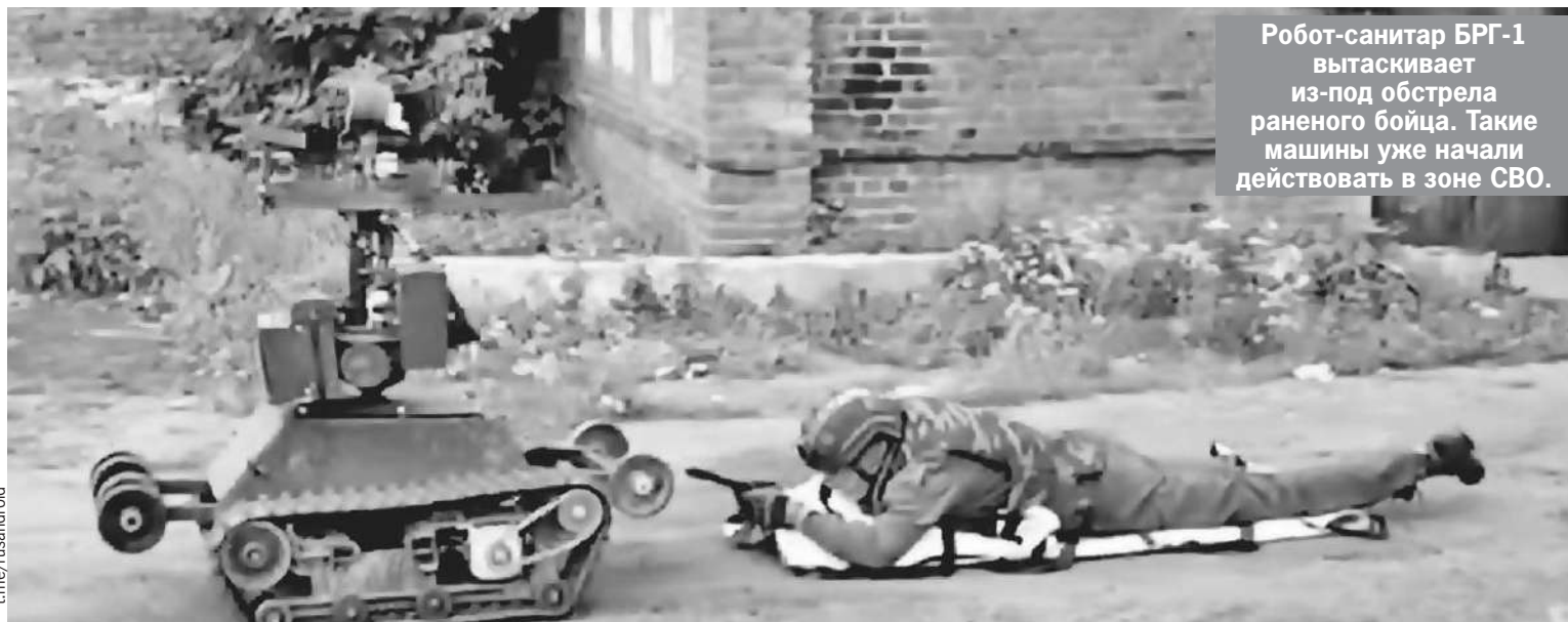
Робот-санитар БРГ-1 вытаскивает из-под обстрела раненого бойца. Такие машины уже начали действовать в зоне СВО.

рядок меньше, чем было в Первую и Вторую мировые войны, - делает вывод известный военный блогер Юрий Подоляка . - Это неизбежно. Поэтому уже отмечаются случаи, когда дроны сбивают друг друга. Но понятно, что они все равно дистанционно управляются человеком.