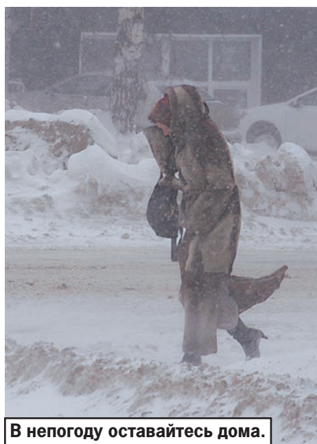
В непогоду оставайтесь дома.