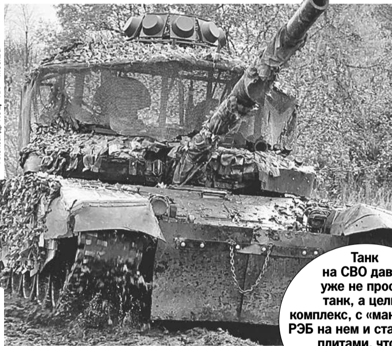
Танк на СВО давно уже не просто танк, а целый комплекс, с «мангалом», РЭБ на нем и стальными плитами, чтобы беспилотник не залетел под днище.

- Мы же наводимся по лазеру, - поясняет командир огневой группы. - А на модернизированных украинских танках Т-64 есть датчик предупреждения о лазерном излучении. Мы делаем так (тут он рассказывает хитрость. - Авт.), и уже на под-