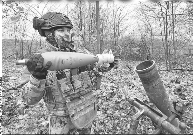
Каждый из пучков, накрученных на хвостовик мины, дает километр дальности.

В составе этой огневой группы есть и FPV-расчеты, и операторы ПТРК, и экипажи танков, и приданные «Грады», и гаубицы, огонь