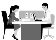
По данным ЦБ.

* Точных сроков введения этих мер пока нет. Реформа ЦБ продлится с 2025 по 2027 год.