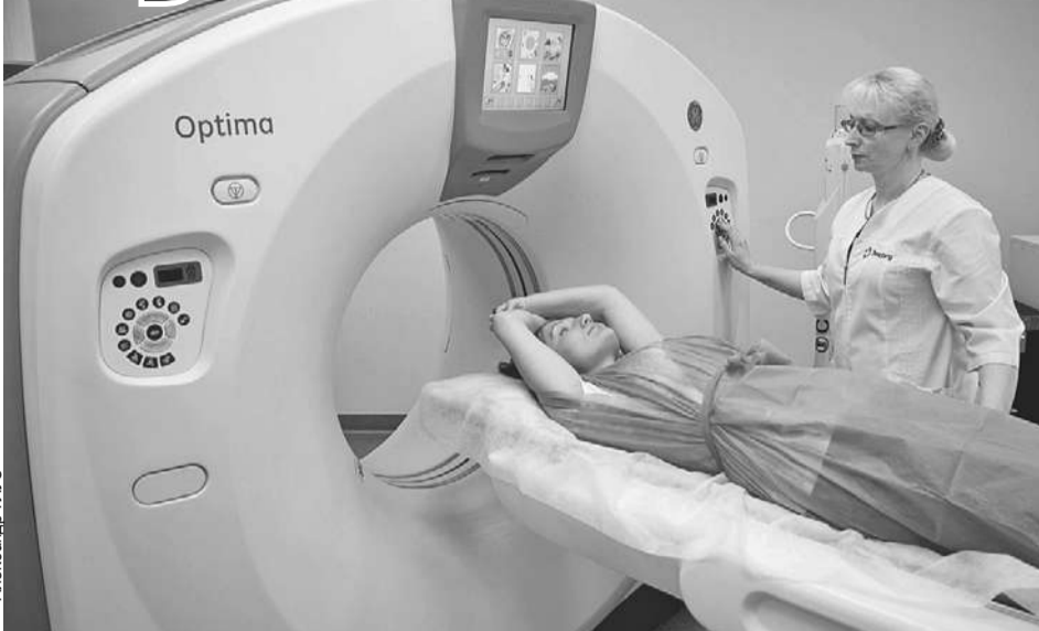
Аппарат МРТ - мощный магнит, поэтому надо снять кольца и пирсинг. И проверить, совместимы ли с ним зубные импланты.