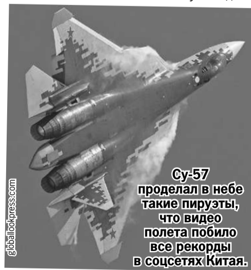
Су-57 проделал в небе такие пируэты, что видео полета побilo все рекорды в соцсетях Китая.

на приобретение Су-57, вызвав массу пересудов, какое же государство совершило громкую покупку. Но просят пока не называть покупателя: «Американцы звереют от ревности и грозят суровыми санкциями». Типичное поведение проигрывающих конкурентов.