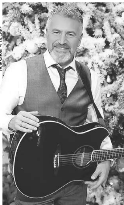
Выступление Агутин на корпоративе - отличный подарок сотрудникам.

В самолете или поезде - чем меньше свободных мест, тем выше цены. И у звезд динамическое ценообразование. Чем выше загруженность артиста, тем выше гонорар. Средний гонорар топового артиста: от 3 млн руб. до 10 млн руб. Плюс налоги. Две последние недели декабря гонорары первой десятки топовых артистов могут вырасти до 12 млн руб. Стандартное выступление эстрадного артиста 45 или 60 минут. По отдельной договоренности - можно дольше.