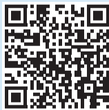
Фото присылайте в «Комсомольскую правду», e-mail: miss@kp.ru

- Платье-футляр появилось в 1950-е. Оригинальное название - вигл-дресс, ведь походка в них становится от бедра благодаря узкому облегающему силуэту.