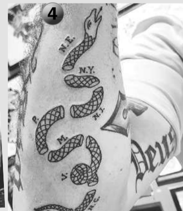
Личная страница героя публикации в социальной сети