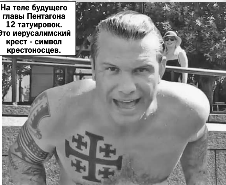
Личная страница героя публикации в социальной сети

На теле будущего главы Пентагона 12 татуировок. Это иерусалимский крест - символ крестоносцев.