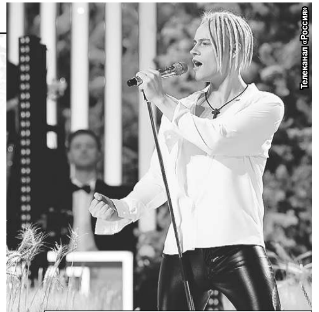
Песня «Я - русский» не раз прозвучит в праздничную ночь.