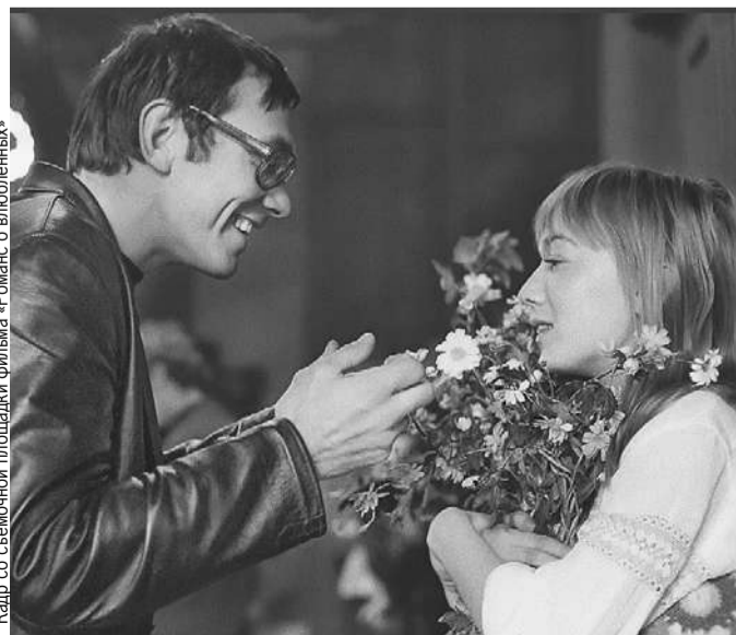
На этих съемках начался роман Андрея Кончаловского и Елены Кореновой.