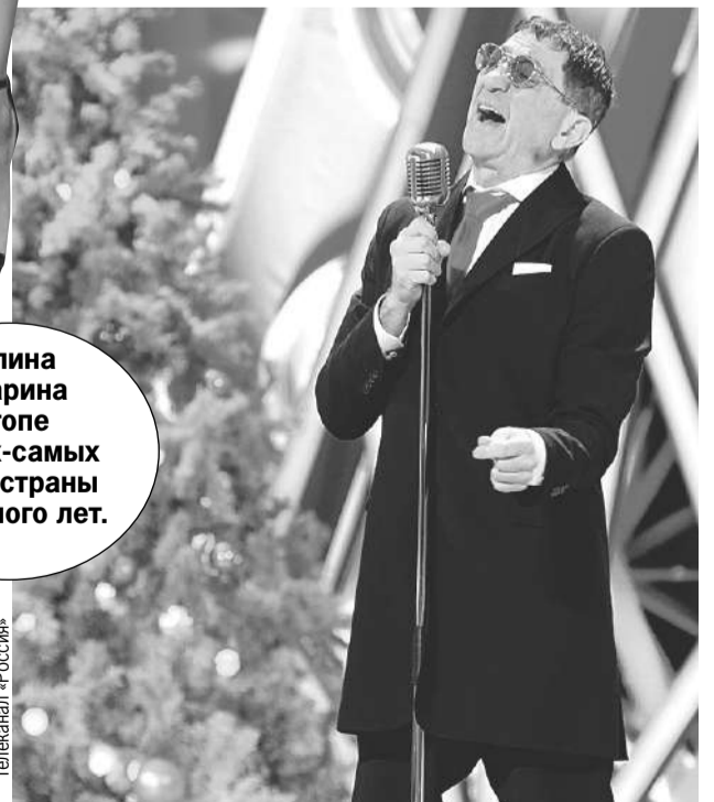
Григорий Лепс в Новый год напомнит о рюмке водке на столе.