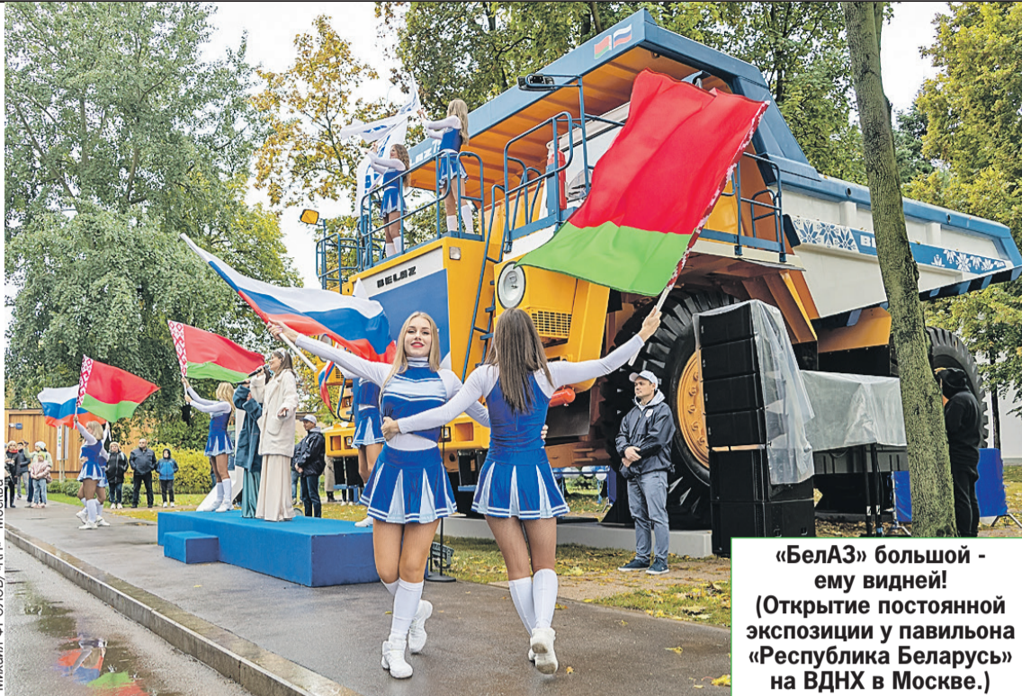
«БелАЗ» большой - ему видней! (Открытие постоянной экспозиции у павильона «Республика Беларусь» на ВДНХ в Москве.)

В феврале 2023 года между нашими странами было подписано соглашение о цене на