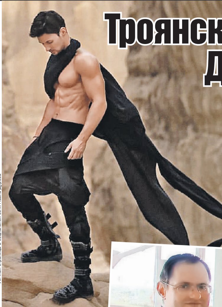
Личная страница в социальной сети Павла Дурова