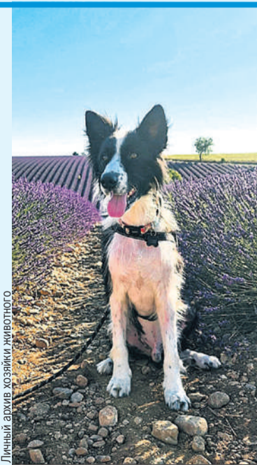
Баки точно был домашним, но почему-то оказался на улице и попался службе отлова.

Неожиданностью для Баки стало знакомство с семилетней кошкой Нишей. Первое время они привыкали друг к другу, но сейчас соседствуют более-менее мирно. Видеосюжет - на KP.RU