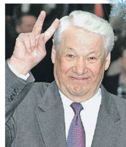
Борис Ельцин любил простую еду, к примеру жареную картошку или пельмени.

Путь к сердцу мужчин лежит через желудок - об этом точно знала Наина Иосифовна, жена первого Президента России Бориса Ельцина. Она удивляла кремлевских поваров своими кулинарными изысками. Друзья семьи вспоминали, что особенно ей удавались пирожки, черемуховый пирог и выпечка.