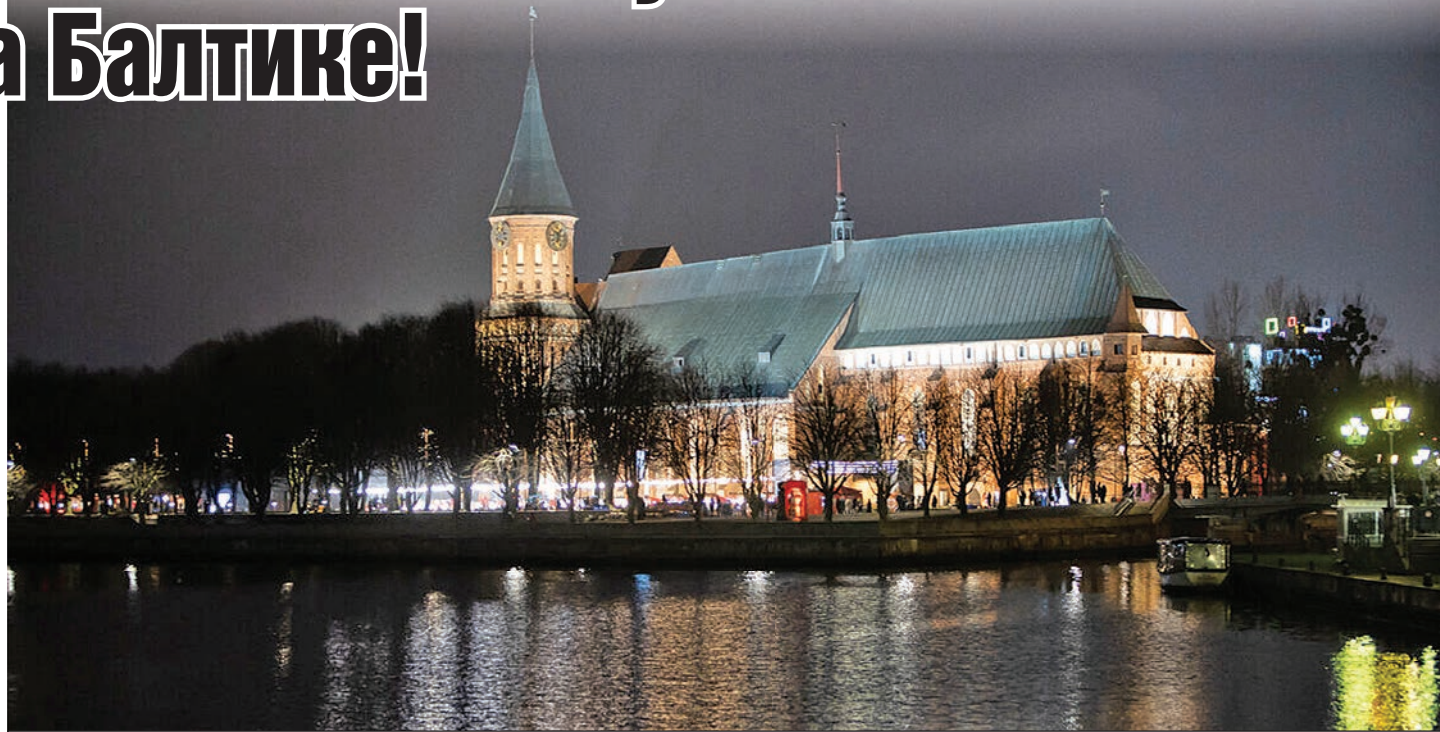
Новогодняя ярмарка на острове Канта откроется 21 декабря.

- Необходимо особенно тщательно проработать вопрос безопасности жителей и гостей города: провести беседы с сотрудниками всех учреждений культуры и иными организациями, участвующими в мероприятиях, проверить системы оповещения и доступность путей эвакуации, - отметил глава области.