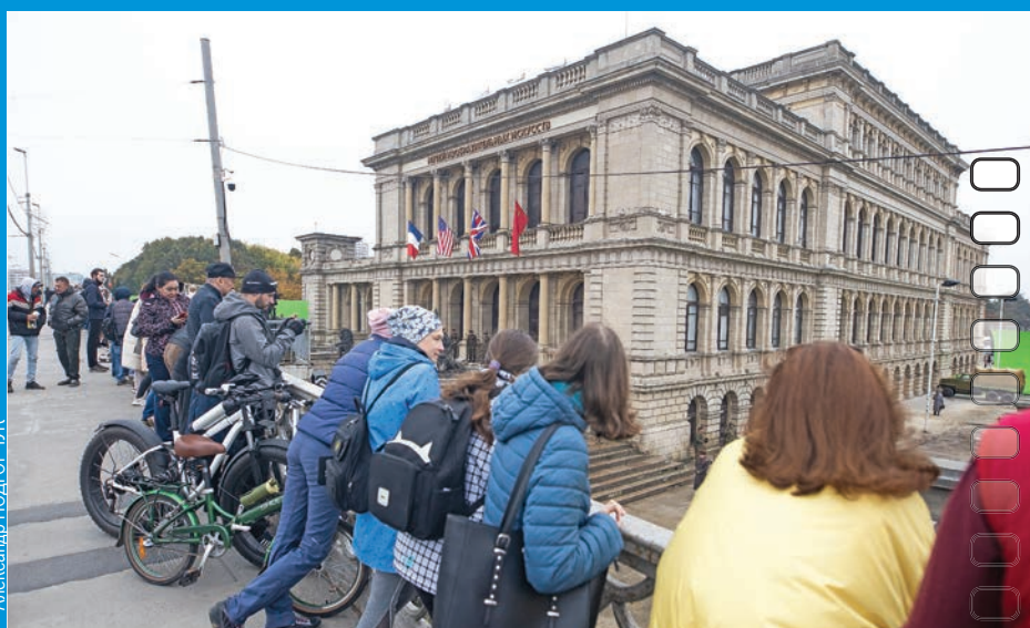
За съемками с эстакадного моста каждый день наблюдали сотни калининградцев и гостей города.

- Наше кино не про архитектуру, а про событие. Какая разница, какие там были ступени? Это здание ведь не похоже на русский терем, верно? Более того, снимать в Нюрнбергском дворце - это как снимать в Московском Кремле. Можно договорить-