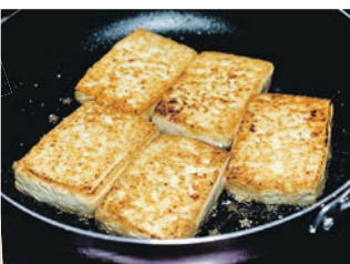
Владимир Ленин в детстве с аппетитом уплетал немецкое блюдо Armer Ritter - «Бедный рыцарь». Это поджаренный батон, залитый яйцом.

Совет шеф-повара: десерт «Сен-Жермен» интересный, но, думаю, не везде удастся раздобыть каштаны. Для новогоднего стола я бы порекомендовал приготовить десерт, который тоже у многих ассоциируется с детством. Например, орешки с вареной сгущенкой.