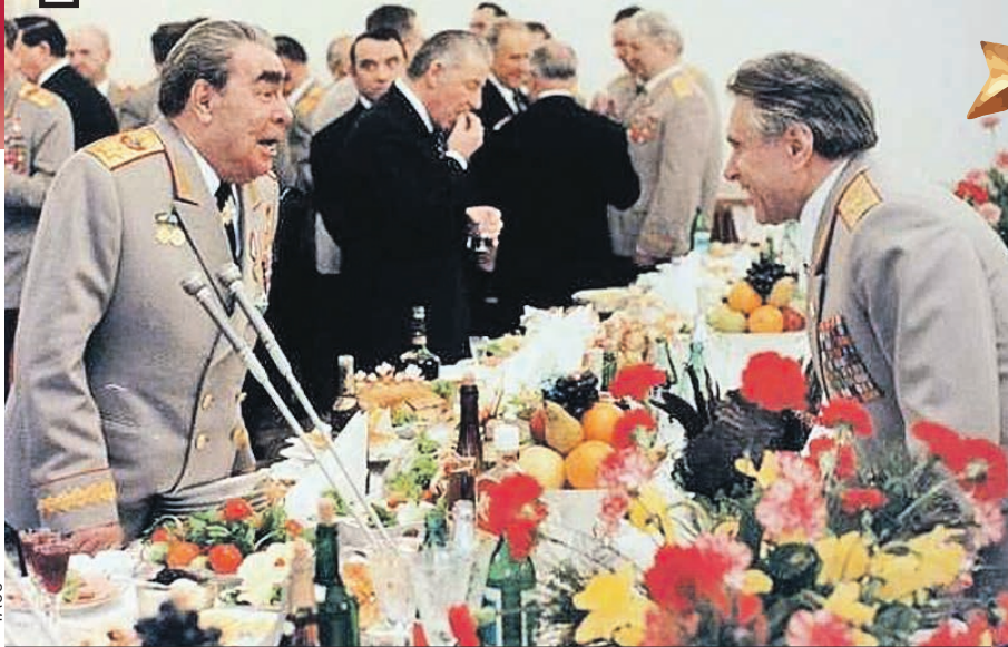
Одно из застолий с Леонидом Брежневым (на фото - с министром внутренних дел СССР Николаем Щёлоковым).