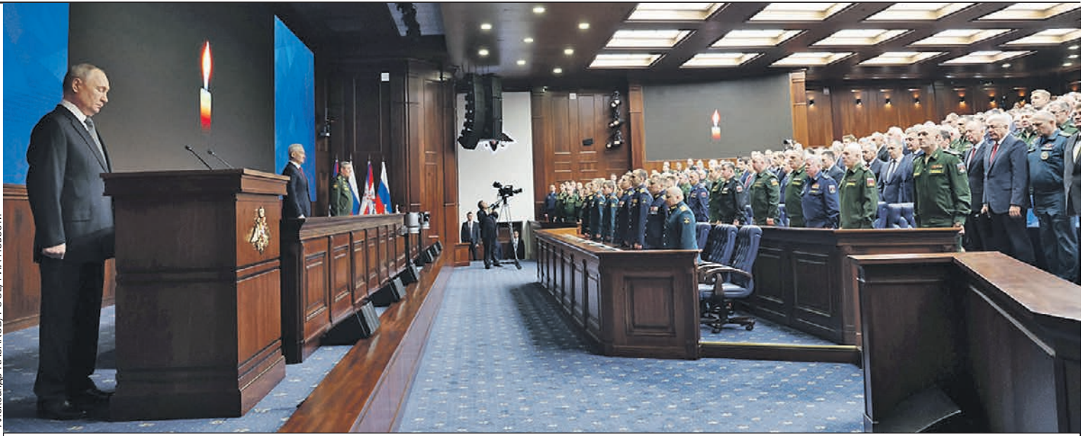
Президент начал коллегию Минобороны с минуты молчания по погибшим. «Наш долг всегда помнить боевых товарищей, окружить постоянной заботой их семьи и детей», - заявил он.

- Пугают свое население тем, что мы собираемся нападать. Эта тактика проста: доводят нас до красной чер-