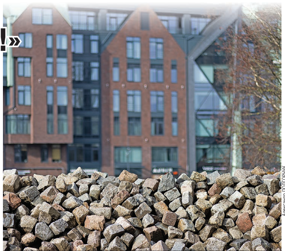
Эксперт уверен, что старое покрытие из камня может служить нам еще несколько столетий.

- Если говорить о памятниках, то, к сожалению, скульптура сейчас в глубоком кризисе. В советское время памятниками занимались только скульпторы, которые состояли в Союзе художников, имели длительную и обширную практику. Открытие памятника превращалось в общегородское событие. На каждый региональный центр было 5-7, в крайнем случае - 10 памятников. Сейчас, к сожалению, скульптура подешевела. Иногда достаточно 600-800 тысяч, 1 млн рублей, чтобы что-то поставить. А если есть «дядя Вася» со сварочным аппаратом, который дарит городу