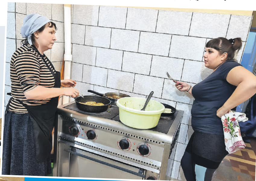
Юлия Андриенко/«КП» - Москва

Приходилось учитывать, что некоторые наши строители держали строгий пост.