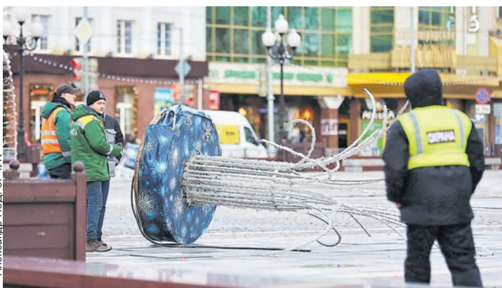
На площади Победы коммунальные службы удерживали новогодние украшения.

По данным метеорологических моделей, с понедельника и до четверга, а есть вероятность, что и до пятницы, в Калининграде будет стабильно выше +5 градусов. Однако с потеплением в регион придут еще и дожди.