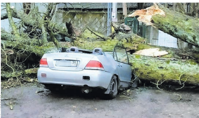
Ствол смял автомобиль.