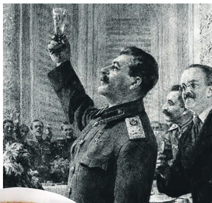
Картина Малькова «Здравный тост за русский народ» (1949). (К слову, сам Сталин предпочитал мясные блюда.)

Баранину порубить на порционные куски и посыпать солью. Крупно нарезать очищенный картофель и кружочками - репчатый лук. Порезать на несколько частей баклажаны и помидоры. В порционные глиняные горшочки положить мясо, картофель, сверху уложить баклажаны, лук, помидоры, посыпать зеленью и добавить стручковый перец