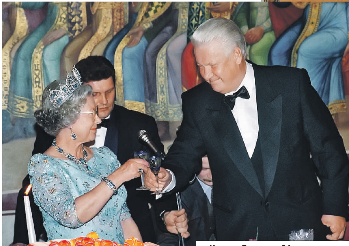
Когда в Россию в 94-м приехала английская королева, в меню включили борщ и блины с икрой.

А пломбир на десерт был клюквенный. Потому что