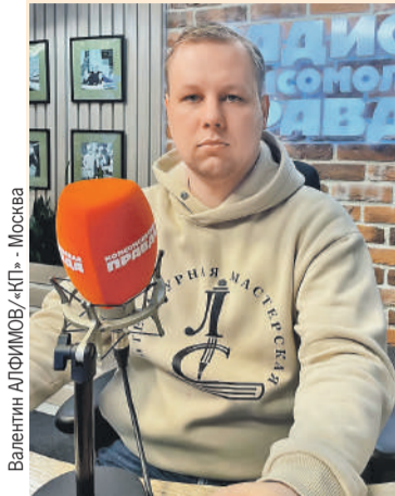
Валентин АФИМОВ/«КП» - Москва

Как живет город через 10 лет после показательной казни прорусских активистов.