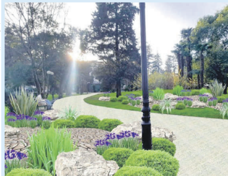
Общественные пространства станут более уютными и красивыми.