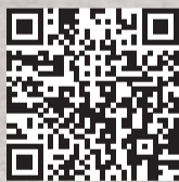
Фото присылайте в «Комсомольскую правду», e-mail: miss@kp.ru

Голосуйте за понравившуюся вам участницу на нашем сайте KP.RU в разделе «Будь стильной с «КП»!