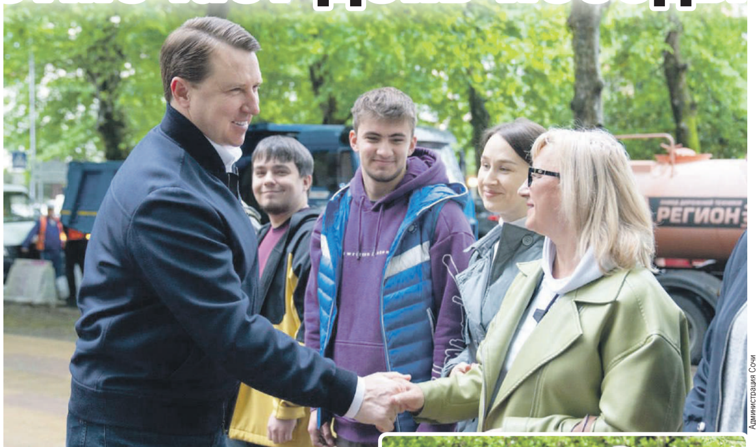
Глава города встретился с местными жителями и обсудил с ними дальнейшее благоустройство курорта.