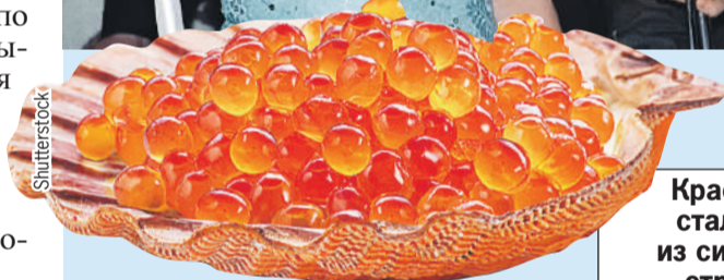
Красная икра стала одним из символов страны.