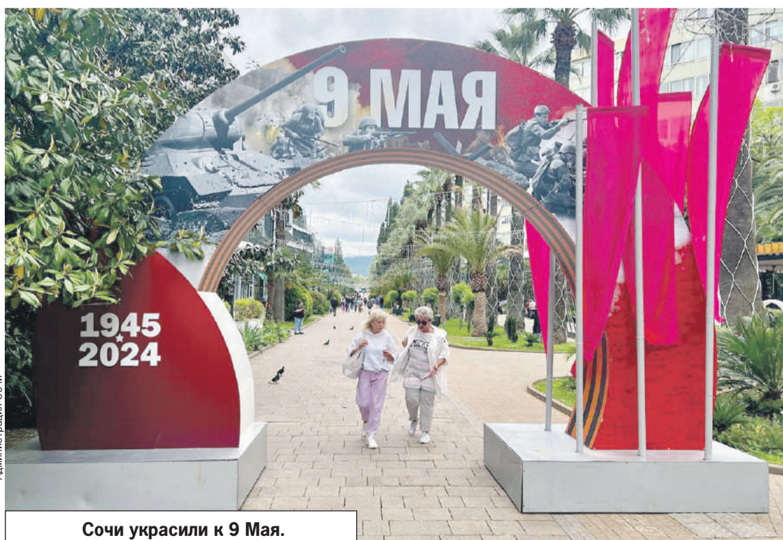
Сочи украсили к 9 Мая.