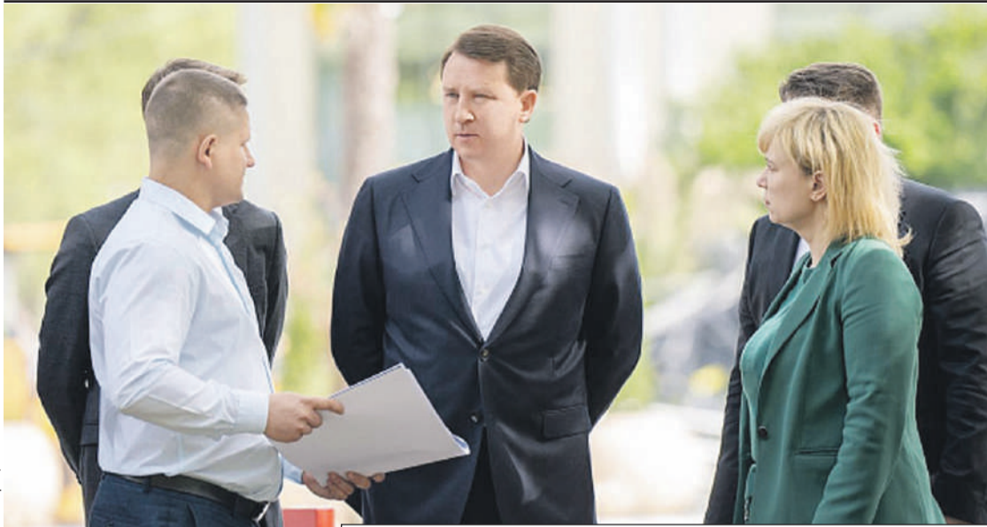
Мэру представили проекты обновления зеленых зон.