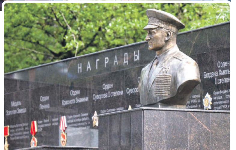
Во всех районах пройдет множество торжественных мероприятий.

- 9 мая во всех районах Сочи в течение дня будут организованы точки активности «Солдатская реконструкция». В частности, они включают в себя выставку военного оружия и техники; дистантный