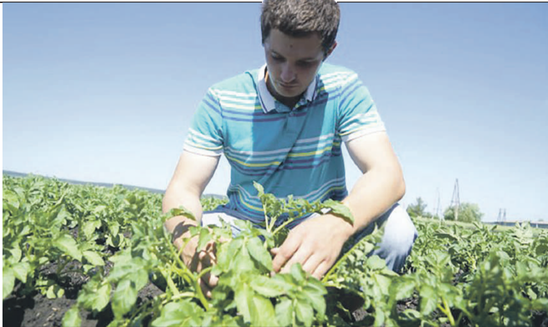
Аграрии окучили картофель и надеются, что всходы отойдут после заморозков.