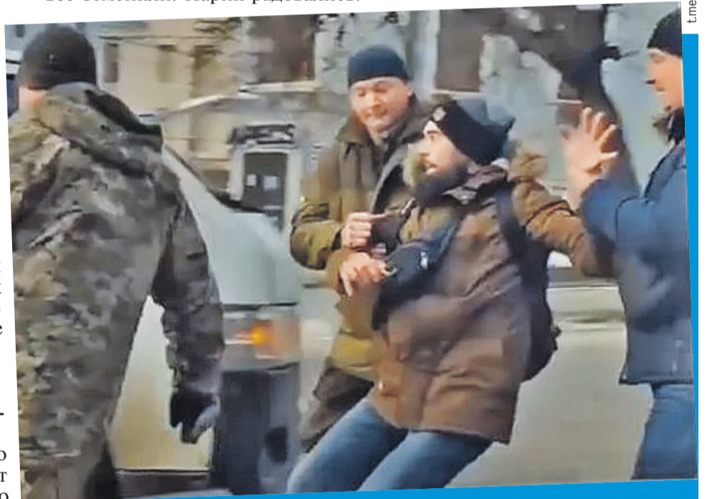
В Одессе мужчин хватают на улицах и отправляют на убой.

- В глубине души воспряли. 24 февраля у нас начало грохотать, от взрывов я проснулся. Когда