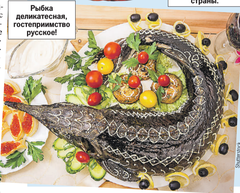
Рыбка деликатесная, гостеприимство русское!

где еще экзотическую ягоду иностранцы попробуют? Таким лакомством, например, накормили Джорджа Буша-старшего, когда в январе 1993-го он впервые приехал в постсоветскую Россию.