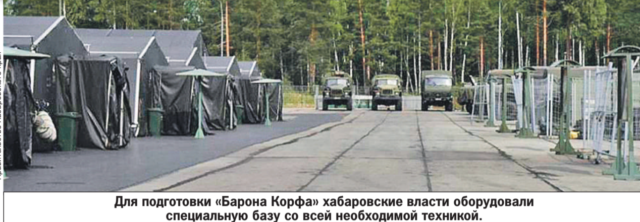
Для подготовки «Барона Корфа» хабаровские власти оборудовали специальную базу со всей необходимой техникой.

Важно! Незапятнанная биография. Неснятая или непогашенная судимость - мимо. Сидевшие и наркома-