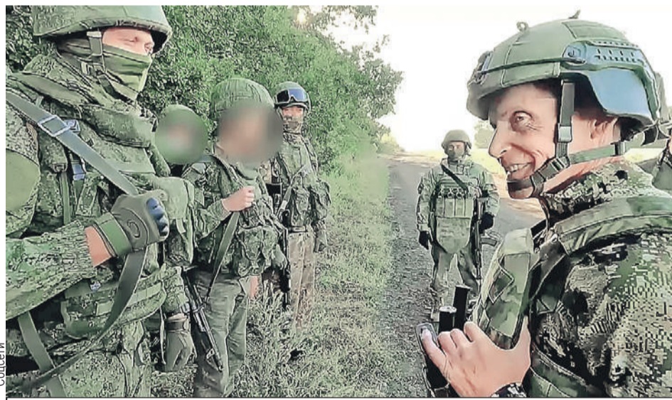
Губернатор Приморья Олег Кожемяко сам бывал в зоне спецоперации. Теперь создает с нуля батальон добровольцев «Тигр».