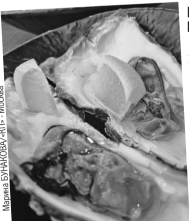
Оказавшись в Приморье, налегайте на морепродукты.

Добраться из Хабаровска до Владивостока автомобилем мы реши-