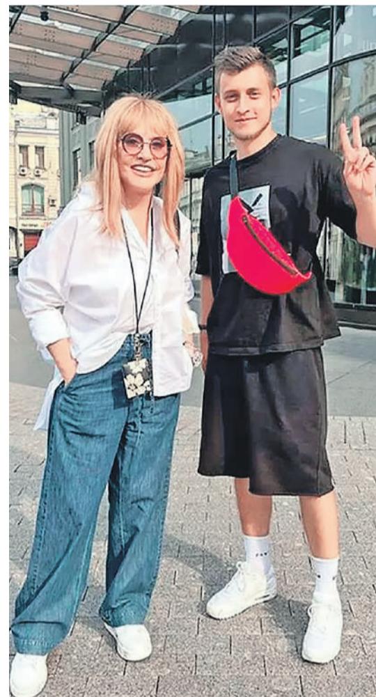
Судя по свежим фото, Алле дома вполне комфортно (рядом с певицей - случайный почитатель ее таланта).

Где сейчас находятся Лиза и Гарри, вернулась ли Примадонна в Москву насовсем и когда к семье присоединится Максим Галкин? Эти вопросы пока остаются без ответа. Но радости поклонников нет предела: в соцсетях ролик утонул в