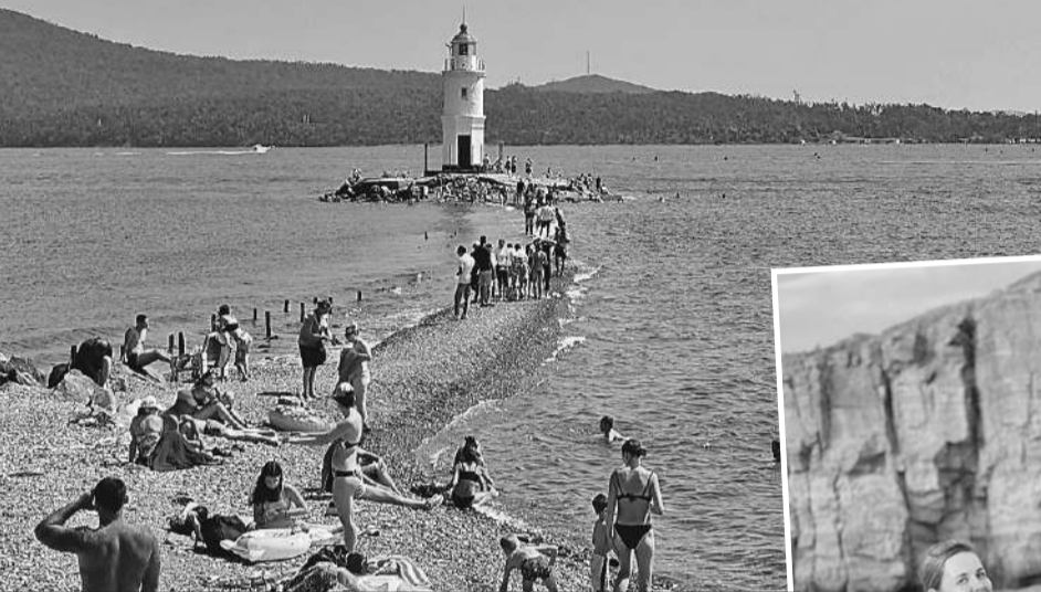
Маяк Токаревского - визитная карточка и место притяжения туристов.

ли не столько из-за любви к пейзажам, сколько из-за отсутствия других вариантов: выкладывать 60 тысяч на авиабилет в одну сторону не хотелось (так бывает не всегда, это бизнес-классовские остатки), а последние два билета в плацкарту увели из-под носа. Но мы мудро рассудили, что во Владивостоке без машины придется туго.