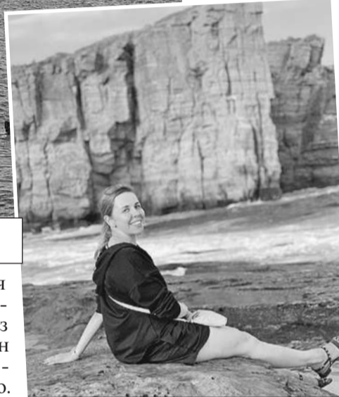
Финальная точка мыса Тобизина. Только вы, скалы и буйные волны.

ную - небольшой залив, усыпанный отшлифованными морем обломками стекла и фарфора. За нынешнюю красоту «спасибо» нужно сказать свалке, просуществовавшей с 1967 по 2012 год - отходы несло волнами оттуда. Правда, вся эта красота еще в допандемийное время сильно полюбилась китайским туристам, которые пакеты вывозили камни-стеклышки как сувенир. Наши тоже руку приложили. Поэтому пляж из стеклянного постепенно становится обычным.