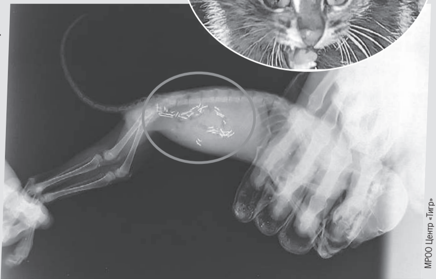
МРОО Центр «Тигр»

Чтобы избавиться от напасти, куски мяса птиц могли напичкать гвоздями или железками. Мама отнесла мясо котяткам, из-за чего те и пострадали. Специалисты центра сейчас ищут сородичей котенка, которые могли также пострадать.