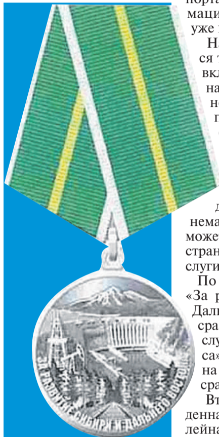
Лента новой награды зеленого цвета с желтой полосой посередине и белой окантовкой. А на самой медали отчеканена Саяно-Шушенская ГЭС.

Владимир Путин утвердил две новые госнаграды.