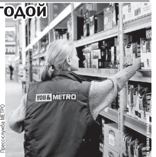
Покупки с запасом лучше всего планировать заранее.

Торговые центры такого рода расположены на всей территории России, они, как правило, работают допоздна, и люди приезжают сюда в поиске качественных продуктов по выгодным ценам.