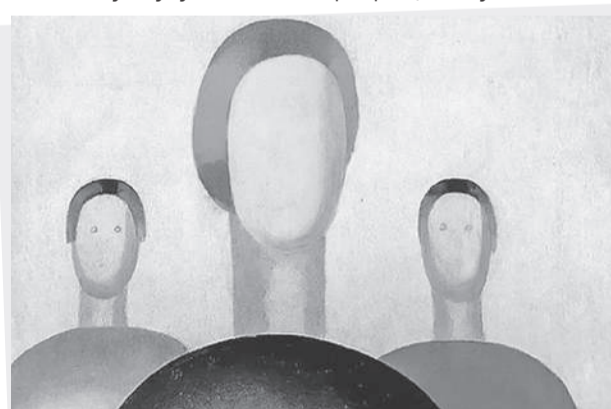
Глазки с полотна уже пропали, картина приняла первозданный вид.

Показали в суде и записи с камер видеонаблюдения. Детей нет. Видно лишь, как Васильев, озираясь по сторонам, достает из кармана ручку и «дорабатывает» полотно по своему вкусу.