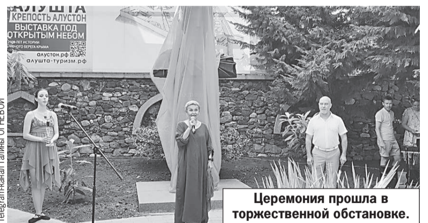
Церемония прошла в торжественной обстановке.

Она уточнила, что монумент был изготовлен на средства из городского бюджета при финансовой поддержке местных предпринимателей. Скульптором памятника выступил Владимир Бродарский .