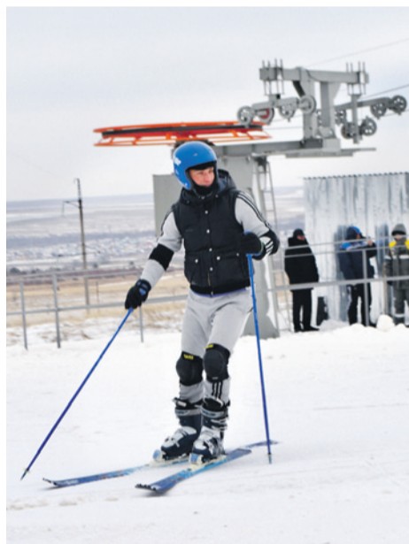
Оренбуржцы обкатали новый горнолыжный спуск.

промышленной безопасности пройдена. Как только людей аттестуют и на горе проверят механизмы, база полноценно заработает. Учредитель в лице администрации Сорочинского округа заканчивает процесс передачи объекта в подконтрольную АНО «ГК «Маяк».