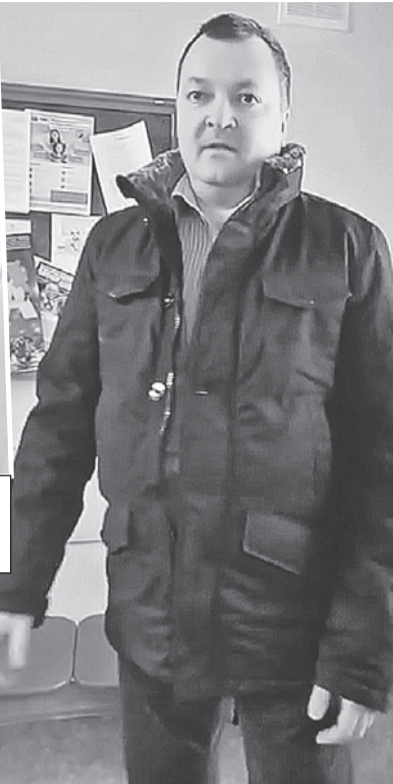
Папа вскипел, когда узнал, что дочку отправили к колдунам изгонять бесов...

еву сейчас проводится служебное расследование и будет решаться вопрос о ее пригодности. И что платное репетиторство в платном же лицее - это предел цинизма.