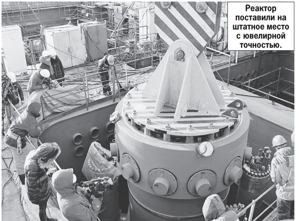
Реактор поставили на штатное место с ювелирной точностью.