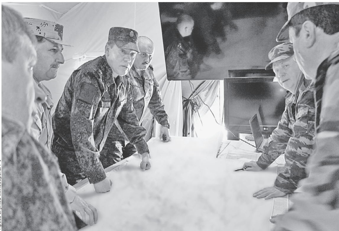
Начальник Генштаба ВС России Валерий Герасимов (на фото - третий слева) постоянно выезжал в Сирию, где доводил до командиров задачи по разгрому боевиков.

Другая важная задача была - организовать управление всеми силами, участвующими в боевых действиях. Для этого был развернут командный пункт нашей группировки в Хмеймиме и пункты управления на направлениях, где ведутся боевые действия.