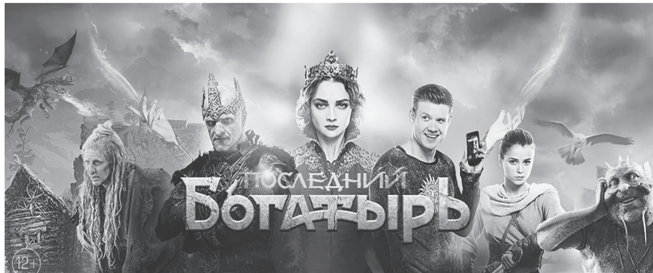
Телепремьера новой сказки «Последний богатырь», уже ставшей блокбастером, - 1 января в 20.30 на телеканале «Россия».

Накануне Нового года кинозрителей ждет еще одна значительная премьера - фильм «Движение вверх», снятый при участии телеканала «Россия 1».