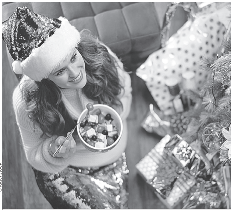
Даже полезной закуски должно быть в меру.

Для традиционных салатов - того же оливье и селедки под шубой - измените ре-