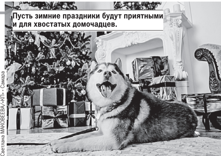
Пусть зимние праздники будут приятными и для хвостатых домочадцев.

Любите своего питомца? Тогда не ставьте дома натуральную елку. Небольшая, искусственная куда безопаснее. Новогоднее дерево может упасть на животное, питомец может начать его грызть, пить воду из емкости для