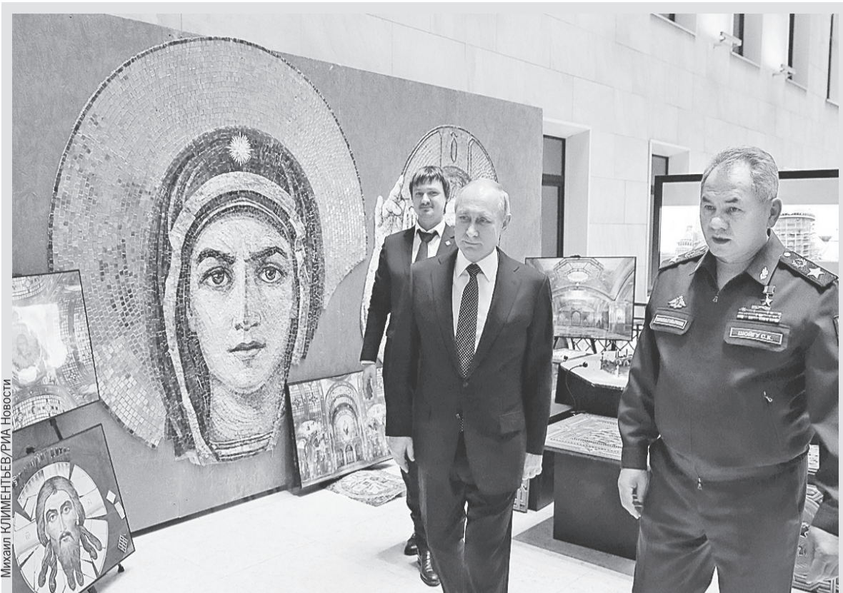
Владимир Путин приехал во вторник на ежегодную коллегию Минобороны. А перед этим Сергей Шойгу провел президента по выставке, на которой были не только новые вооружения, но и образцы внутреннего убранства Главного храма Вооруженных сил, который строится в Подмоскowie к 75-летию Победы.