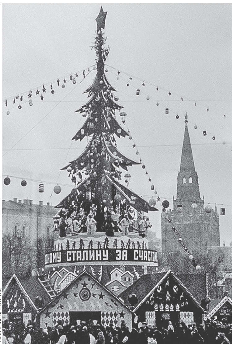
Москва, елка у Троицких ворот. В Кремле - товарищ Сталин, а на новогодней елке среди украшений - здравица в честь великого вождя. 1937 год.

Оказывается, в то время государь заложил не один, а целых три Александровских сада - Верхний, Средний и Нижний - от Угловой Арсенальной до Водовзводной башни: для «красоты, прогулок и праздных забав». Сегодня сад перестали делить на части: теперь он просто один Александровский. Но 200 лет назад народ охотнее всего шел именно к верхней большой рождественской и новогодней елке - у декоративного грота «Руины».