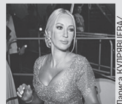
Лариса КУДРЯВЦЕВА

ШОУ-БИЗНЕС У Леры Кудрявцевой в груди лопнул имплант