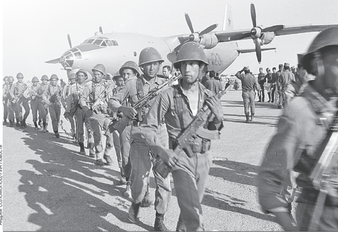
Советский спецназ высаживается в Афганистане. Весна 1988-го.

В самом СССР эта война поначалу держалась в секрете. Газеты и телевидение хранили молчание о ее размахе и потерях, сообщая лишь об исполнении «интернационального долга» в Демократической Республике Афга-