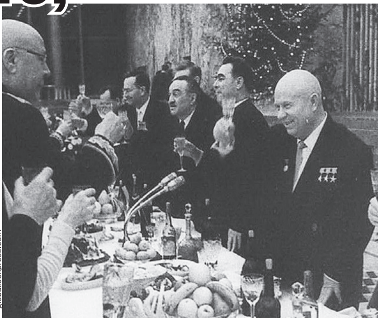
Маршал Советского Союза Семен Тимошенко (на фото - слева) поздравляет первого секретаря ЦК КПСС Никиту Хрущева с Новым годом. Справа от Никиты Сергеевича - его соратники Леонид Брежнев и Анастас Микоян. Москва, Кремль, декабрь 1963 г.

Постышев так и сделал: осудил «левый елочный загиб» и рекомендовал «положить ко-