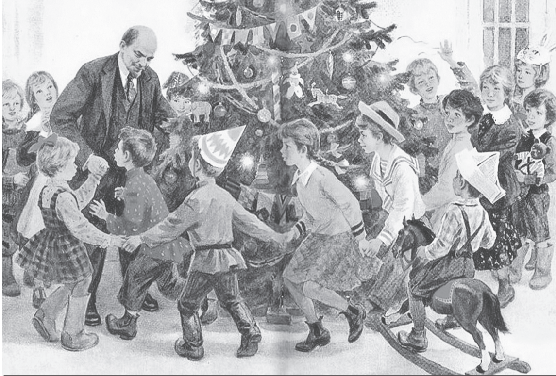
Детский новогодний хор с дедушкой Лениным. Поздравительная открытка. 1950-е годы.

ной хороминной на Красной площади, в Тайницком саду у зданий Старых и Новых приказов и у Лобного места, перед Спасскими воротами.