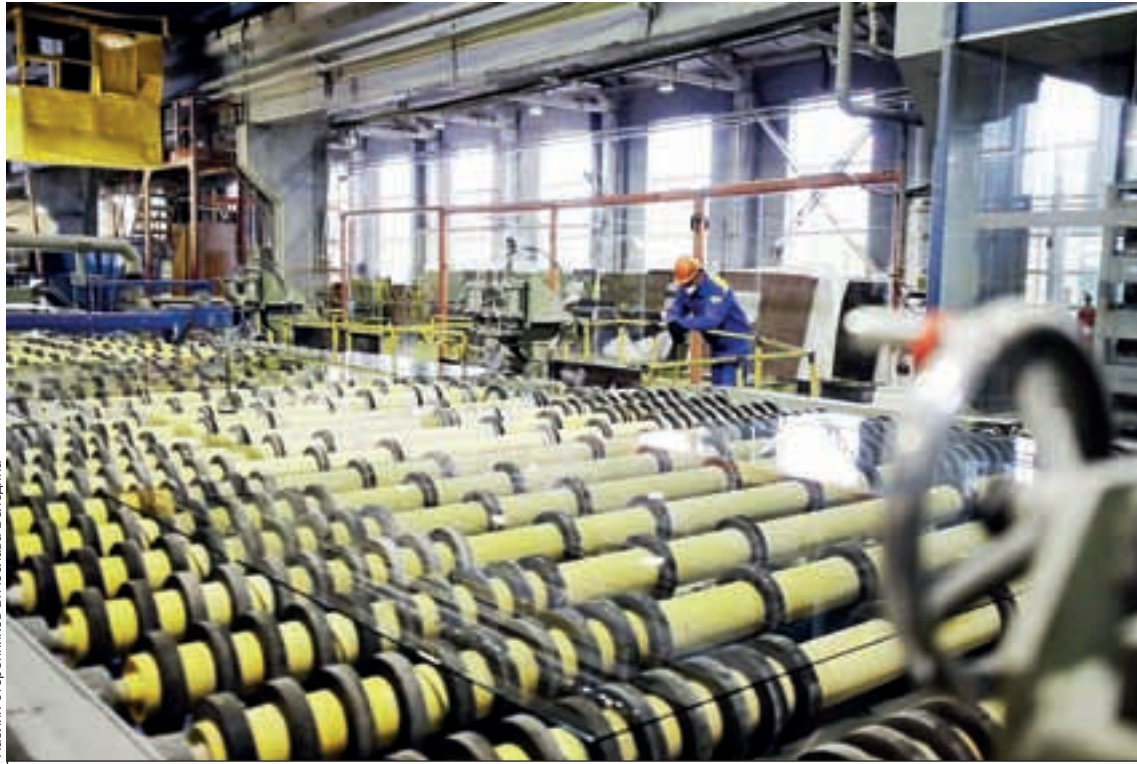
В России не так много подобных Саратовскому институту стекла предприятий, поэтому вопрос сохранения завода имеет большое значение.

Институту удалось сохранить рабочие места, тем самым обеспечив серьезный задел для будущего развития предприятия, так как специалисты, работающие в АО «Саратовский институт стекла», имеют огромный опыт в производстве листового стекла. К сожалению, в настоящее время на территории РФ функционирует не так много предприятий стекольной промышленности, в связи с этим сохранение производственной деятельности предприятия имеет