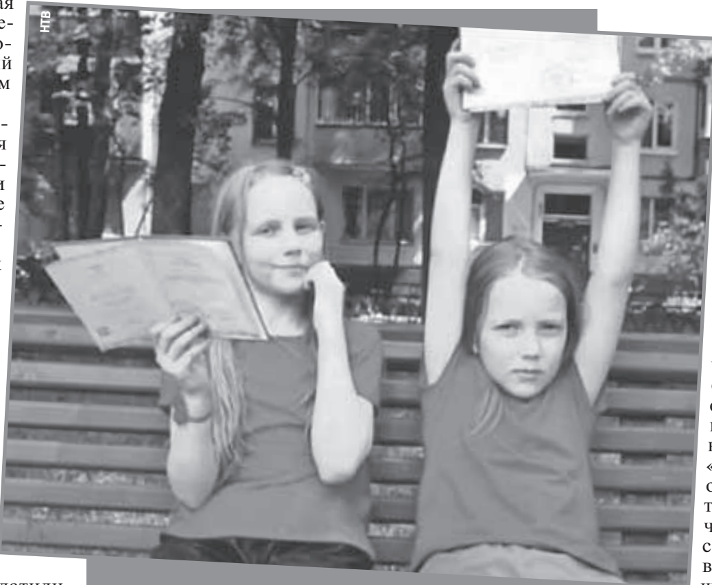
Сестра (слева) и брат очень похожи и лицом, и судьбой. И одинаково не улыбкивы - не оттого ли, что лишены детства?

как оказалось, уже пробовала поступить в «Синергию» в прошлом году, но у нее даже не приняли документы.