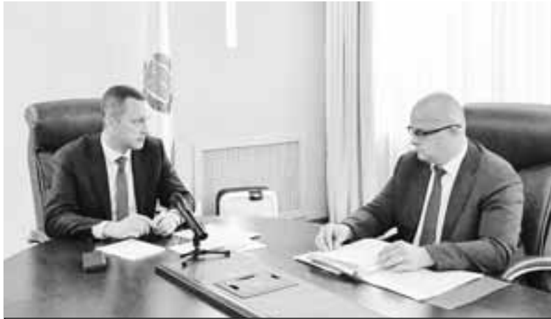
Роман Бусаргин поставил ряд задач перед главами районов.

в с. Нива, которая пострадала от ураганного ветра. Помощь выделит из резервного фонда правительства области.