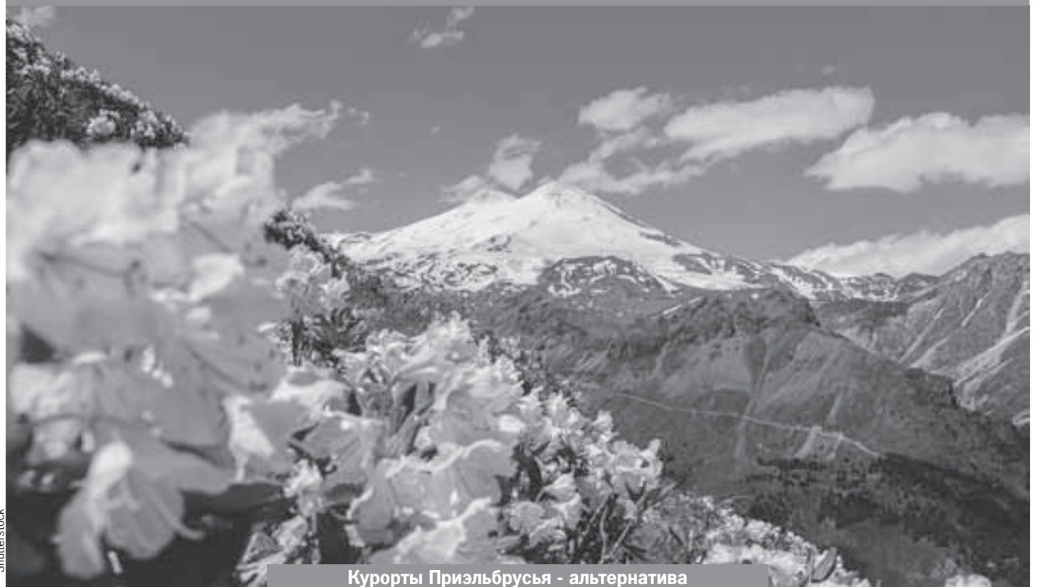
Курорты Приэльбрусья - альтернатива отдыху на море.