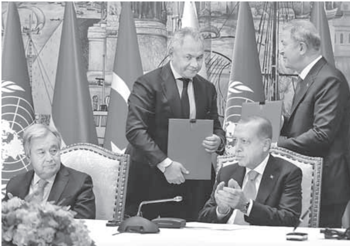
Генсек ООН Антониу Гутерриш, министр обороны РФ Сергей Шойгу, президент Турции Реджеп Эрдоган и глава Минобороны Турции Хулуси Акар (слева направо) на подписании соглашения о вывозе зерна.