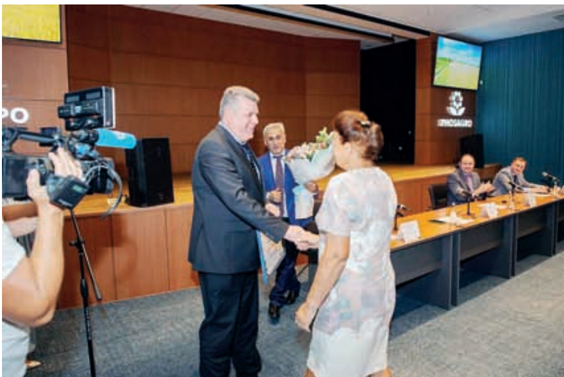
Руководители ПАО «ФосАгро» передали Совету ветеранов ППО «ФосАгро-Балаково» полмиллиона рублей.

- Одним из главных проектов станет модернизация сернокислотной установки СК-20, производительность которой будет увеличена... Это принципиально важный момент, поскольку серная кислота необходимого нам качества - крайне дефицитное сырье. Поэтому мы стремимся снизить зависимость от внешних поставщиков.