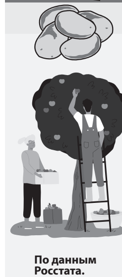
По данным Росстата.