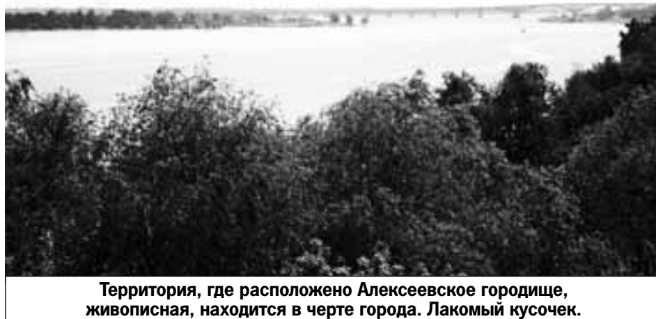
Территория, где расположено Алексеевское городище, живописная, находится в черте города. Лакомый кусочек.

- Сначала необходимо провести исследование на наличие либо отсутствие объектов археологического наследия. Разрешение на проведение работ может быть выдано только