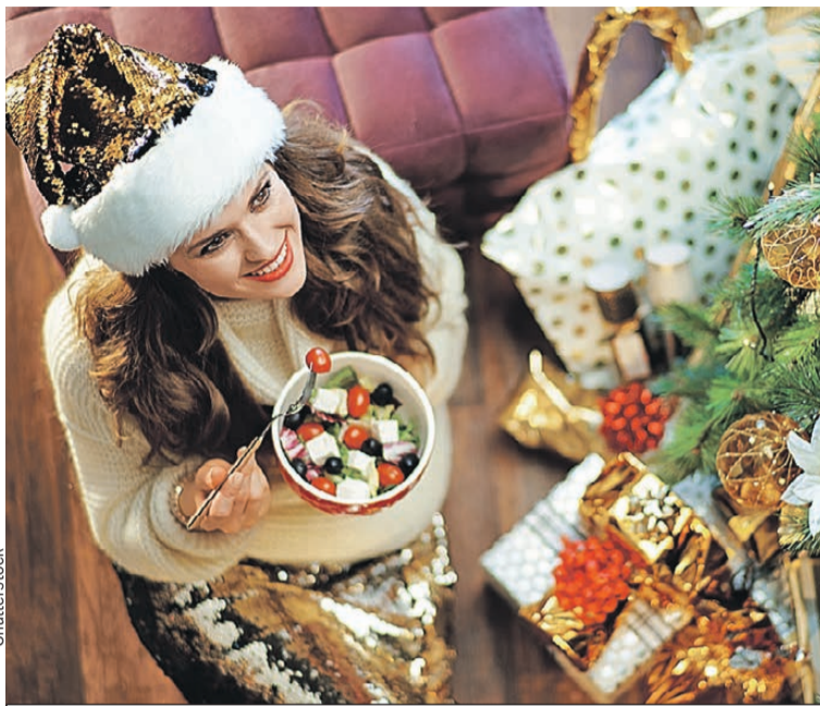
Даже полезной закуске должно быть в меру.

цепт. Картофеля кладите самый минимум, как будто это дорогой деликатес. Во-вторых, вместо покупного майонеза возьмите более легкую заправку (например, греческий йогурт или сметану) или сделайте домашний майонез. Так вы будете знать, что использовали самые свежие и натуральные компо-