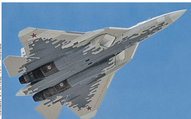
Михаил ФРОЛОВ/«КТ» - Москва

Срочно поднятый в воздух поисково-спасательный вертолет быстро обнаружил дымящуюся воронку от врезавшегося в землю истребителя. А в нескольких километрах - приземлив-