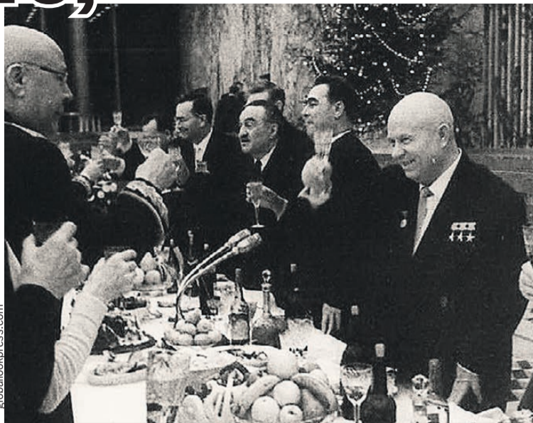
Маршал Советского Союза Семен Тимошенко (на фото - слева) поздравляет первого секретаря ЦК КПСС Никиту Хрущева с Новым годом. Справа от Никиты Сергеевича - его соратники Леонид Брежнев и Анастас Микоян. Москва, Кремль, декабрь 1963 г.

Постышев так и сделал: осудил «левый елочный загиб» и рекомендовал «положить ко-