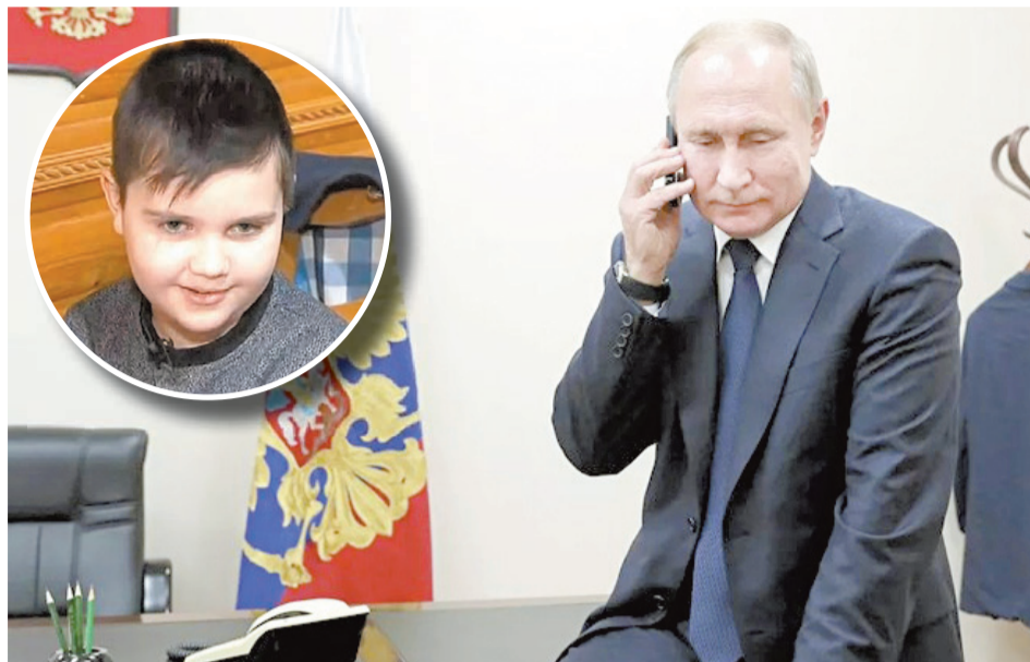
Президент поговорил с мальчиком по телефону.