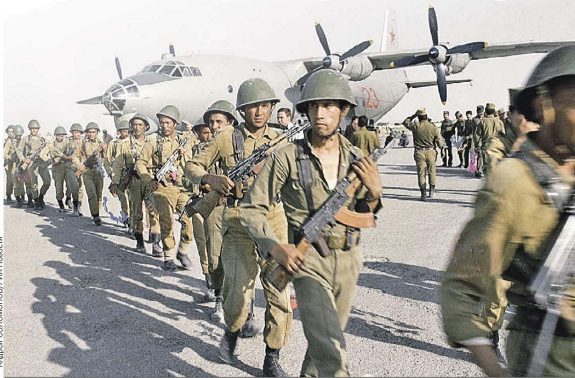
Советский спецназ высаживается в Афганистане. Весна 1988-го.

В самом СССР эта война поначалу держалась в секрете. Газеты и телевидение хранили молчание о ее размахе и потерях, сообщая лишь об исполнении «интернационального долга» в Демократической Республике Афга-