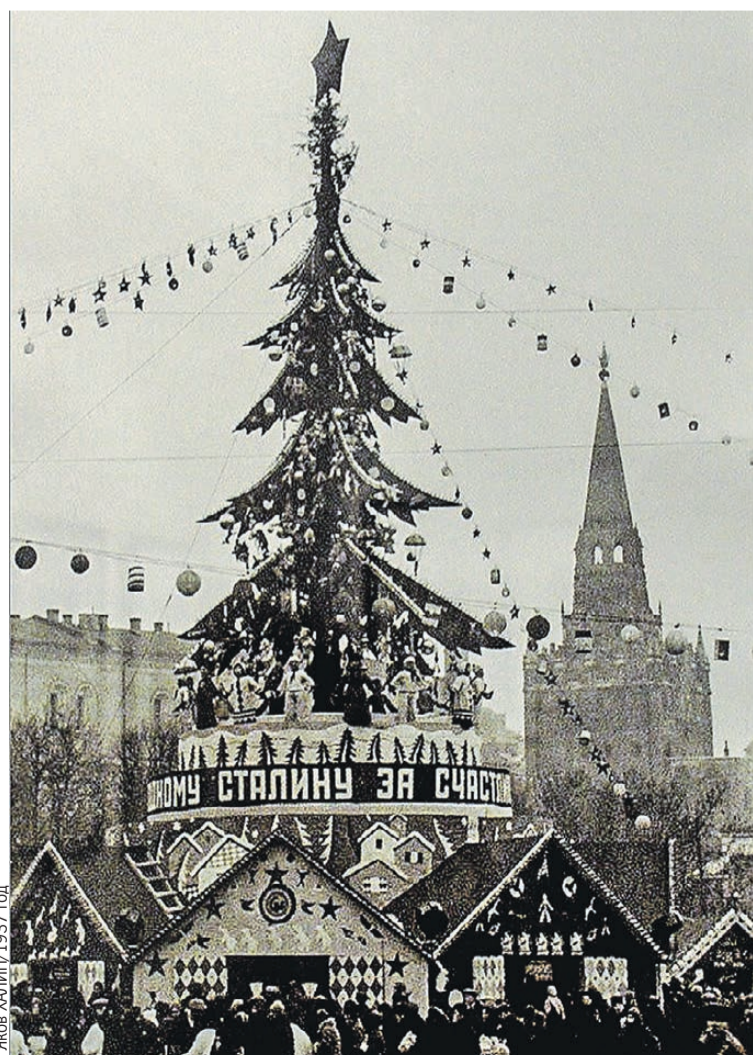
Москва, елка у Троицких ворот. В Кремле - товарищ Сталин, а на новогодней елке среди украшений - здравица в честь великого вождя. 1937 год.

Оказывается, в то время государь заложил не один, а целых три Александровских сада - Верхний, Средний и Нижний - от Угловой Арсенальной до Водовзводной башни: для «красоты, прогулок и праздных забав». Сегодня сад перестали делить на части: теперь он просто один Александровский. Но 200 лет назад народ охотнее всего шел именно к верхней большой рождественской и но-