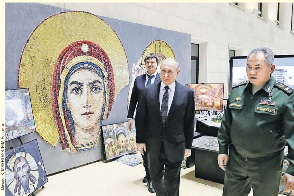
Владимир Путин приехал во вторник на ежегодную коллегию Минобороны. А перед этим Сергей Шойгу провел президента по выставке, на которой были не только новые вооружения, но и образцы внутреннего убранства Главного храма Вооруженных сил, который строится в Подмоскowie к 75-летию Победы.

- Я пью даже не чай, а заваренные, облитые кипятком травы с Алтая.