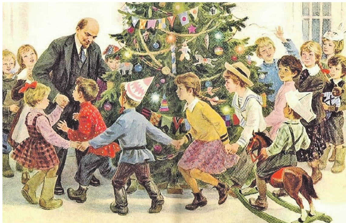
Детский новогодний хоровод с дедушкой Лениным. Поздравительная открытка. 1950-е годы.

ной хороминой на Красной площади, в Тайницком саду у зданий Старых и Новых приказов и у Лобного места, перед Спасскими воротами.