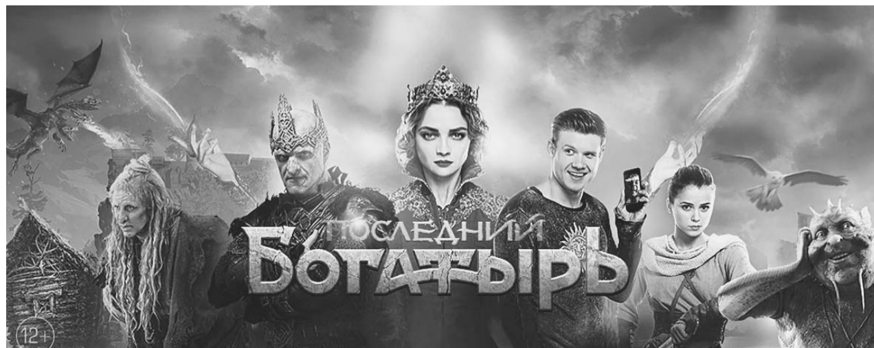
Телепремьера новой сказки «Последний богатырь», уже ставшей блокбастером, - 1 января в 20.30 на телеканале «Россия 1».

«Премьера фильма «Последний богатырь» на телевидении в столь короткие сроки - это исключение из классических правил индустрии, связанное с абсолютным феноменом, который создала сказка.