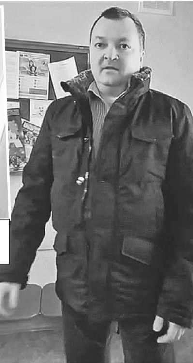
Папа вскипел, когда узнал, что дочку отправили к колдунам изгонять бесов...