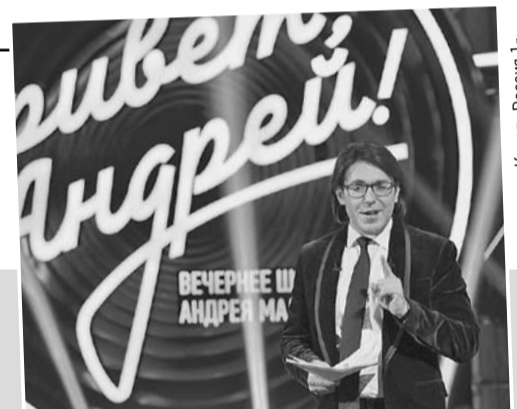
Бывшим коллегам Малахов передает привет из студии своего нового шоу «Привет, Андрей!».

Однажды в гости к Ивану Урганту в его вечернее шоу пришла Ирена Понарошку . Она принесла крем для лица, который Ургант тут же начал втирать в щеки и лоб. А когда Ирена вдруг сообщила, что это соловьиный помет, Иван лихо сымпровизировал: мол, так могло бы называться шоу на канале «Россия». Владимир Соловьев , в адрес которого и прозвучал выстрел, обиделся и заявил, что шутку про него начали «цитировать обвиняемые в педофилии граждане, находящиеся в бегах в Праге», а все украинские сайты стали «с радостью печатать, какой Ургант молодец».