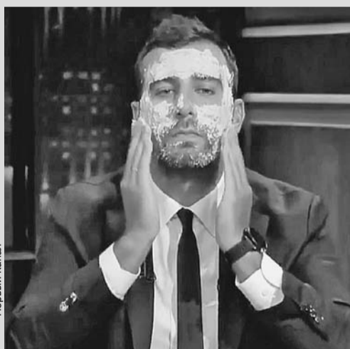
Намазав лицо кремом из соловьиного помета, Иван Ургант придумал шутку, очень расстроившую Владимира Соловьева.