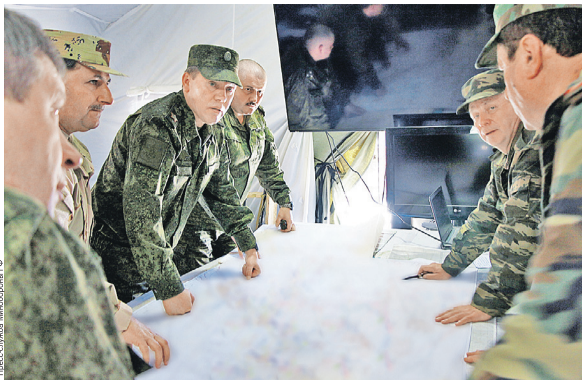
Начальник Генштаба ВС России Валерий Герасимов (на фото - третий слева) постоянно выезжал в Сирию, где доводил до командиров задачи по разгрому боевиков.

Другая важная задача была - организовать управление всеми силами, участвующими в боевых действиях. Для этого был развернут командный пункт нашей группировки в Хмеймиме и пункты управления на направлениях, где ведутся боевые действия.