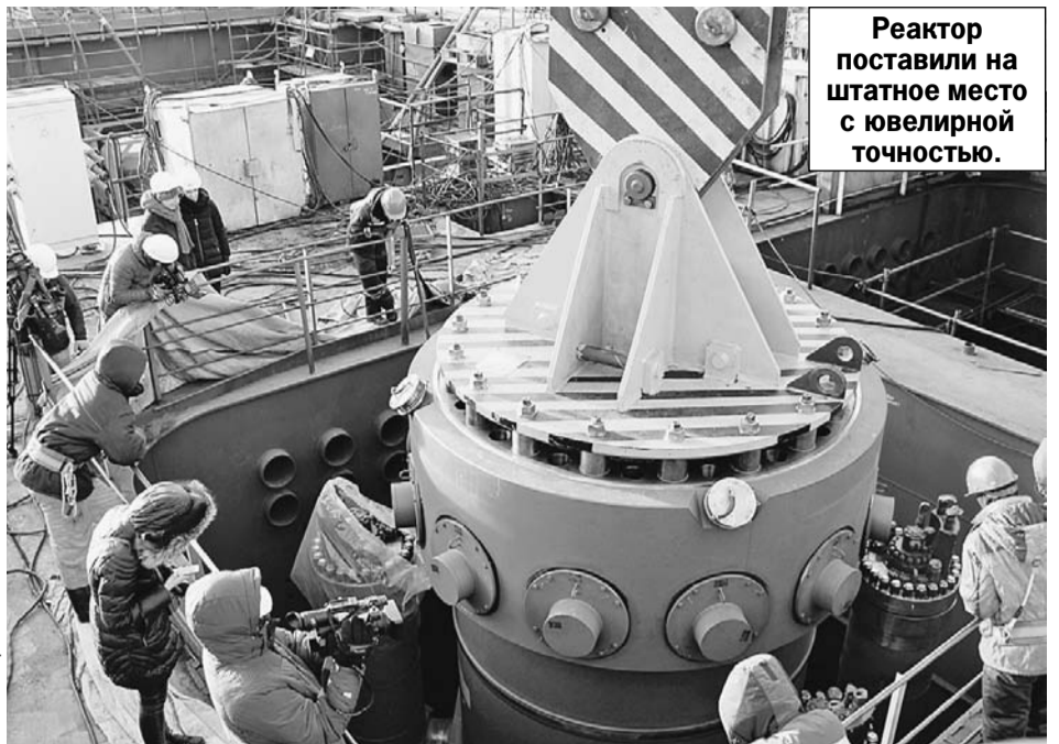
Реактор поставили на штатное место с ювелирной точностью.