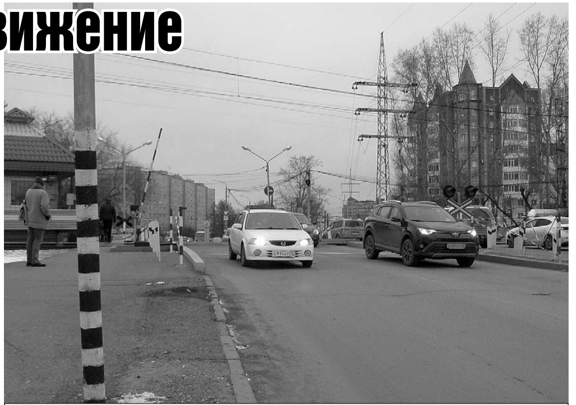
Один из самых оживленных переездов - Мокрушинский.

Реальная картина показывает, что транспортные заторы возникают вовсе не на самих переездах. Движение затруднено из-за пробок за пределами Степановского и Мокрушинского переездов, в городской части. Для снижения напряженности железнодорожники не раз предлагали властям города и области конкретные меры. К примеру, по Степановскому переезду увеличить время разрешающего сигнала светофора с установкой дополнительной стрелки дорожного знака, постоянно разрешающего поворот направо с центральной улицы