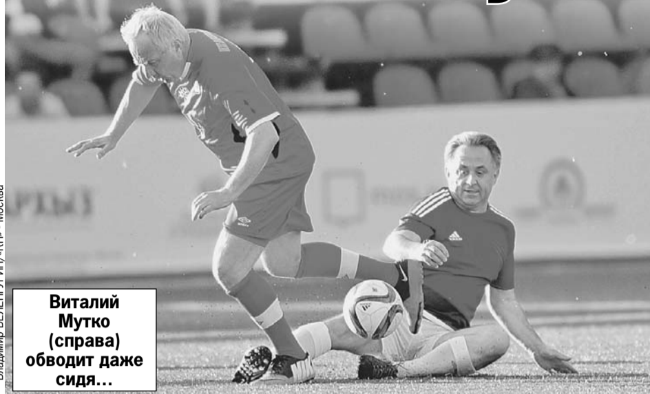
Виталий Мутко (справа) обводит даже сидя...

тень хотя бы на время. Чтобы не злить ту же британскую прессу, которая с 2010 года требует отнять ЧМ-2018 у России.