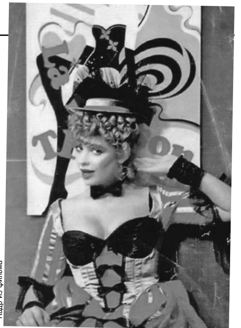
Актриса Наталья Лапина в фильме «Руанская дева по прозвищу Пышка». 1989 год.

- Какой разговор с ним сейчас вспоминается?