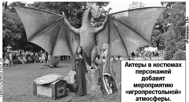
Актеры в костюмах персонажей добавят мероприятию «игропрестольной» атмосферы.

В каждом городе можно будет познакомиться с победителями конкурса «Двойники престолов», который REN TV провел в социальных сетях и на сайте ren.tv.