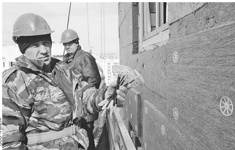
Современный капремонт может дать экономию ежемесячных платежей до 30%.

ребление зданий, а следовательно - сократить платежи жителей за коммунальные услуги. Это приоритет работы регионального фонда капремонта, конечно, наряду с надежностью и качеством.