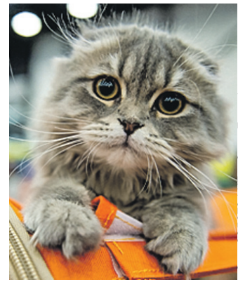
Олег ЗОЛОВО/«КП» - Санкт-Петербург