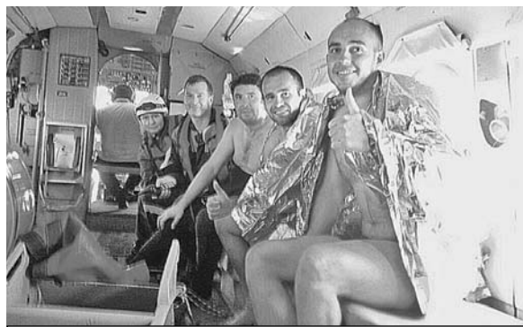
Спасенных туристов (на фото крайние справа) доставили на землю вертолетом.

нулись - скоро. Да только скоро не получилось.