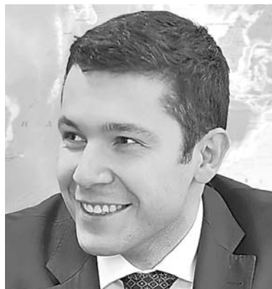
Звание самого молодого губернатора России вчера перешло от 31-летнего калининградца Антона Алиханова (справа) 30-летнему Дмитрию Артюхову (слева).