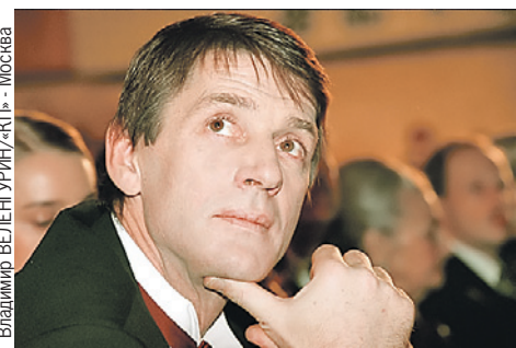
Владимир БЕЛЕНГУРИН/«КП» - Москва