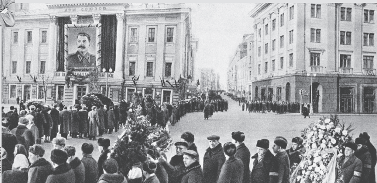
Очередь желающих попрощаться тянулась к Дому Союзов со всех окрестных улиц.