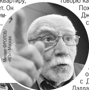
Михаил ФРОЛОВ/ «КП» - Москва

82-летний Армен Джигарханян после развода и раздела имущества возвращается в старую квартиру на Арбате. Но уже не свою.