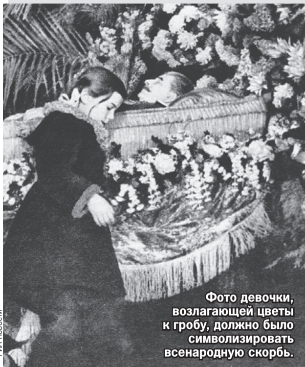
Фото девочки, возлагающей цветы к гробу, должно было символизировать всенародную скорбь.