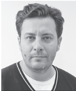
Сергей Минаев открыто смотрит в будущее. Травля так травля!

- Мне было приятно и радостно это читать. Потому что практически все мои проекты громко обсуждают. Так уж мне повезло. И есть определенная когорта людей, которые, что бы я ни делал - издавал журнал, писал сценарии или выпускал книги, - скажут всегда только одно: «Ему это написали на