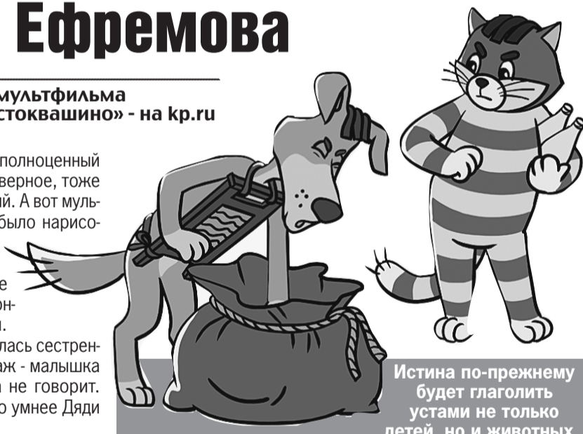
Истина по-прежнему будет глаголить устаи не только детей, но и животных.

Премьера, как пообещала председатель правления «Союзмультфильма», состоится в интернете 1 апреля. Скорее всего, на канале YouTube - когда будет готова вторая серия.