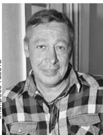
Там М. Ефремов - кот ученый...

На премьеру первой серии реинкарнации знаменитого мультка «Трое из Простоквашино» я забрел из педагогического интереса. Для детишек (да и для взрослых) конца 70-х - начала 80-х простоквашинские мультфильмы «по Успенскому» стали кладом новой образовательной стратегии. Вдумайтесь: первоклассник по имени Дядя (!) Федор - то есть он уже обладает некоторым авторитетом - едет в деревню, где хозяйство ведут кот и пес. Папа с мамой - в городе. Они доверяют сыну, изредка навещают. Ну это же караул, товарищи! Куда смотрят соцзащита и школа? За разносторонней компанией приглядывает один разумный взрослый - почтальон Печкин!