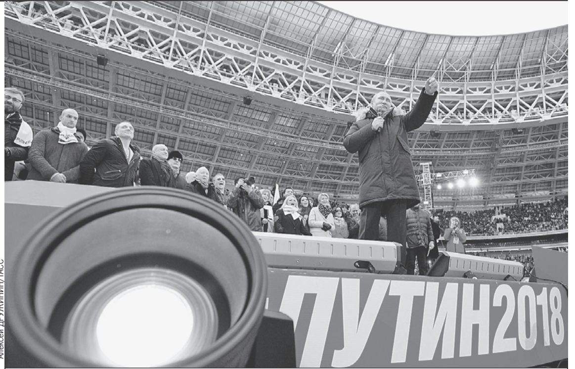
Владимир Путин, выступая на митинге «За сильную Россию!» на стадионе «Лужники», рассказал, как нам стать страной, которой все будут завидовать...

У нас благородные и ясные цели, - продолжил он. - Мы хотим сделать нашу страну