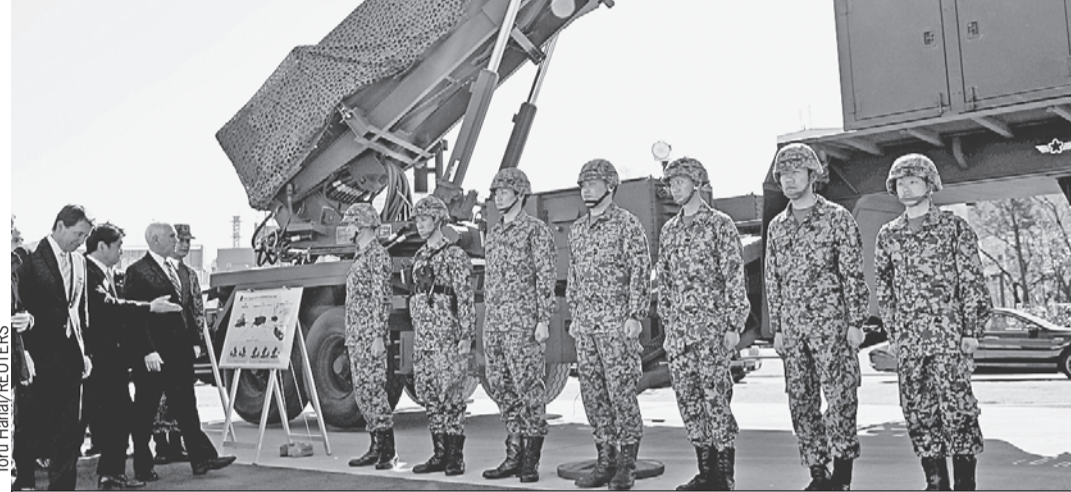
Вице-президент США Майк Пенс в феврале инспектировал размещение в Японии элементов системы ПРО, которая в марте свою актуальность утратила...

«Последние три года мир держится на намеренных утечках о разработке в России автономных подводных аппаратов-беспилотников с мощными ядерными боеголовками, способных потопить Американский континент. Военным США не дают поднять над Россией меч только потому, что они не смогут прикрыть своего налогоплательщика щитом», - объяснил «КП» информированный дипломат.