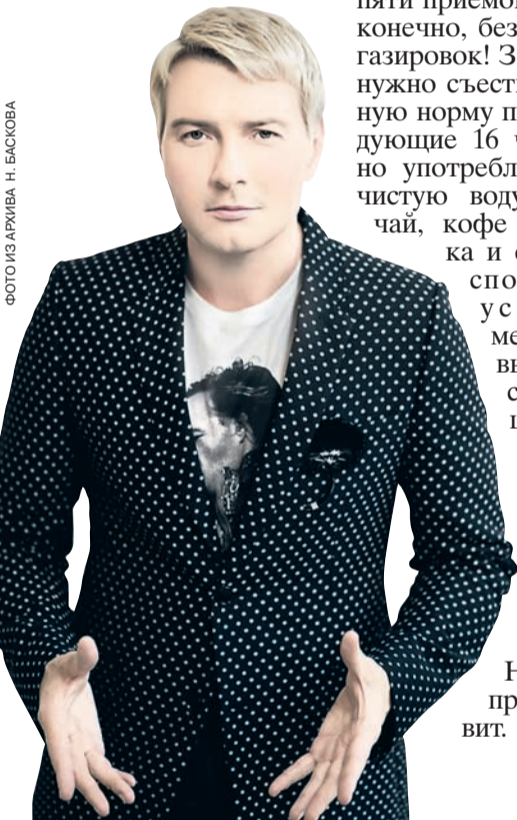
ФОТО ИЗ АРХИВА Н. БАСКОВА