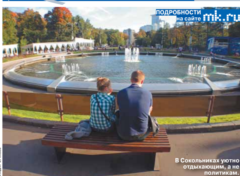
В Сокольниках уютно отдыхать, а не политикам.