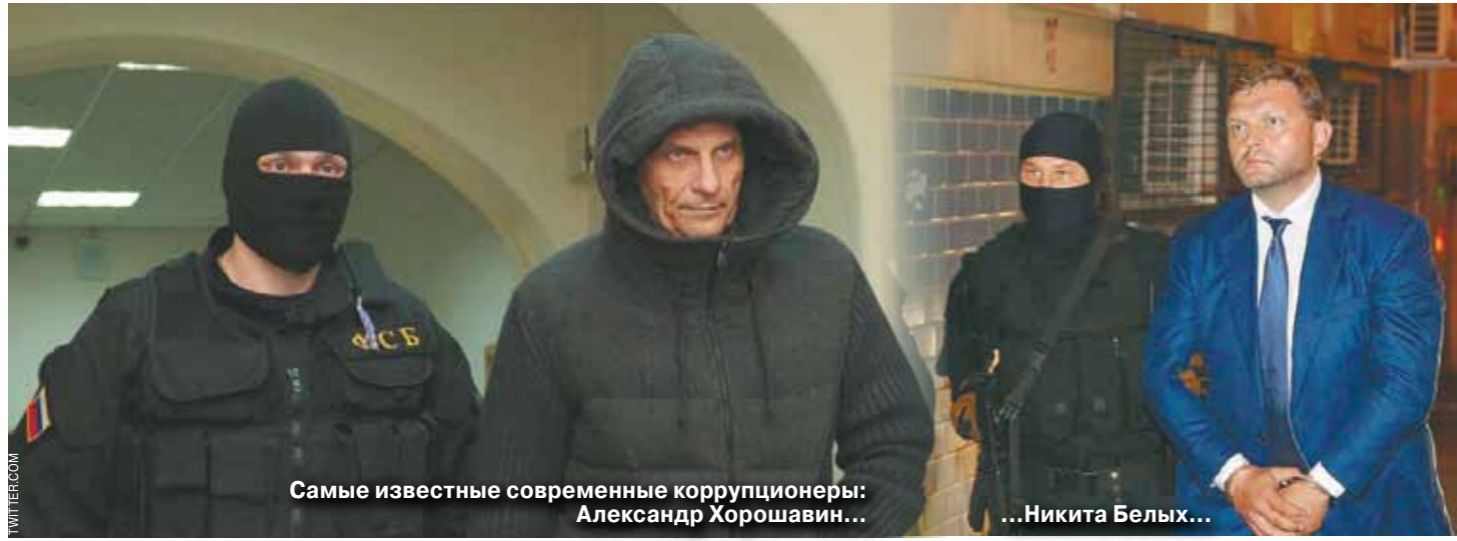
Самые известные современные коррупционеры: Александр Хорошавин... Никита Белых... Алексей Улюкаев.