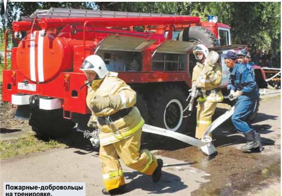
Пожарные-добровольцы на тренировке.

— Сейчас МЧС России проводит работу по формированию Корпуса сил добровольной пожарно-спасательной службы. Для чего это необходимо? — Конечная цель этой работы — повышение уровня пожарной безопасности сельских населенных пунктов Российской Федерации. В соответствии с планом строительства и