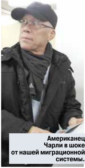
Американец Чарли в шоке от нашей миграционной системы.

Очередь на очередь: журналисты «МК» прошли все круги ада в Московском миграционном центре Где еще в одной очереди можно встретить коренного американца, уроженца Буркина-Фасо и многочисленных представителей Таджикистана, Узбекистана, Молдовы, Украины и прочих бывших республик СССР? Конечно же, в Московском миграционном центре, что в деревне Сахарово! Правда, это никакая теперь не деревня, а самая что ни на есть столица, только Новая. Даром что в 70 километрах от МКАД. Здесь проводят дни и ночи добропорядочные мигранты.