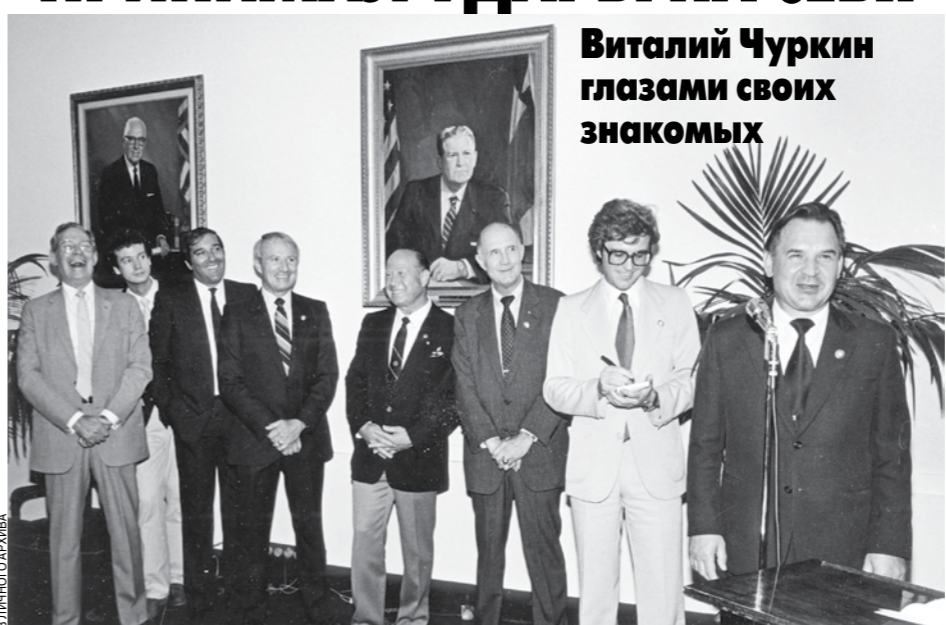
1985 год. Виталий Чуркин в должности второго секретаря посольства РФ в Вашингтоне работает переводчиком на мероприятии в палате представителей США, посвященном 10-летию полета «Союз-Аполлон».

В период боснийского конфликта Виталий Иванович был назначен спецпредставителем Президента РФ на Балканах. Именно ему принадлежала идея направить в Боснию российскую военную помощь для обеспечения интересов РФ.