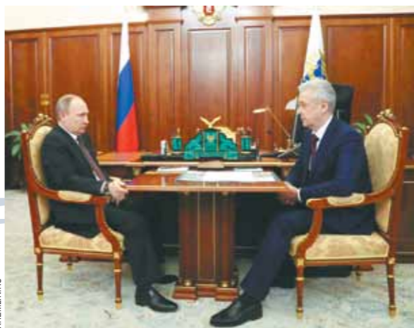
инвесторов», — заявил Владимир Путин. Мэр города Сергей Собянин объяснил, что в настоящее время сбор денег на капитальный ремонт с жителей ветхих пятиэтажек нецелесообразен: отремонтировать их нельзя. Поэтому в ближайшее время город планирует разработать новую программу, подразумевающую реновацию или снос домов, непригодных ни для ремонта, ни для жизни.