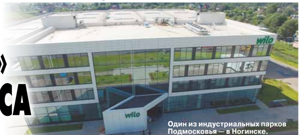
Один из индустриальных парков Подмосквья — в Ногинске.

Московская область — первая в России по особым экономическим зонам, ОЭЗ. Еще