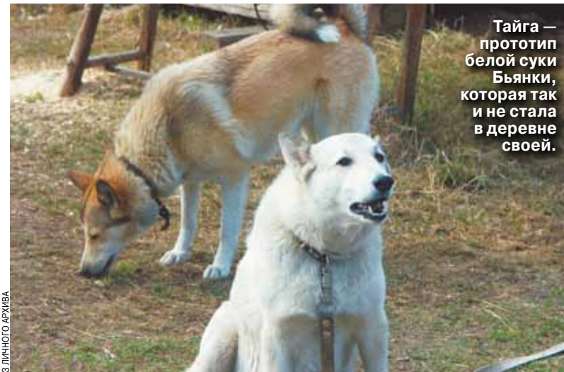
Тайга — протип белая суки Бьянки, которая так и не стала в деревне своей.