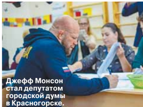
Джефф Монсон стал депутатом городского думы в Красногорске.

Подведены итоги выборов в Московской области