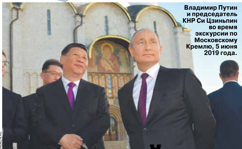
Владимир Путин и председатель КНР Си Цзиньпин во время экскурсии по Московскому Кремлю, 5 июня 2019 года.