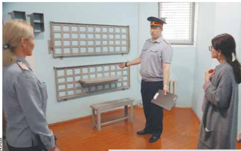
В карцере в день моего визита было пусто.

Итак, что представляет собой «Снежинка»? Несколько корпусов расходятся от центральной части, как лучи. Всего 144 камеры, каждая рассчитана на четырех осужденных, но по