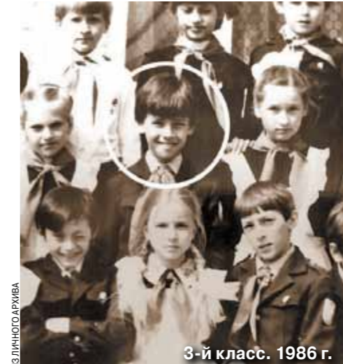
3-й класс. 1986 г.

На ту встречу с Галкиным пришло очень много народу — и учителя, и его одноклассники, и просто знакомые. Максим вел себя просто, пил чай и рассказывал о своей концертной деятельности. Спросили его тогда и об отношениях с Аллой Борисовной, на что