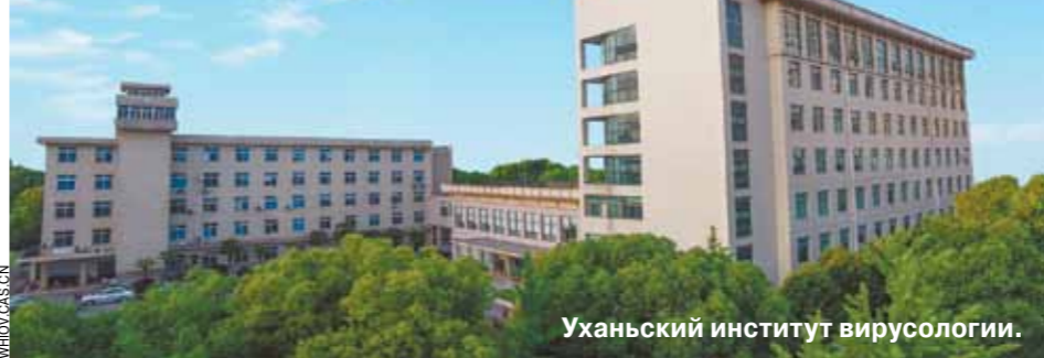
Уханьский институт вирусологии.

Будет ли Россия защищать Китай до последнего русского