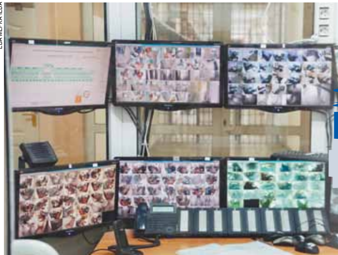
В колонии более 1000 видеокamer.