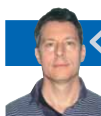
Майкл БОМ, журналист