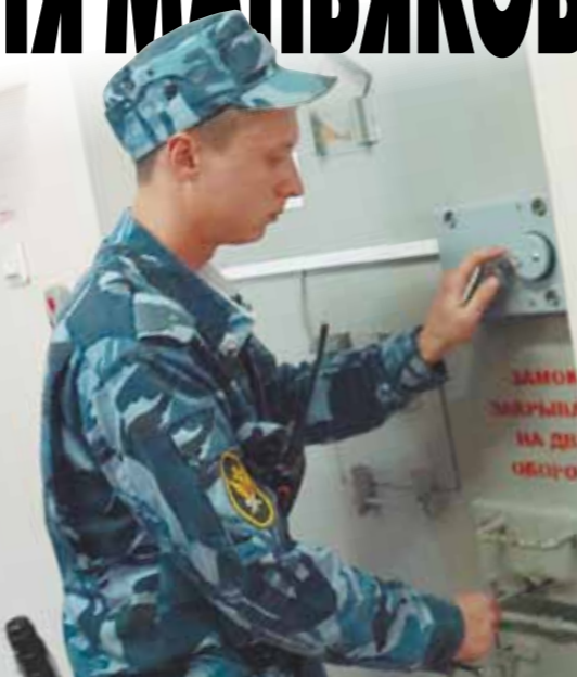
Двери камер оснащены двумя видами замков — обычным и электронным.

В «Снежинке» такого с самого начала не было. За все время только пять осужденных в наручниках водили по моему распоряжению. Это были особые преступники, которые могли