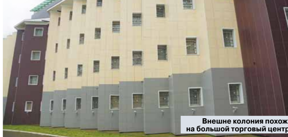
Внешне колония похожа на большой торговый центр.

Гагагаев в 2018 году напал на сотрудника «Снежинки» — свалил одним ударом в лицо на