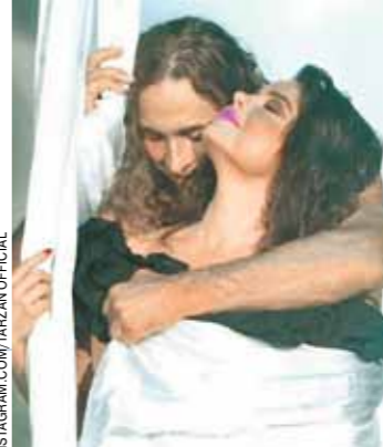
НАТАША КОРОЛЕВА: «В ТУРЦИИ ОТДЫХАЕМ!»