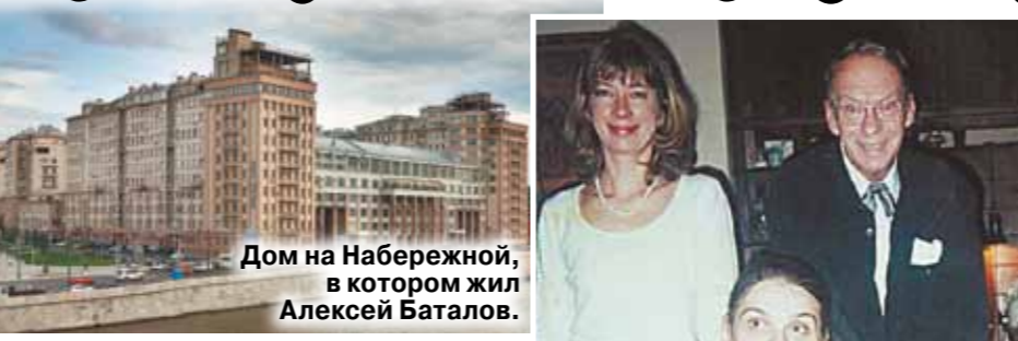
Дом на Набережной, в котором жил Алексей Баталов.