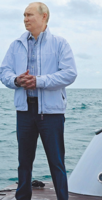
Неуязвимый президент неуязвимой страны? В невосприимчивости России к внешним угрозам кроется и наша ахиллесова пята.

Украины как таковой. Мы — по меньшей мере на официальном уровне — хотим, чтобы Украина начала выполнять Минские соглашения. Разве не так?