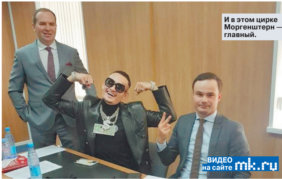
И в этом цирке Моргенштерн — главный.

Сам певец назвал происходящее цирком. И, видимо, поэтому обратился к судье почти как цирковой конферансе.