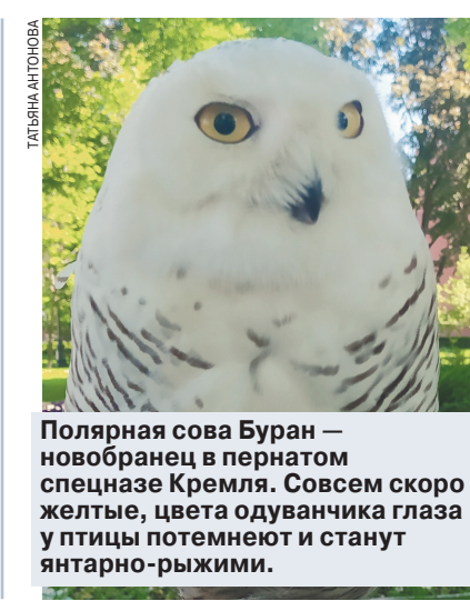
Полярная сова Буря — новобранец в пернатом спецназе Кремля. Совсем скоро желтые, цвета одуванчика глаза у птицы потемнеют и станут янтарно-рыжими.