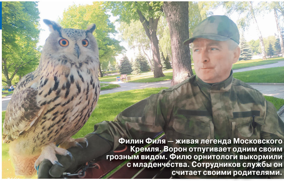
Филин Филя — живая легенда Московского Кремля. Ворон отпугивает одним своим грозным видом. Филин орнитологи выкормили с младенчества. Сотрудников службы он считает своими родителями.

Ястребы — полная противоположность белоснежной в мелкую рябшечку сове. Буран