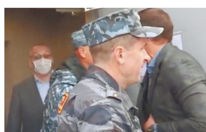
Вот так на видео выглядело «избиение» блогером кладбищенского работника.

У Дейнеко, как поговаривают некоторые, был свой интерес. Но то, как в итоге его «наказали» за это, — вызов самому здравому смыслу. Эксперты и