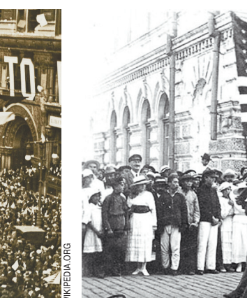
«...Но по факту наша страна стала полем для игр всевозможных иностранцев» (на фото — парад американских интервентов во Владивостоке в том же 1918 году).

— То насаждение национализма, которое сейчас происходит на Украине, не имеет прямой связи с будущей внешнеполитической ориентацией этого государства. В конечном итоге мне лично совершенно все равно, на каком языке будут учиться дети в украинских