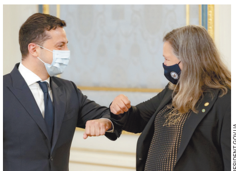
«Американцам Украина нужна для того, чтобы иметь управляемую ими постоянную зону риска в центре Европы». Зеленский и «королева печенек», заместитель государственного секретаря США Виктория Нуланд.

— Достаточно много уважаемых мной коллег из экспертного сообщества считают, что у (запрещенного в России) движения «Талибан» нет оснований сдерживать себя после ухода американцев. В Афганистане останется чуть больше, чем 20 тысяч сотрудников частных военных компаний. Но мы же понимаем, что ЧВК это не армия. ЧВК не стреляют крылатыми ракетами, не располагают такими возможностями в смысле разведки. Частная военная компания потому и частная, что, в отличие от военнослужащих, дававших присягу, она не обязана стоять до последнего. Возможно, что к концу этого года мы увидим, что Афганистан вновь двинется по тому пути, по которому он двинулся 30 лет назад после ухода советских войск.