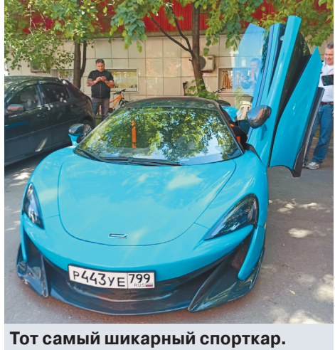
Тот самый шикарный спорткар.