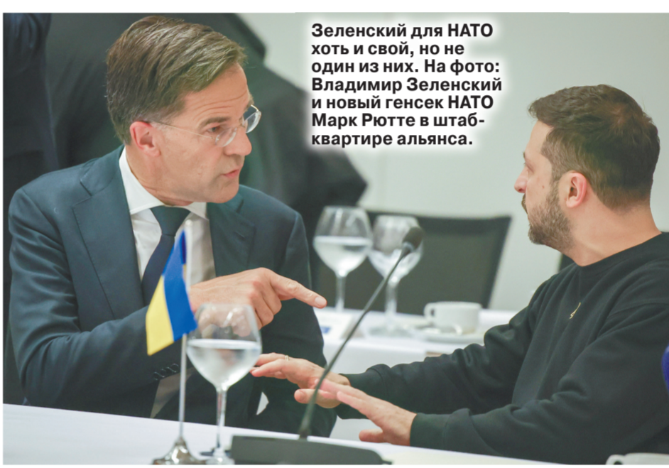
Зеленский для НАТО хоть и свой, но не один из них. На фото: Владимир Зеленский и новый генсек НАТО Марк Рютте в штаб-квартире альянса.

Путин тем временем провел беседу с представителями СМИ стран БРИКС. В Турции выпустили показательную статью «Кошмар коллективного Запада — улыбка Путина».