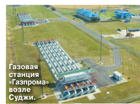
Газовая станция «Газпром» возле Суджи.

территории Украины истекает в конце 2024 года. Киев неоднократно в категорической форме предупреждал, что не собирается продлевать этот договор.