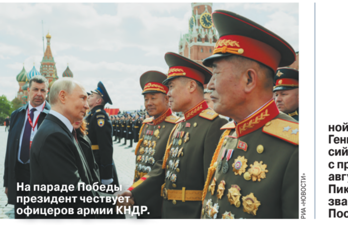
На параде Победы президент чествует офицеров армии КНДР.