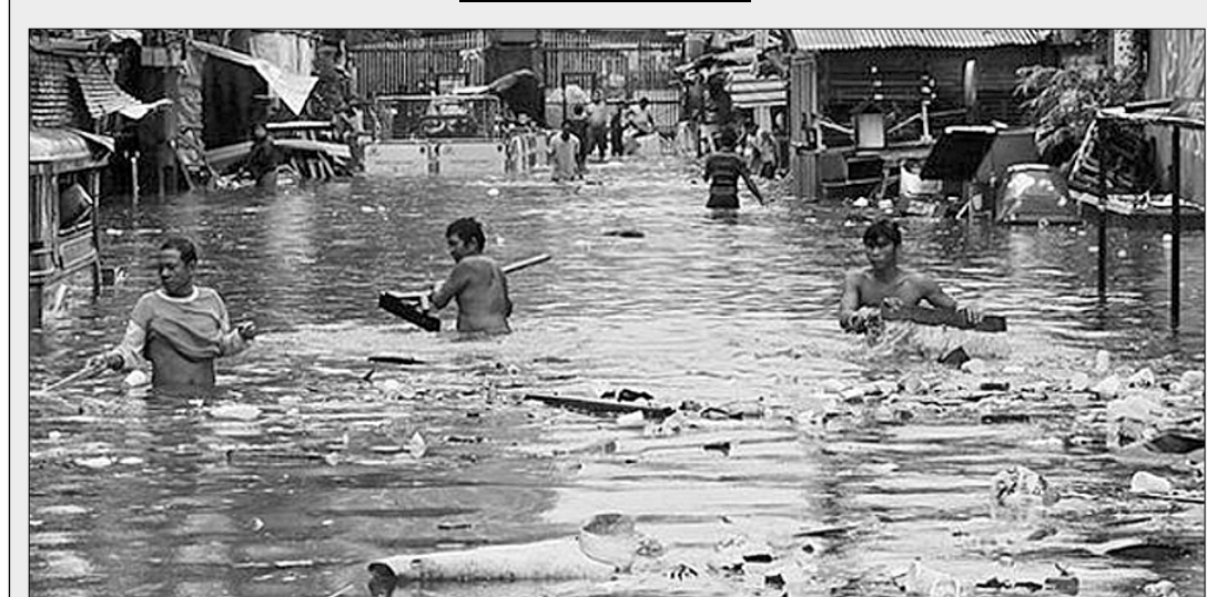
Во Вьетнаме мощные ливни, наводнения и оползни последних дней, вызванные обрушившимся на прибрежные районы страны тайфуном Сон-Тинг, унесли жизни 19 человек, многие пропали без вести и пострадали, сообщает Центральный комитет по предотвращению стихийных бедствий СРВ. В ряде провинций сходят новые оползни и продолжаются наводнения. Тайфуны бушуют и в соседних с Вьетнамом странах, в частности на восточном побережье Китая, где из-за тайфуна «Ампи» были эвакуированы 400 тысяч человек.