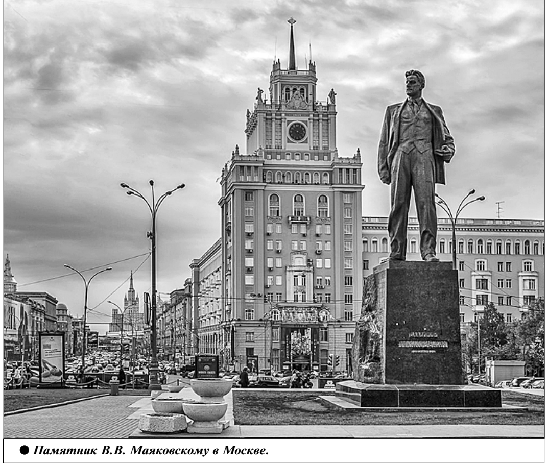
Памятник В.В. Маяковскому в Москве.