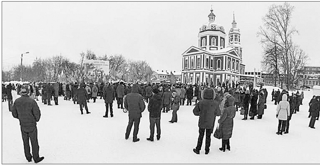
Площадка в сквере возле памятника Степану Халтурину была заполнена людьми. В этом, считай, единственном сегодня месте города Кирова, где по закону можно проводить митинги, собрались жители областного центра, чтобы выразить свой протест против «мусорного побора».

ВЫСТУПАВШИЕ говорили, что «мусорная реформа» в Кировской области не подготовлена: у регионального оператора, коим является акционерное общество «Куприт», нет инфраструктуры, необходимой для переработки отходов. Получается, что люди будут платить деньги за ещё не оказанную услугу, и когда точно будут построены в области мусороперерабатывающие предприятия — не известно. Поэтому митинговать предлагали выбрасывать мусор не в контейнеры, которые, кстати, в Кирове переполнены до отказа, а напрямую к зданию правительства.