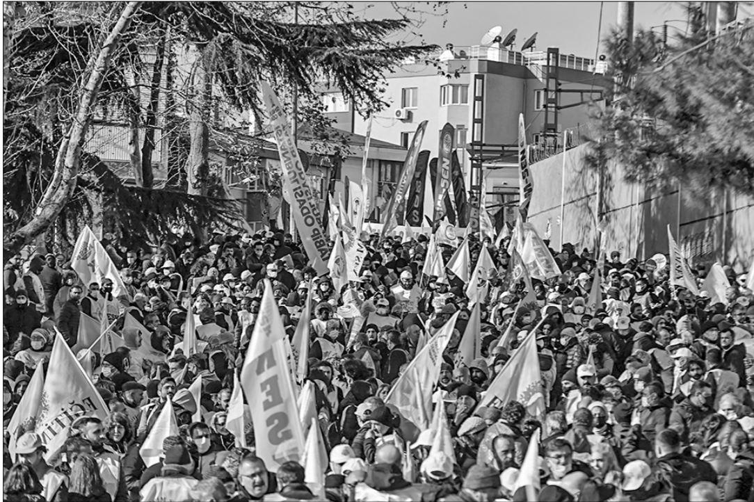
На фоне рекордного падения курса лиры Турция охватила общенациональные протесты с требованием отставки президента страны Реджепа Тайипа Эрдогана.

зультате турецкая валюта начала стремительно обесцениваться, что стало одним из основных драйверов разгона инфляции.