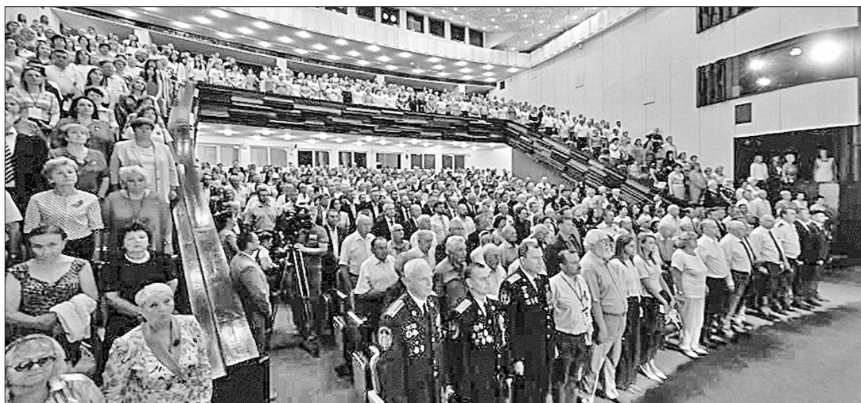
Открытие фестиваля цветов «Стрелка»

Губернатор Андрей Клычков в своём выступлении отметил: «5 августа исполняется ровно 80 лет первому победному салюту Вели-