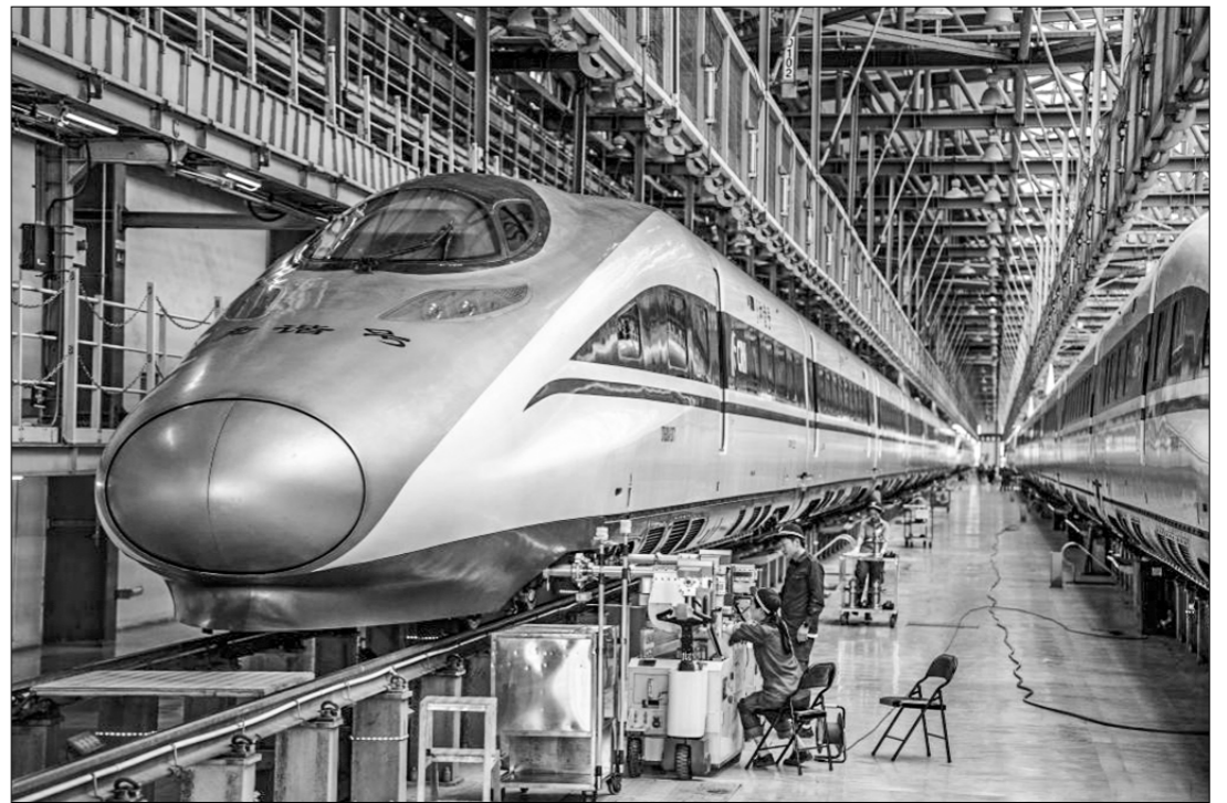
Сотрудники Куньминского филиала корпорации «Китайские железные дороги» систематически проводят технический осмотр высокоскоростных поездов, чтобы обеспечить безопасность их движения по железным дорогам в летнее время.

Яркий пример такого подхода показывают недавние выборы в Узбекистане. Напомним: победу с результатом почти 90 процентов одержал действующий президент Шавкат Мирзиёев. Этому предше-