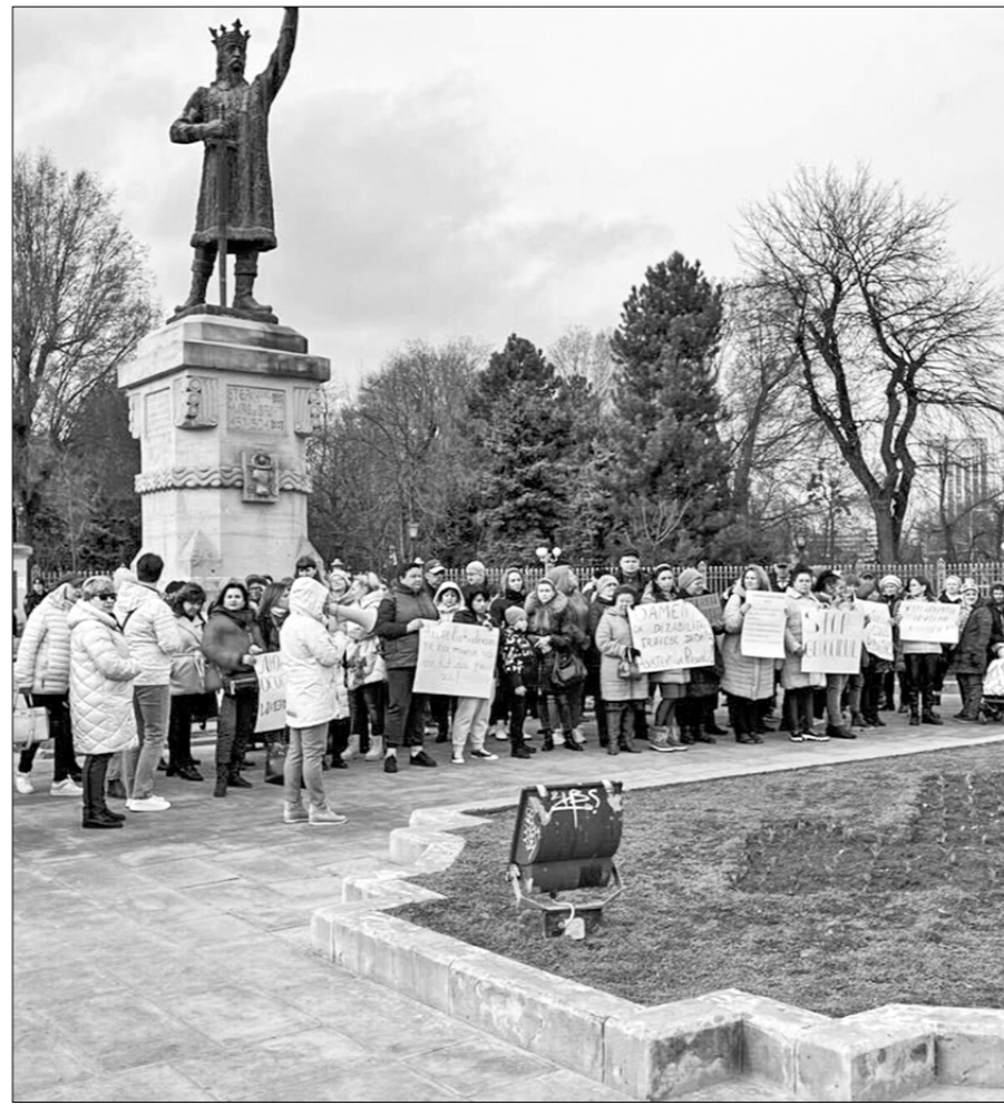
Леонид АНДРЕЕВ. г. Кишинёв.