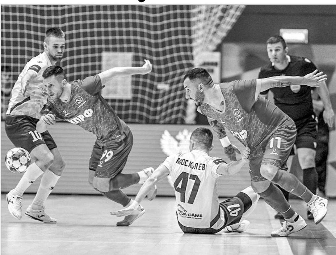
Фрагмент матча за «бронзу».

По итогам завершившегося в Норильске в минувшие выходные «Финала четырёх» Кубка России сезона 2023/24 по мини-футболу МФК КПРФ вновь не удалось завоевать почётный трофей.